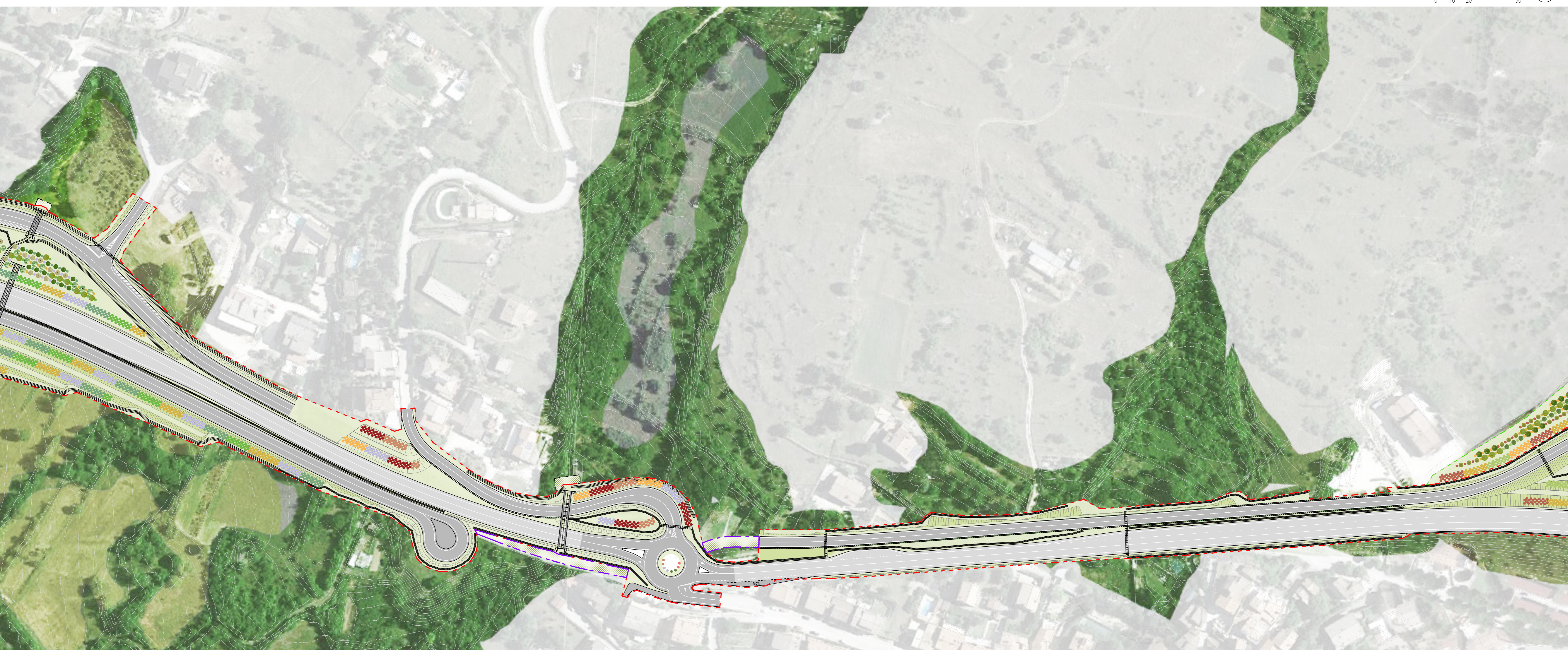
01 OPERE A VERDE - tratto 04 1:1.000