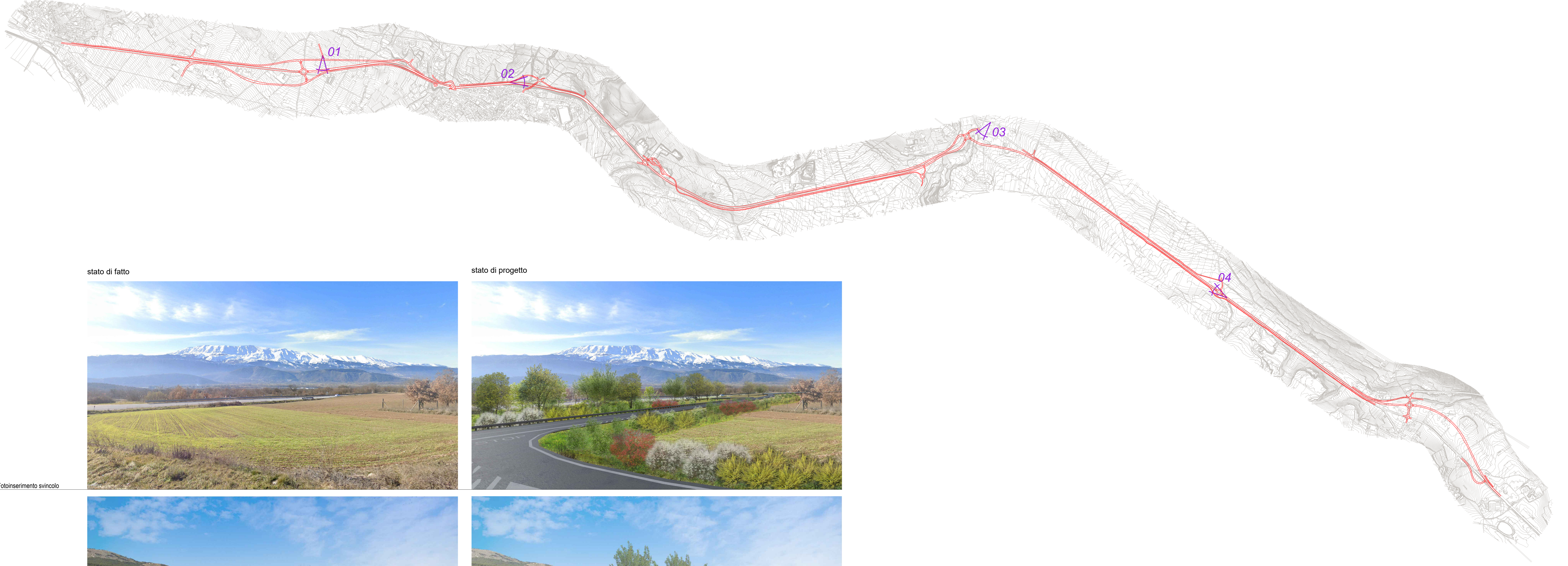
stato di fatto