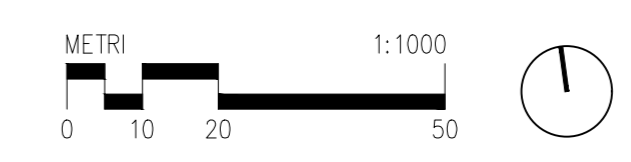
01 OPERE A VERDE - tratto 04 1:1.000