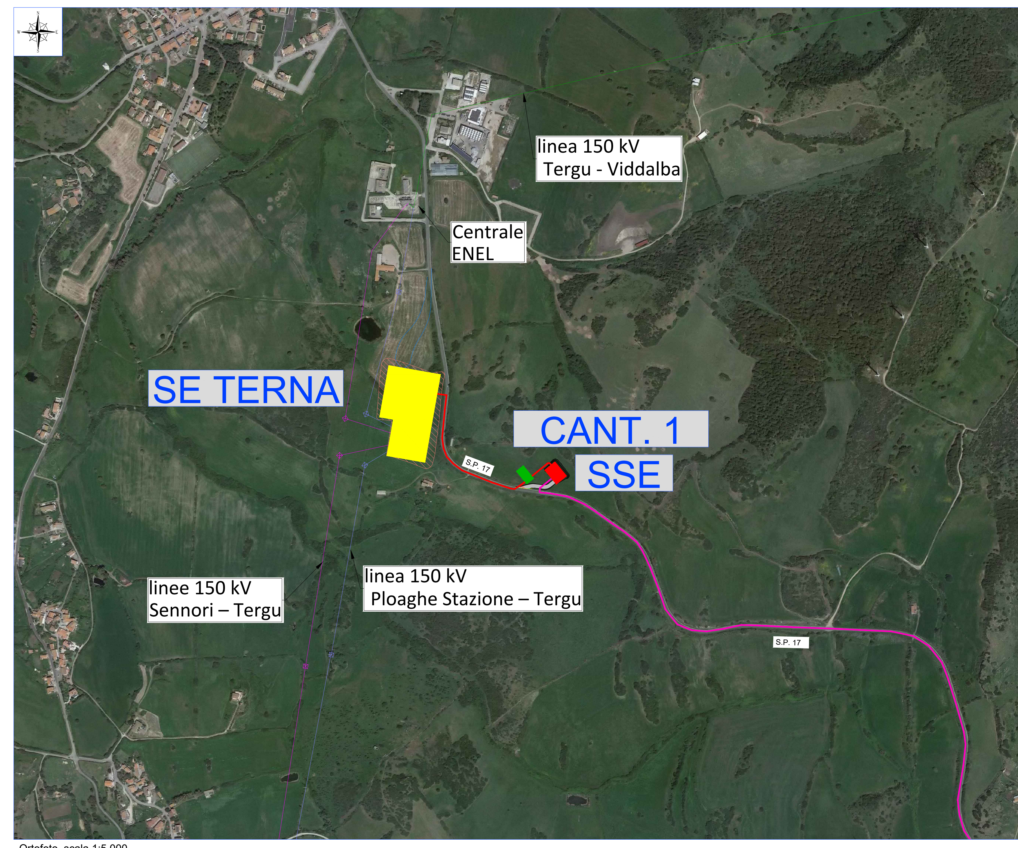
Ortofoto scala 1:5.000