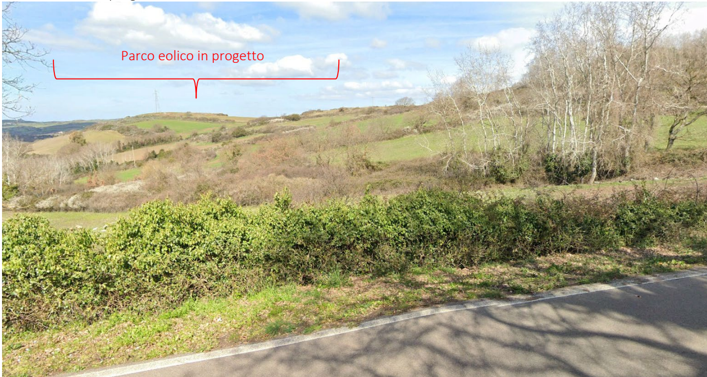
PS22_Chiaramonti_Strada Statale 672 Sassari Tempio Stato di fatto e di progetto