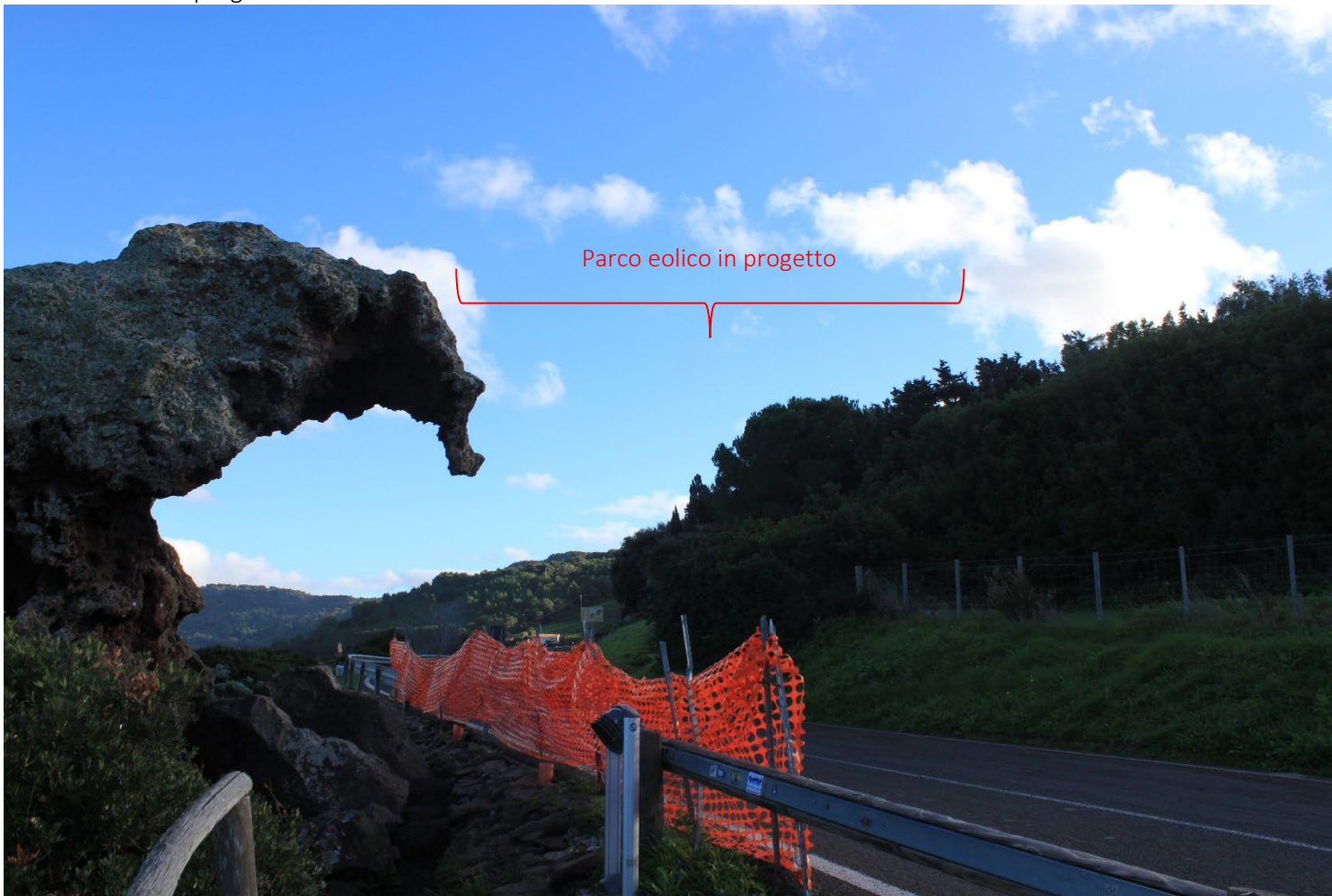
PS15_Castelsardo_Castello dei Doria Stato di fatto e di progetto