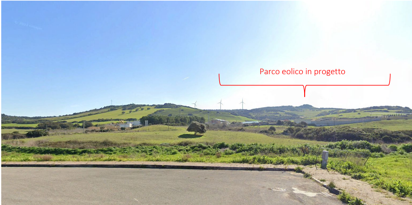
PS29_Nulvi_Centro abitato comune di Nulvi Stato di fatto