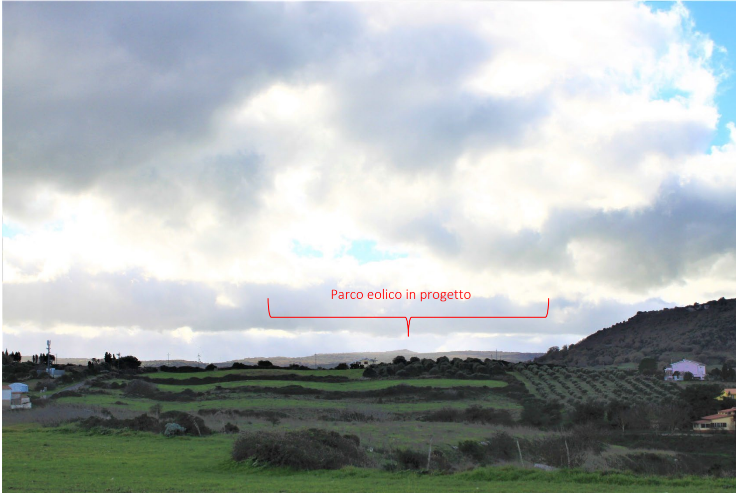
PS13_Valledoria_Ingresso centro "La Ciaccia" Stato di fatto e di progetto