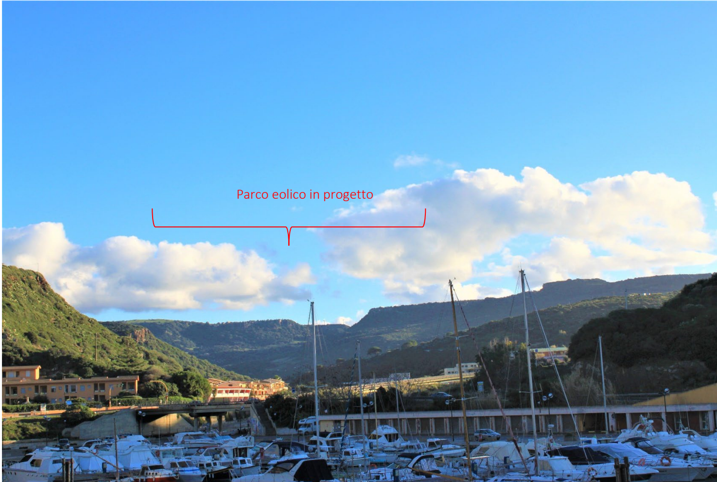
PS17_Castelsardo_Centro abitato Lu Bagnu Stato di fatto e di progetto