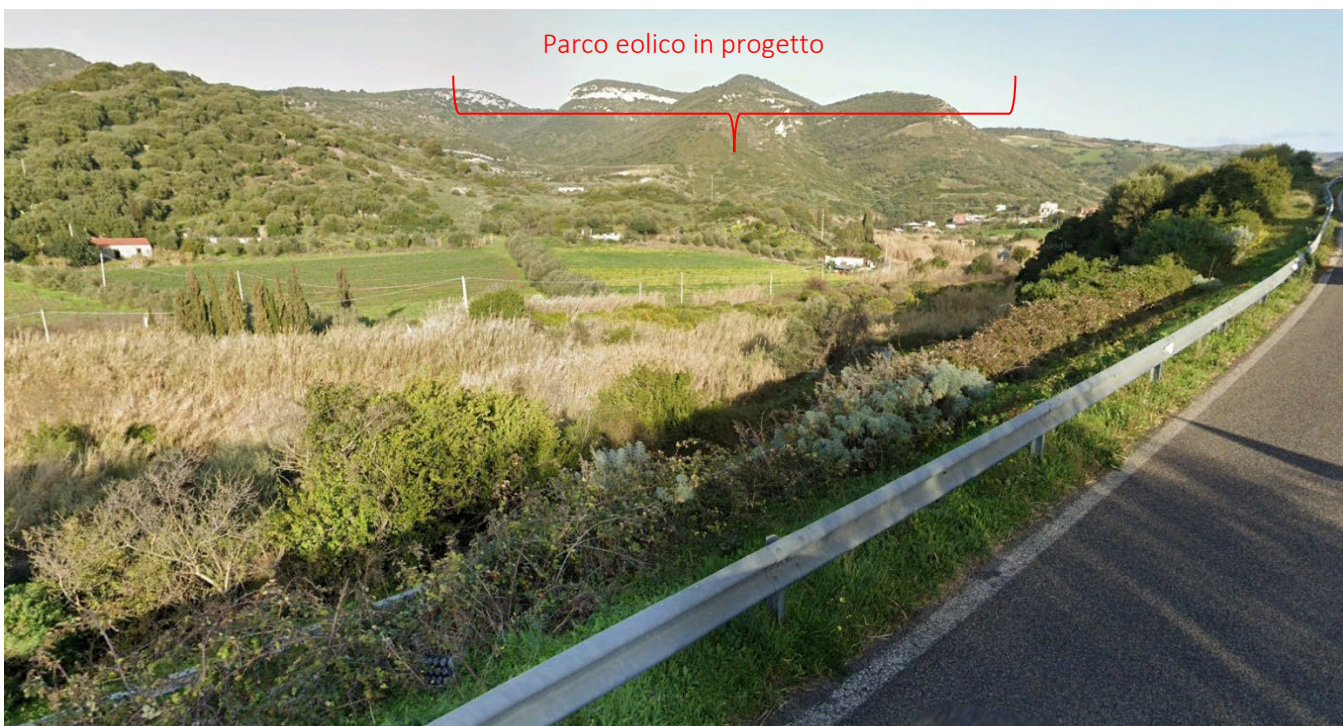
PS20_Osilo_Strada provinciale dell'Anglona Stato di fatto e di progetto