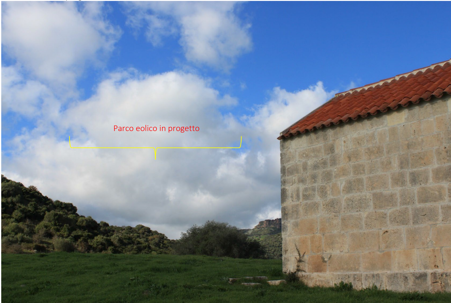
PS7_Laerru_Ingresso centro abitato Stato di fatto e di progetto