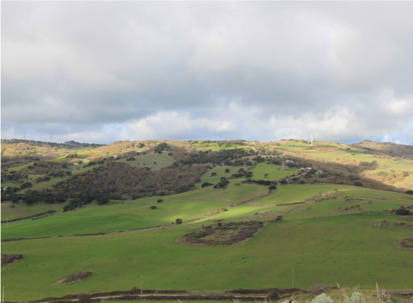
Stato di progetto

PS3_VISTA NU8-7-6-5-4 Nulvi_ Chiesa di Ns Signora di Montale Alma - Area di posizionamento dei generatori NU8-7-6-5 Stato di fatto