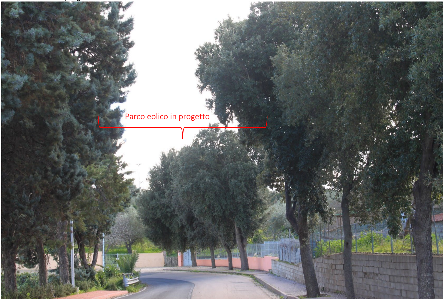
PS11_Sedini_Cimitero Stato di fatto e di progetto