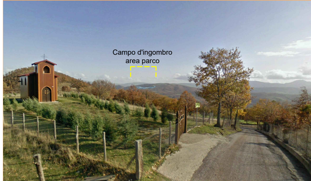
ID3 - Post Opera