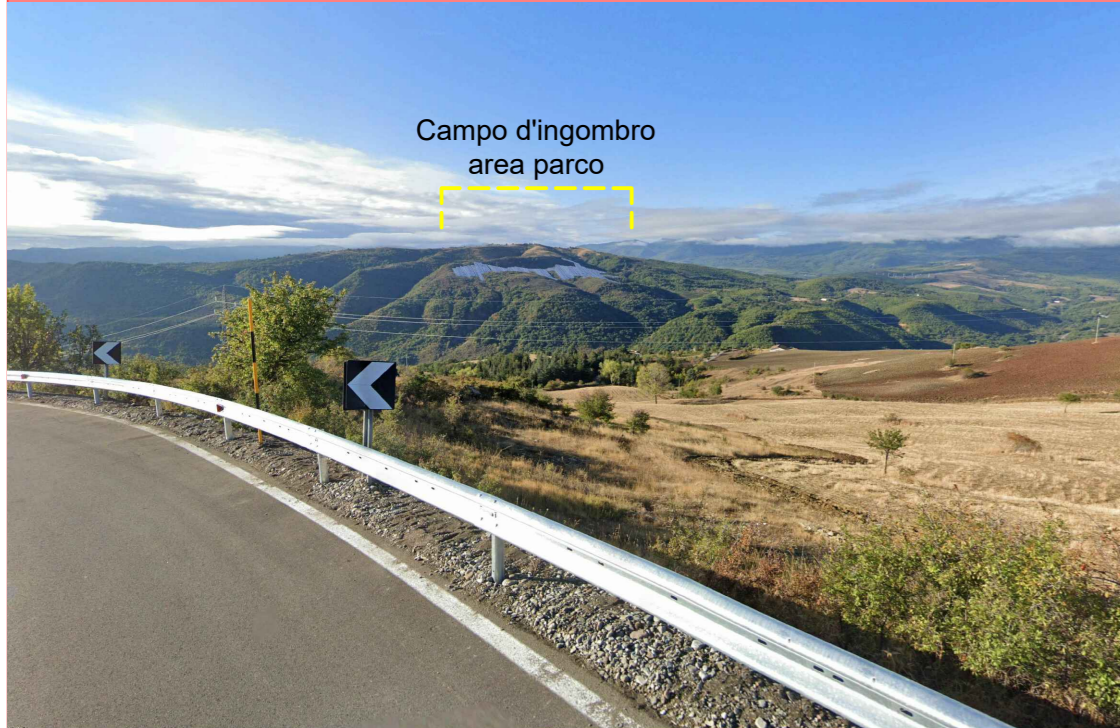
DIN1 - Post Opera