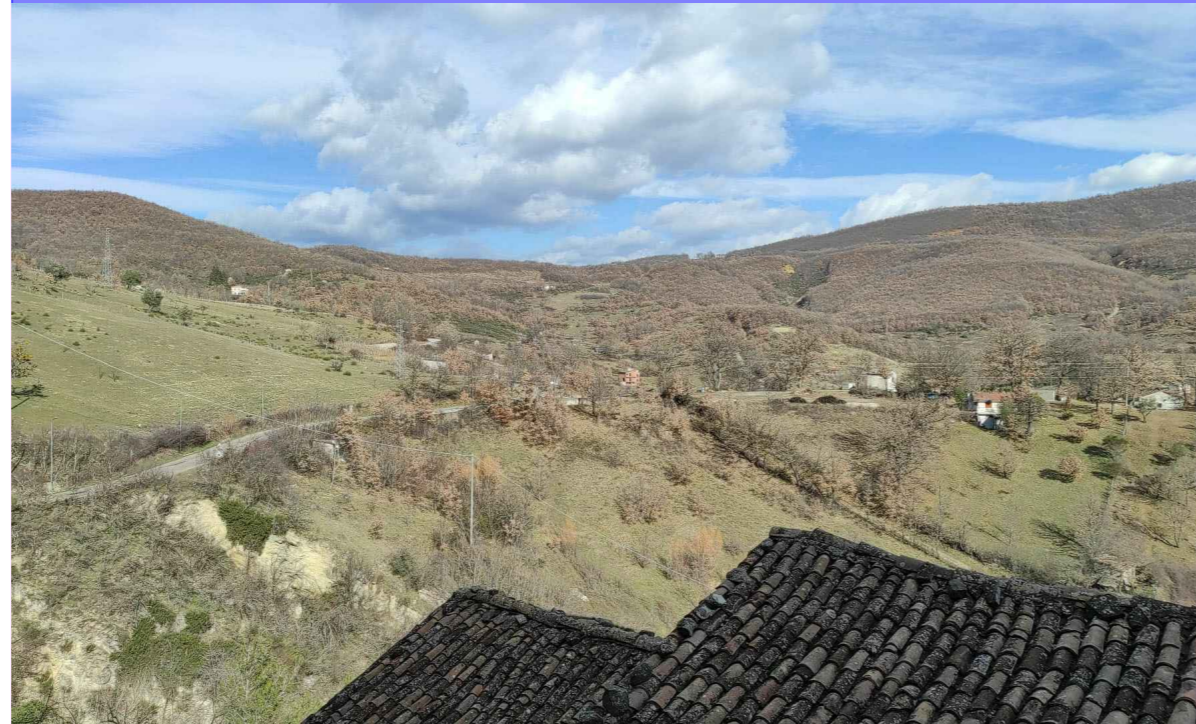
ID2 - Ante e Post Opera - Vista dal Castello di Calvello (Comune di Calvello)