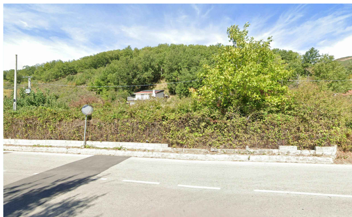
DIN3 - Ante e Post Opera - Vista dalla Strada Comunale Calvello Laurenzana