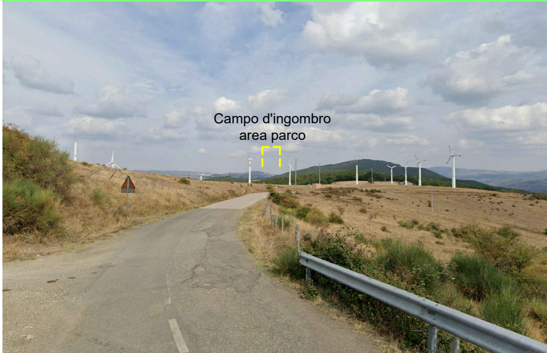
DIN2 - Post Opera