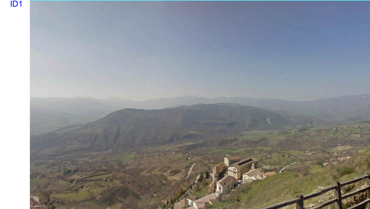
ID1 - Ante Opera - Vista dal Planetario Osservatorio Astronomico (Comune di Anzi)