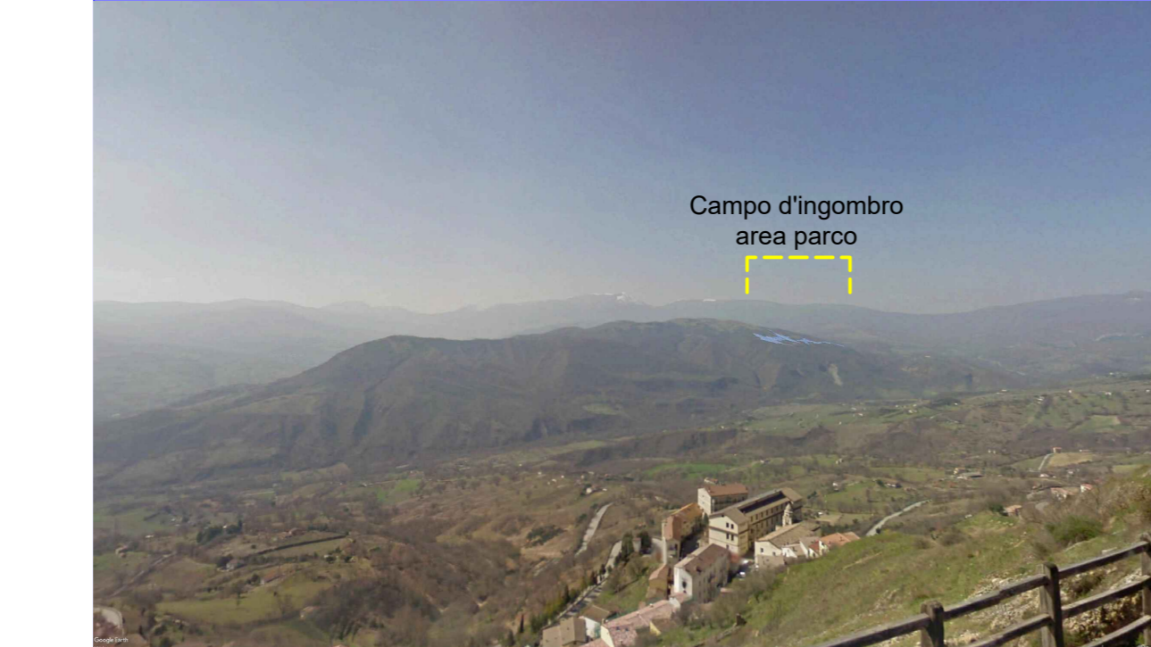
ID1 - Post Opera