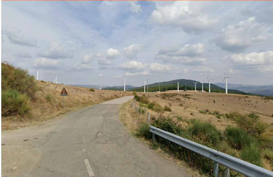
DIN2 - Ante Opera - Vista dall'incrocio SP16 - Calvello (Comune di Calvello)