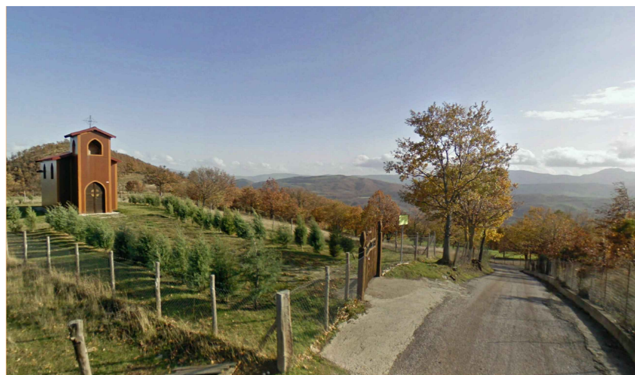
ID3 - Ante Opera - Vista dala Chiesa di Santa Lucia (Comune di Abriola)