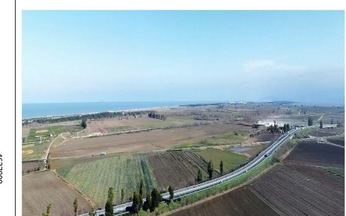
Immobili e aree dichiarate di notevole interesse pubblico (art. 136 D.Lgs 42/04)