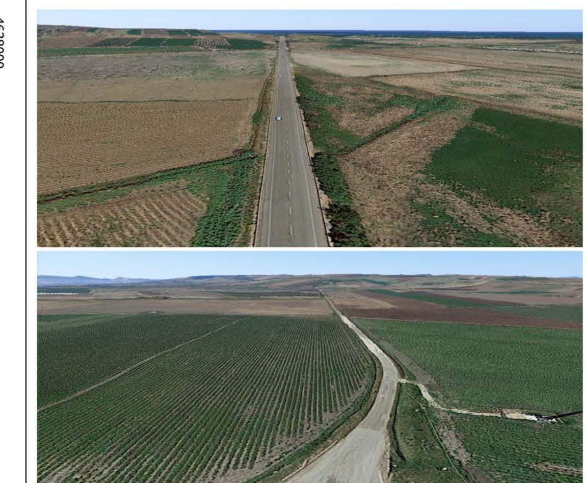
Strade a valenza paesaggistica