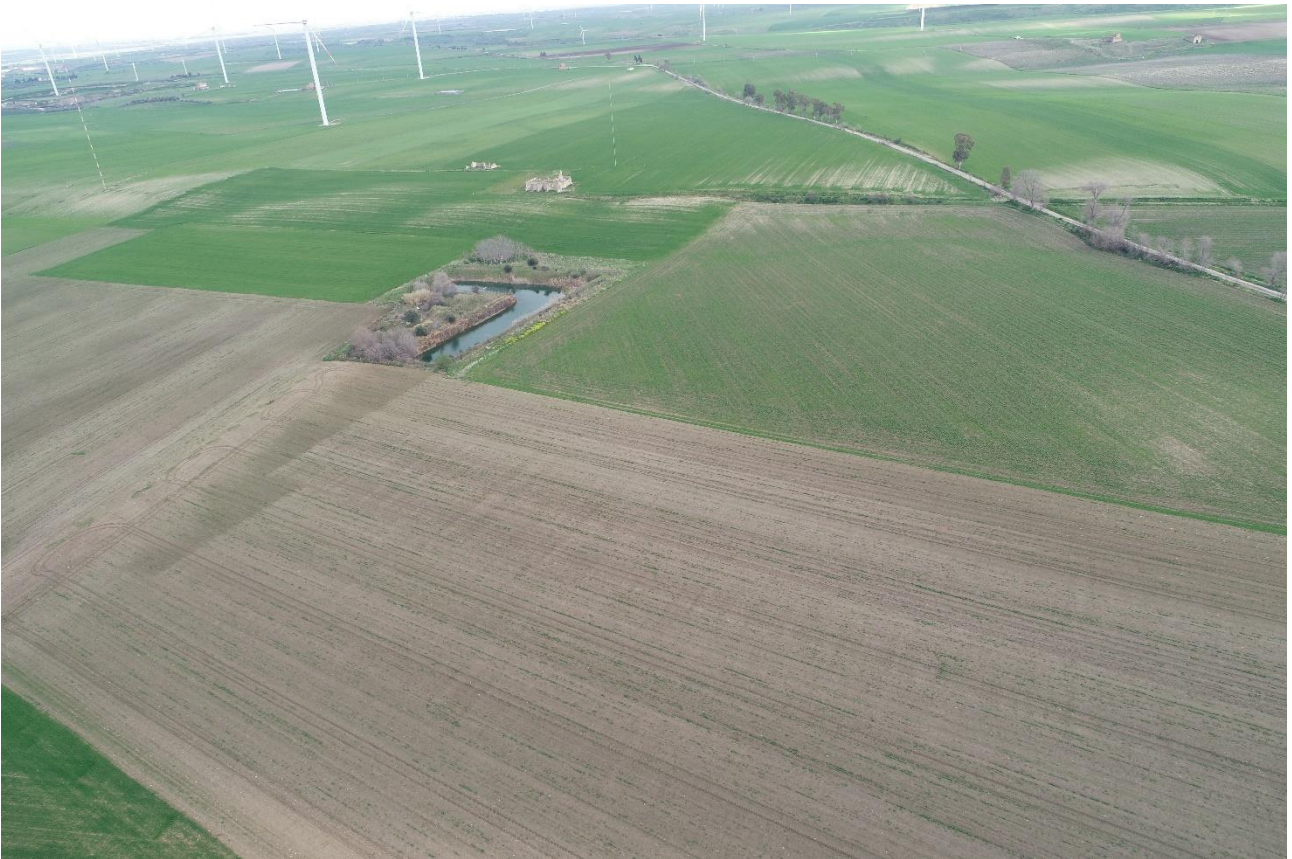
Punto di Presa 4

Coordinate: 41°16'0.4338" N – 15°36'32.1297" E