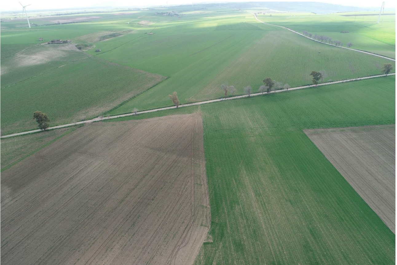
Punto di Presa 7

Coordinate: 41°16'0.4390" N – 15°36'32.1290" E