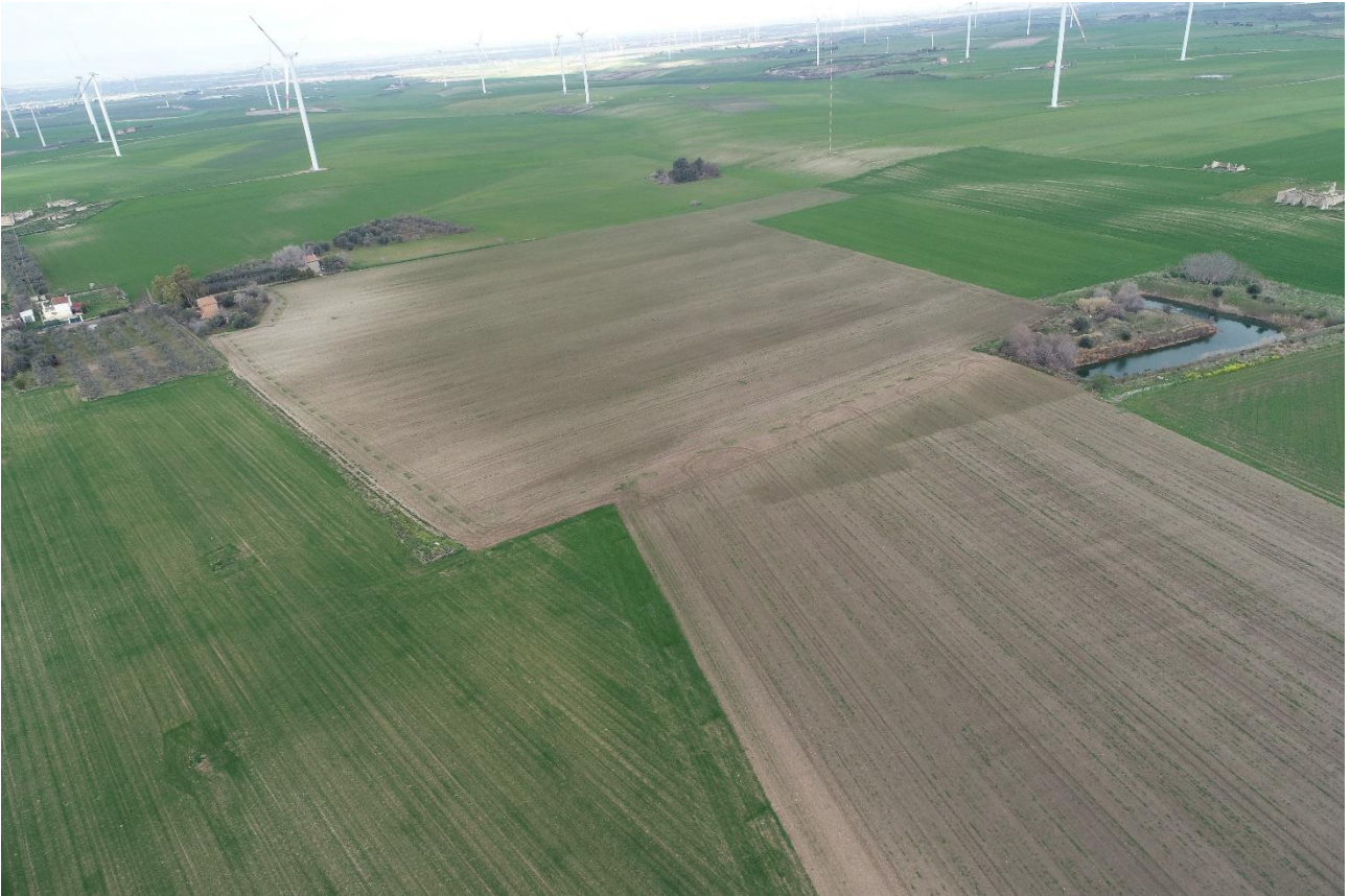
Punto di Presa 3

Coordinate: 41°16'0.4338" N – 15°36'32.1297" E