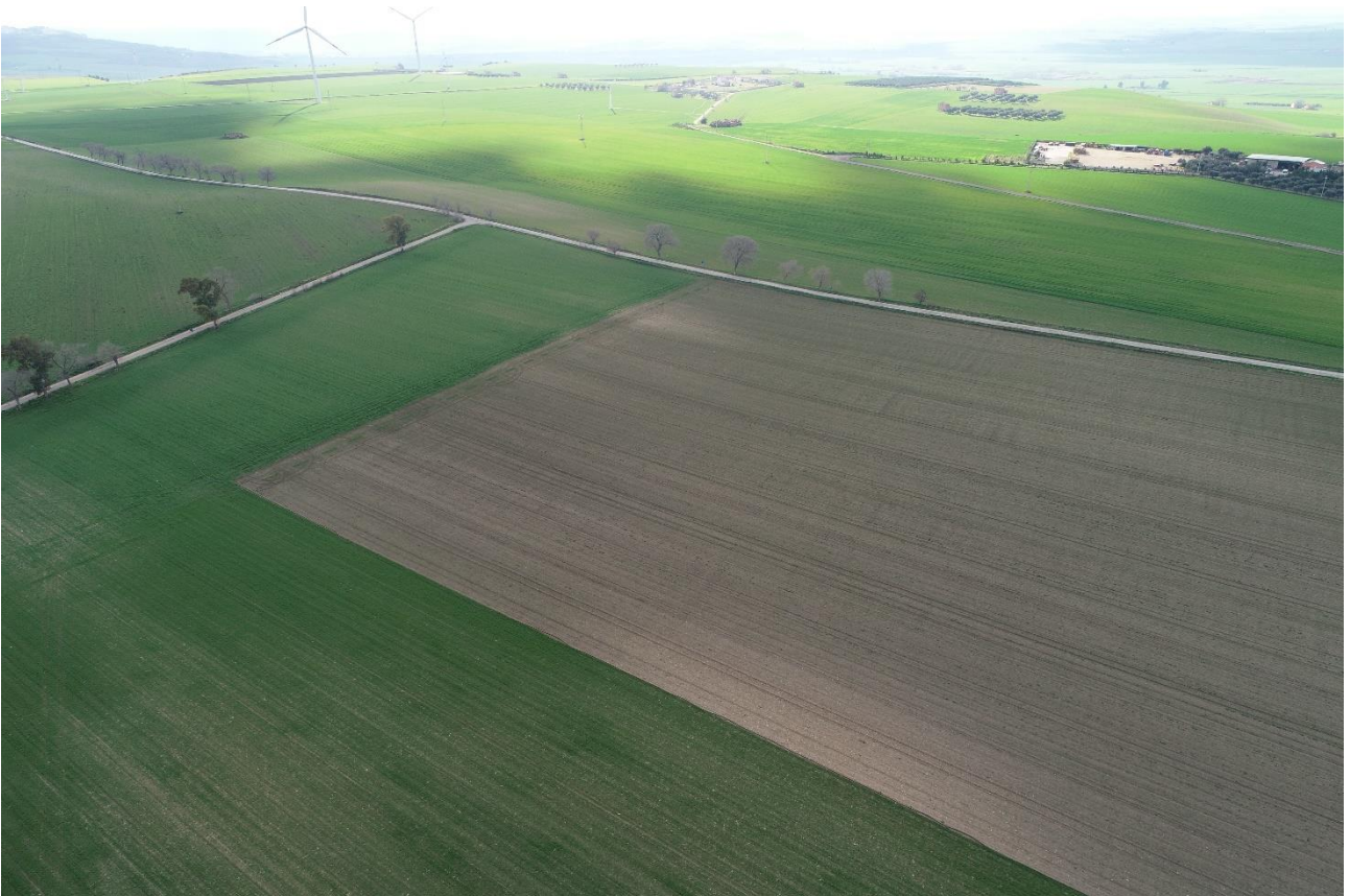
Punto di Presa 8

Coordinate: 41°16'0.4390" N – 15°36'32.1290" E