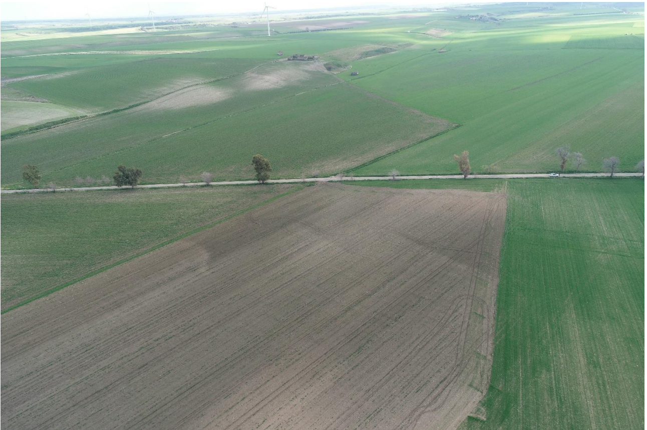
Punto di Presa 6

Coordinate: 41°16'0.4318" N – 15°36'32.1282" E