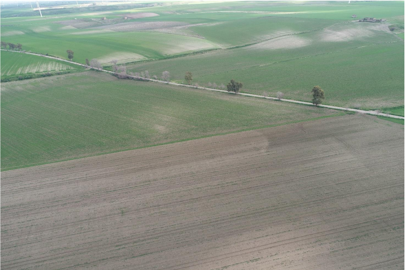
Punto di Presa 5

Coordinate: 41°16'0.4318" N – 15°36'32.1282" E