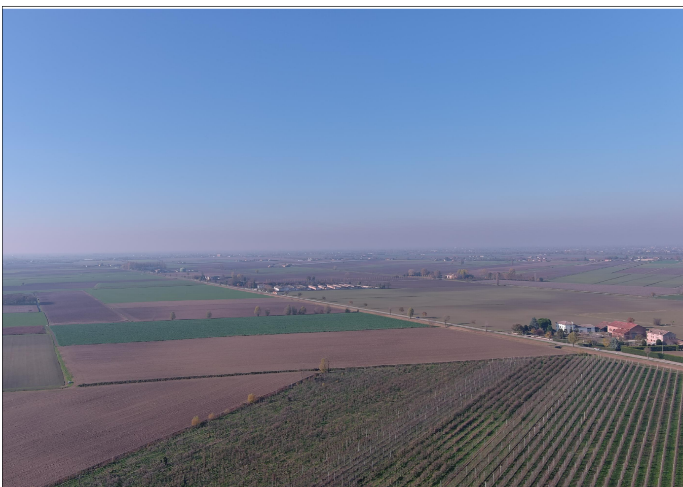
PUNTO DI VISTA AEREO - STATO DI FATTO