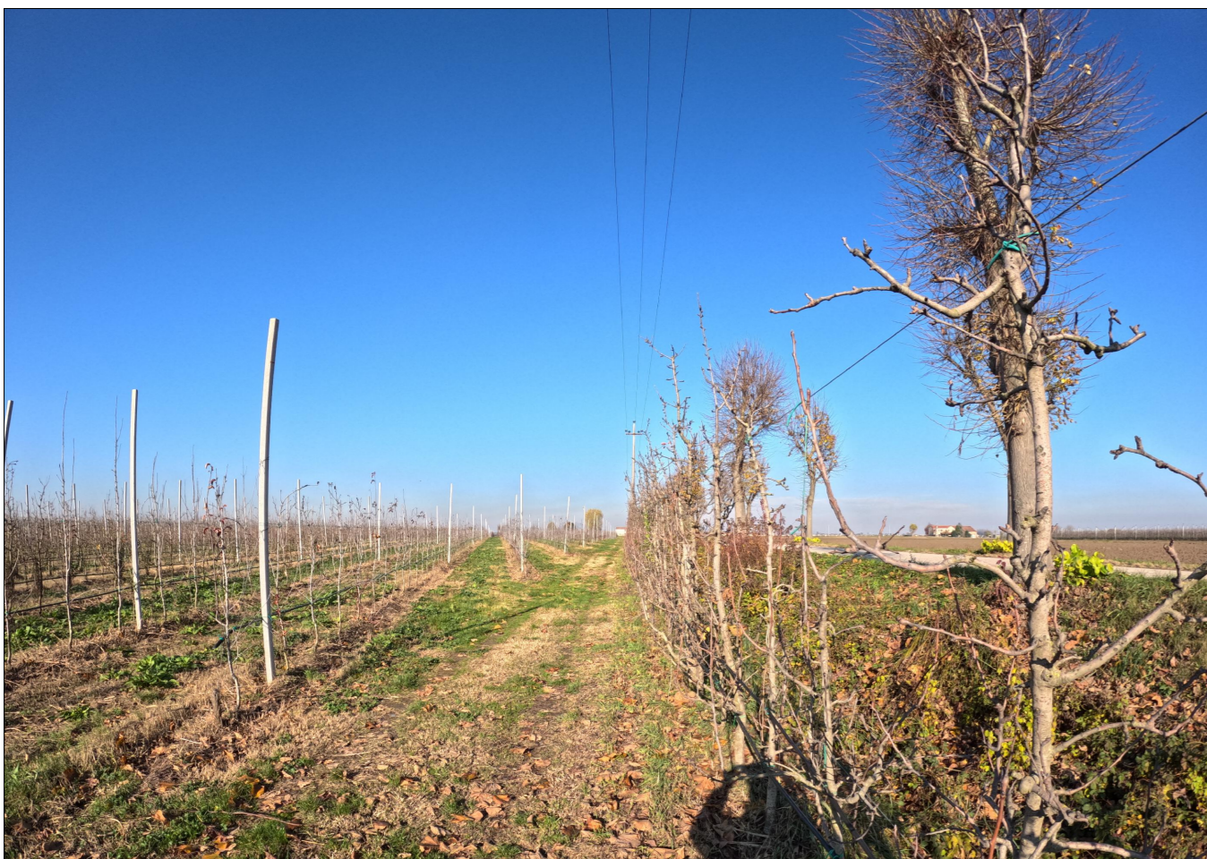
PUNTO DI VISTA 2 - STATO DI FATTO