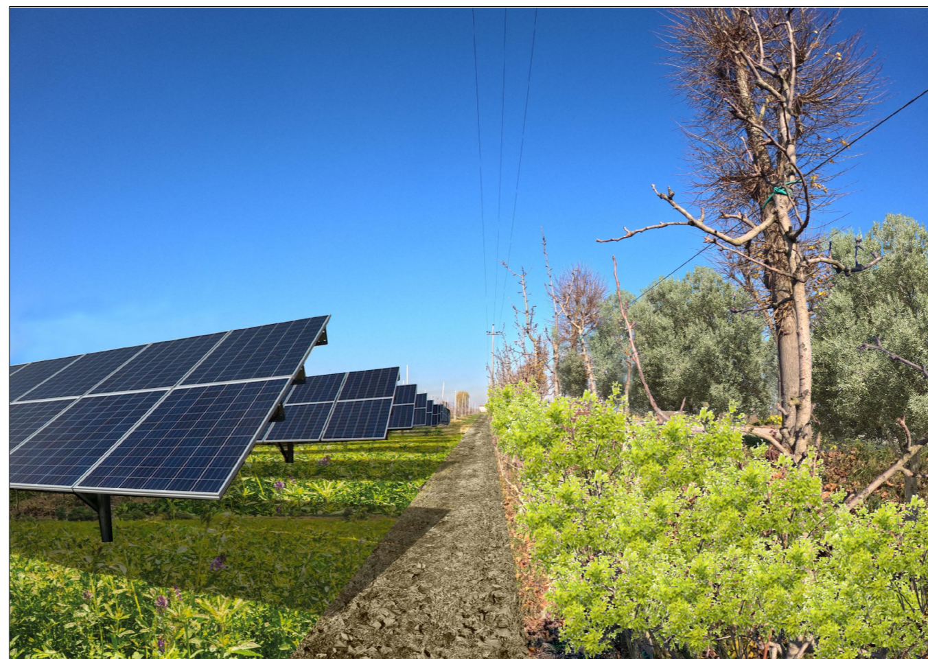
PUNTO DI VISTA 2 PROGETTO MITIGATO