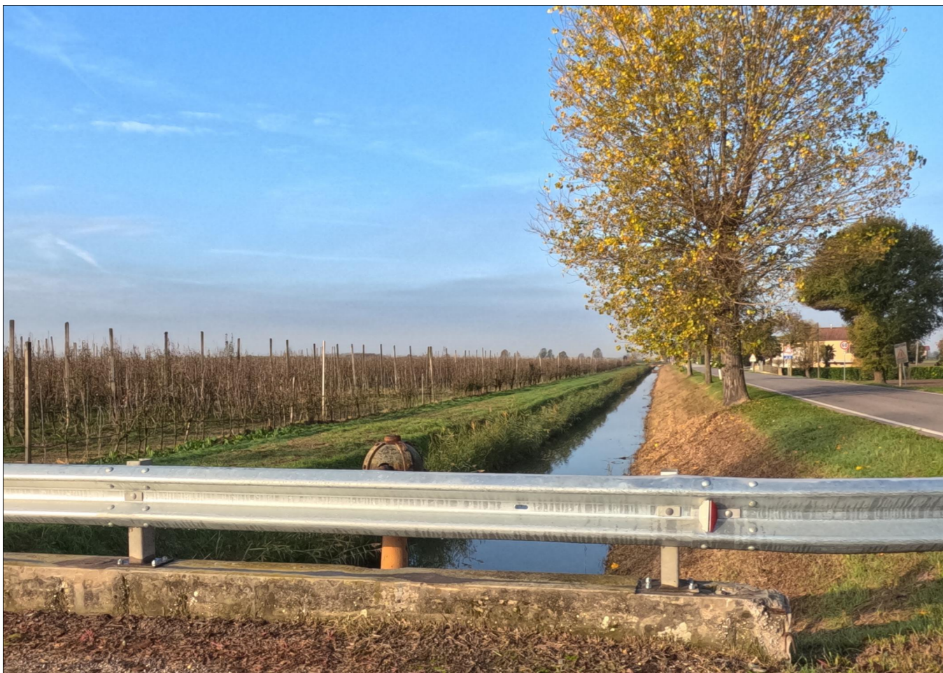
PUNTO DI VISTA 1 - STATO DI FATTO