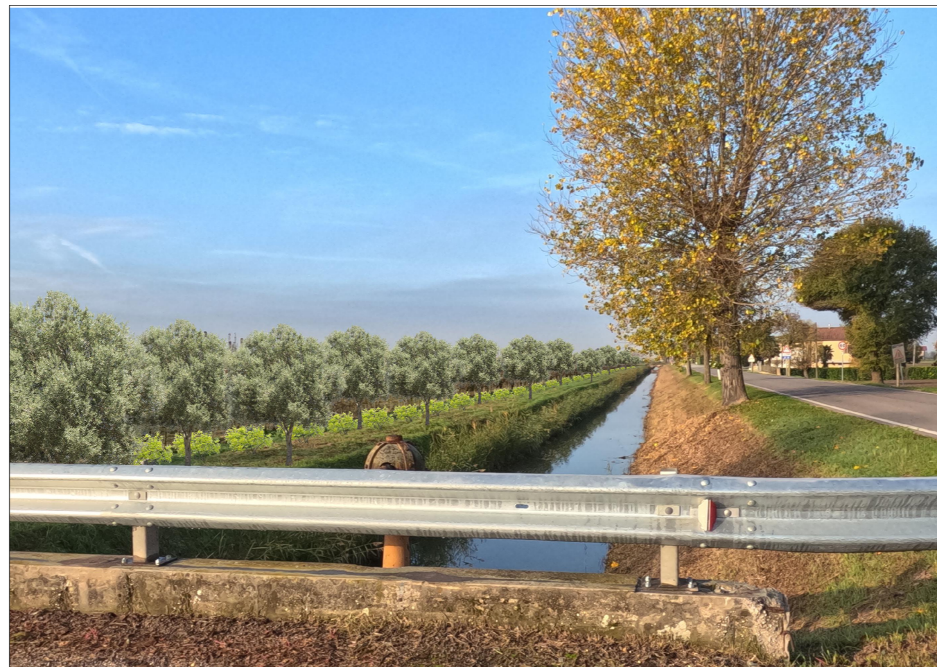
PUNTO DI VISTA 1 PROGETTO MITIGATO