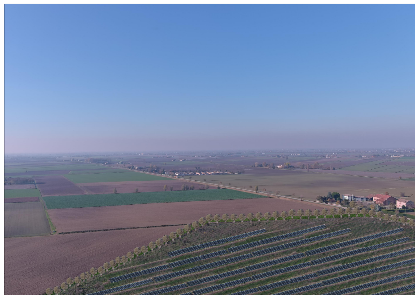
PUNTO DI VISTA AEREO - STATO DI PROGETTO