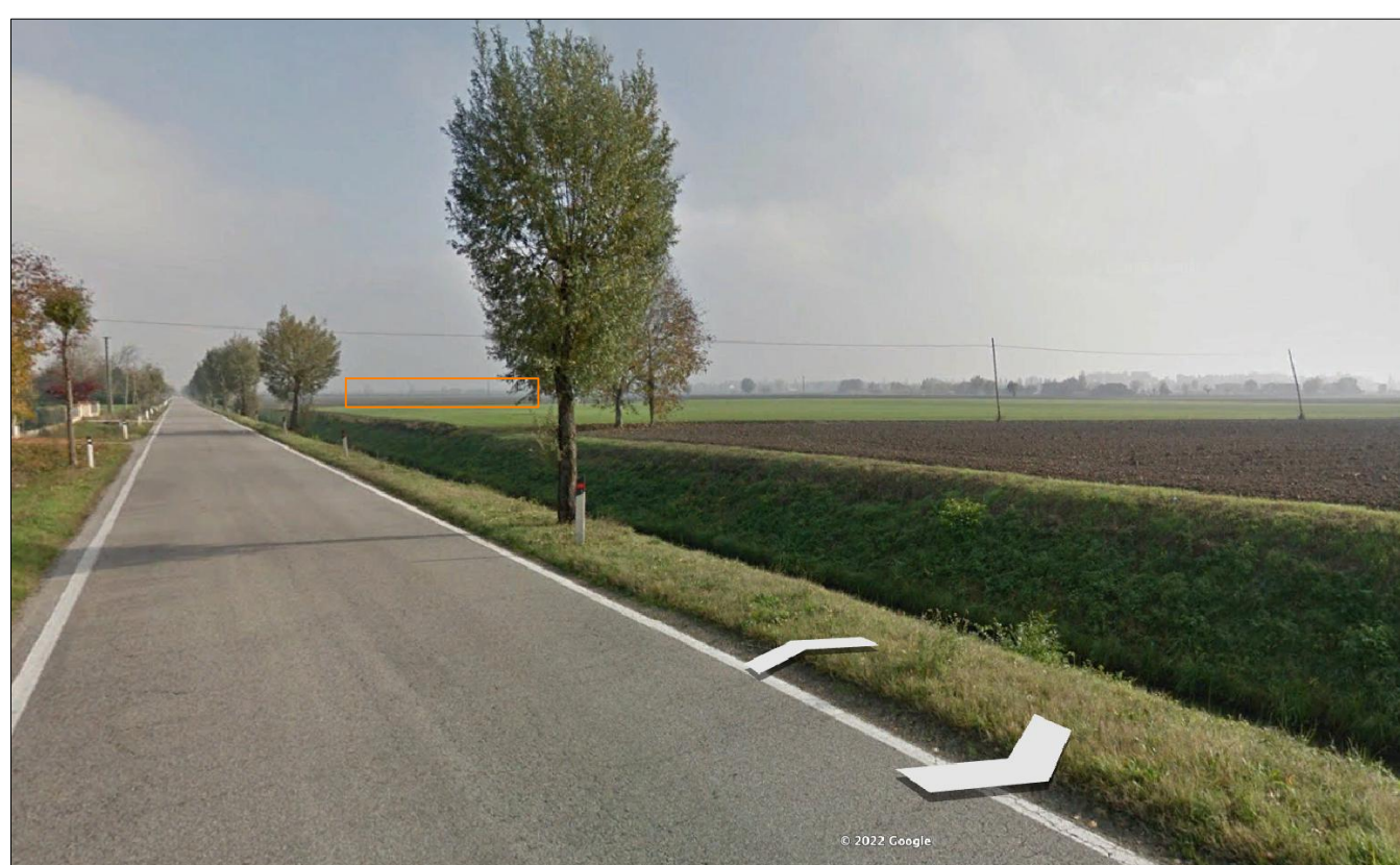
PUNTO DI VISTA 1