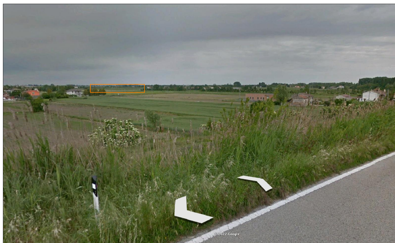
PUNTO DI VISTA 1