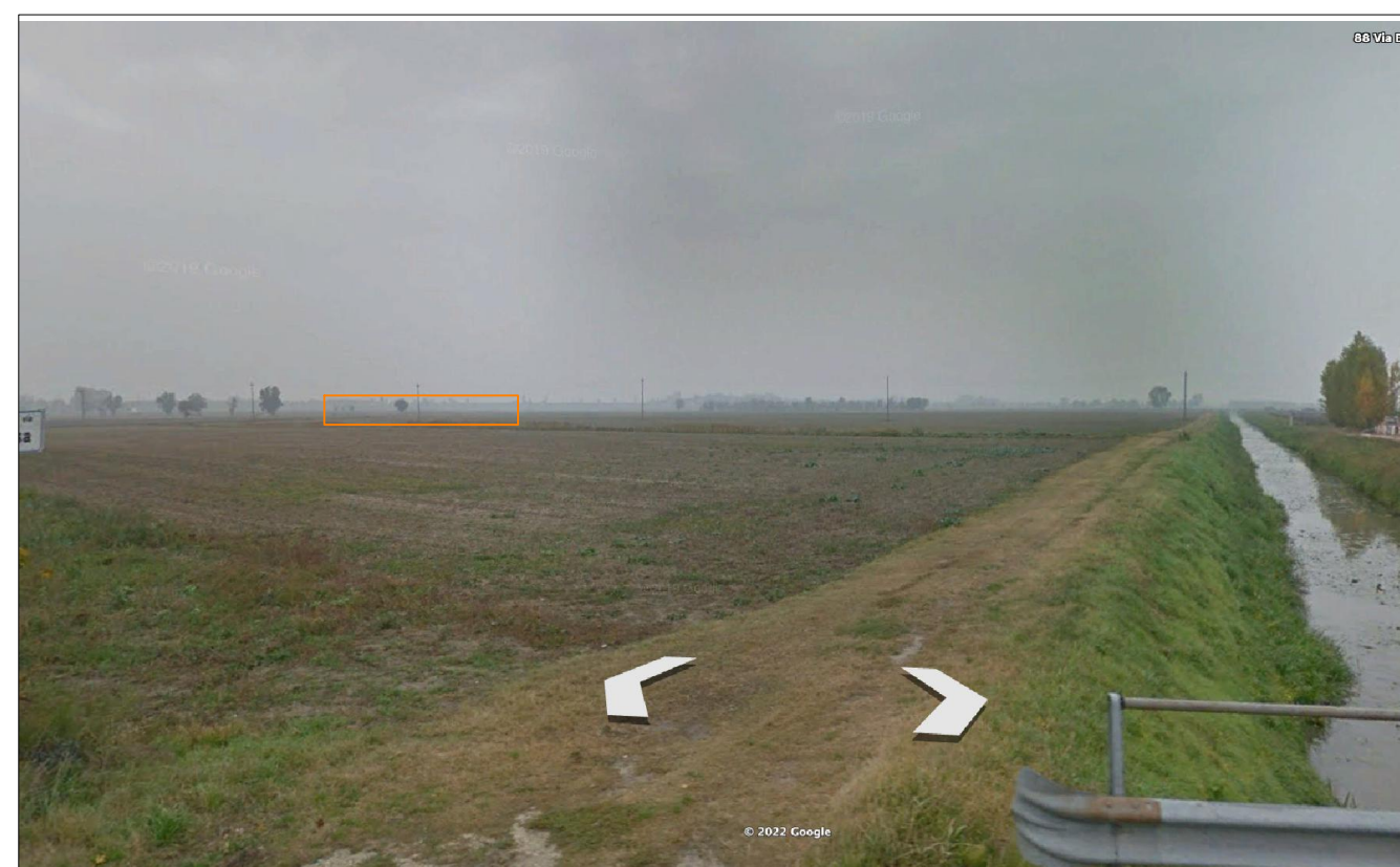
PUNTO DI VISTA 1