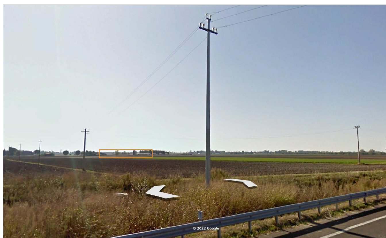
PUNTO DI VISTA 1