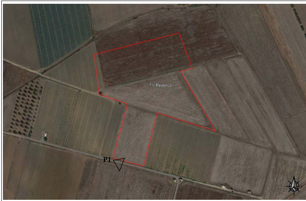
VISTA SATELLITARE ANTE OPERAM - Punto di presa fotografica P.1