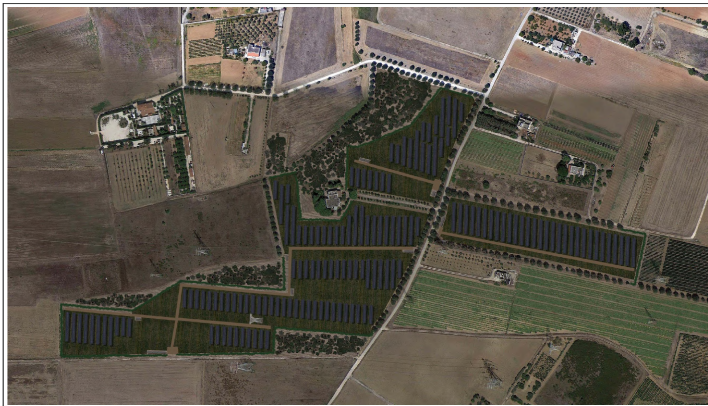
VISTA SATELLITARE POST OPERAM