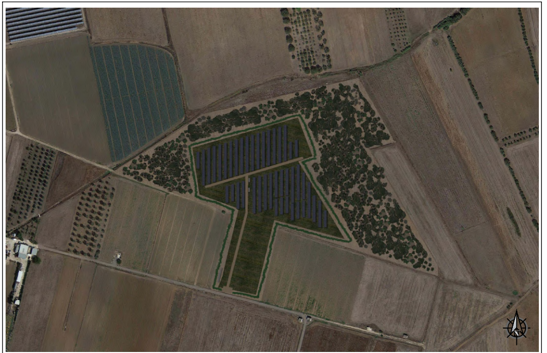
VISTA SATELLITARE POST OPERAM