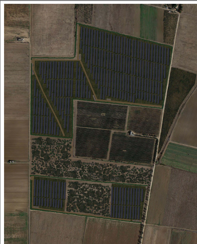
VISTA SATELLITARE POST OPERAM