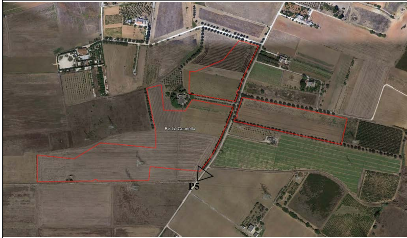
VISTA SATELLITARE ANTE OPERAM Punto di presa fotografica P5