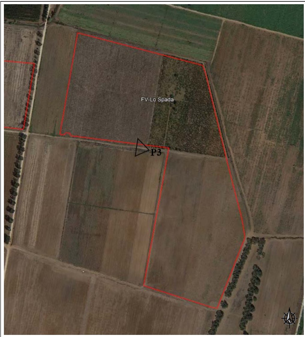
VISTA SATELLITARE ANTE OPERAM - Punto di presa fotografica P.3