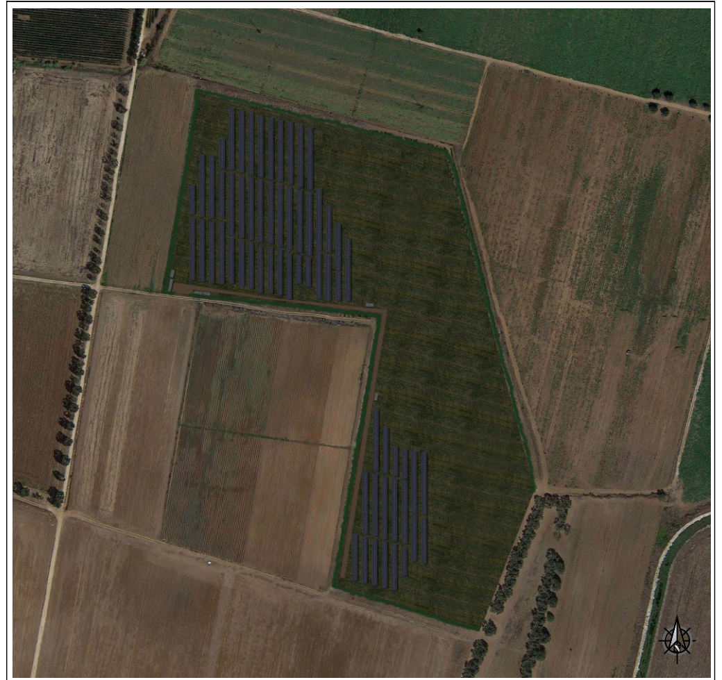
VISTA SATELLITARE POST OPERAM