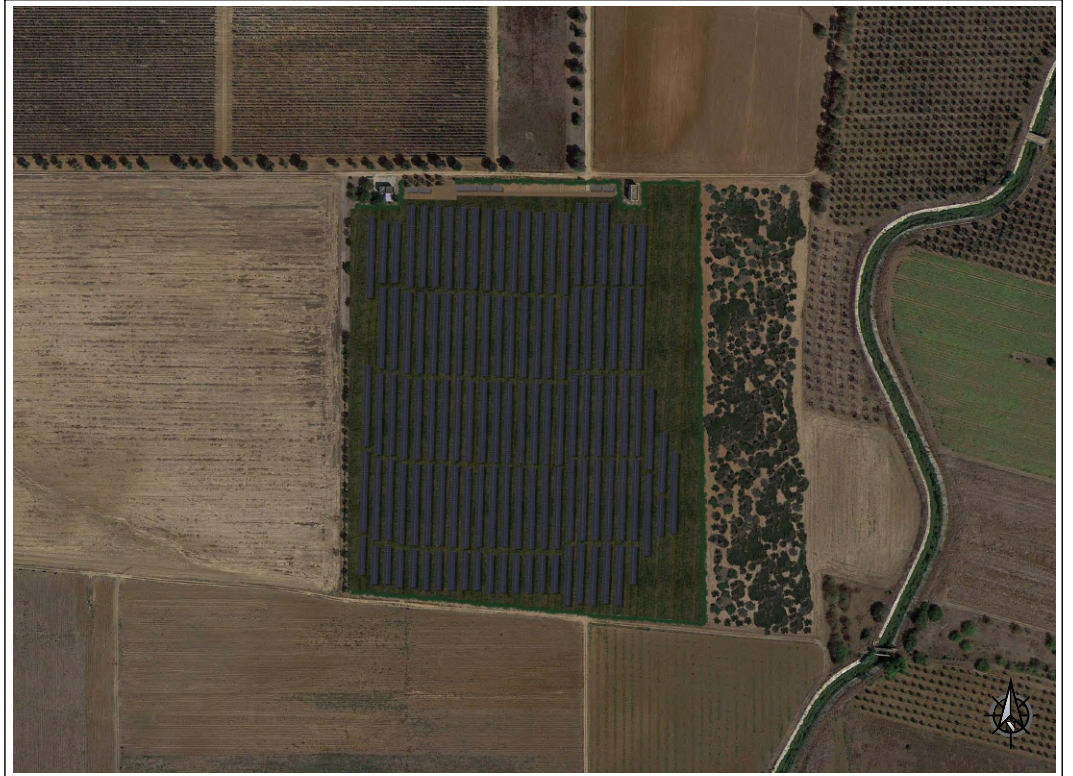
VISTA SATELLITARE POST OPERAM