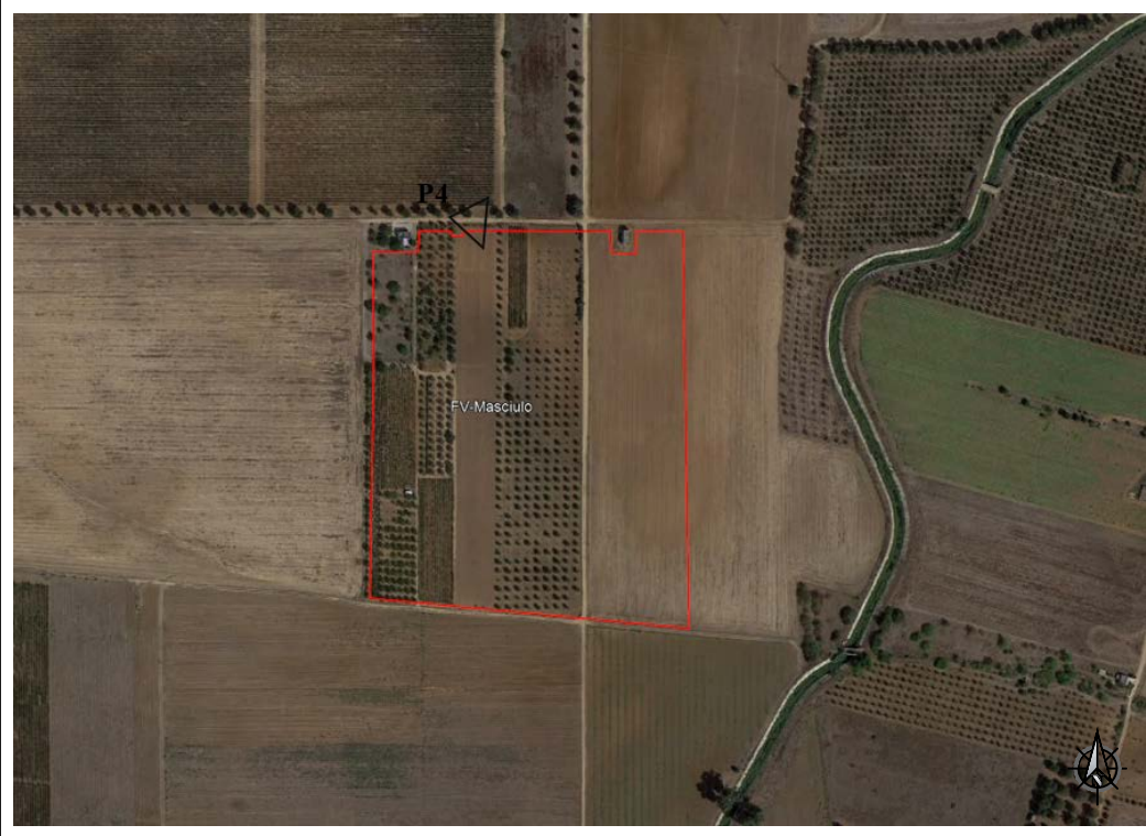
VISTA SATELLITARE ANTE OPERAM - Punto di presa fotografica P.4