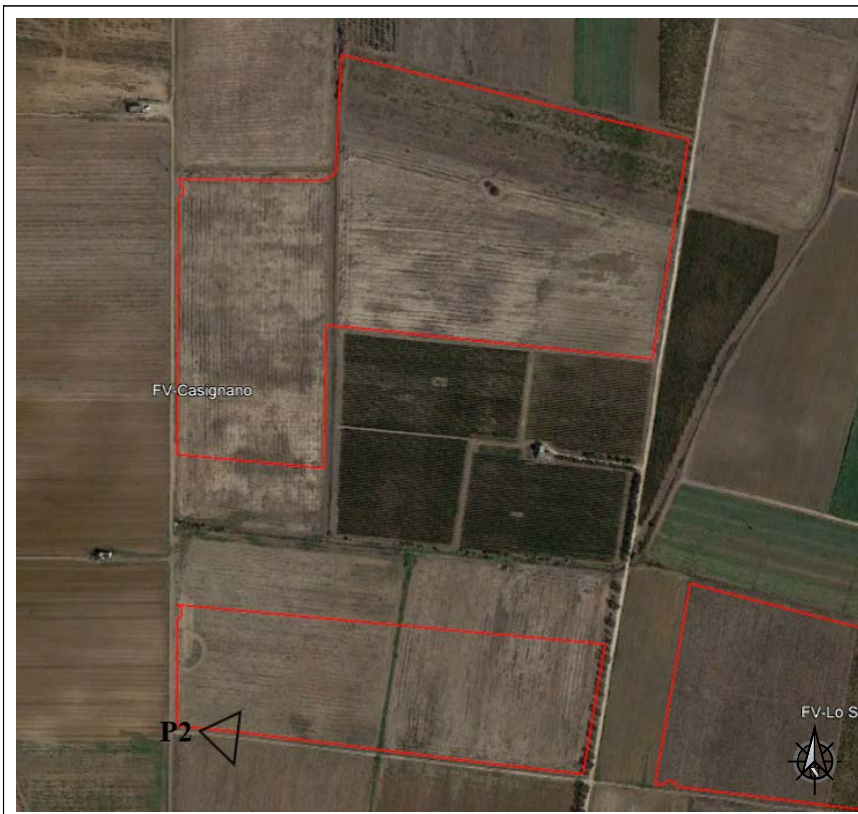
VISTA SATELLITARE ANTE OPERAM Punto di presa fotografica P2