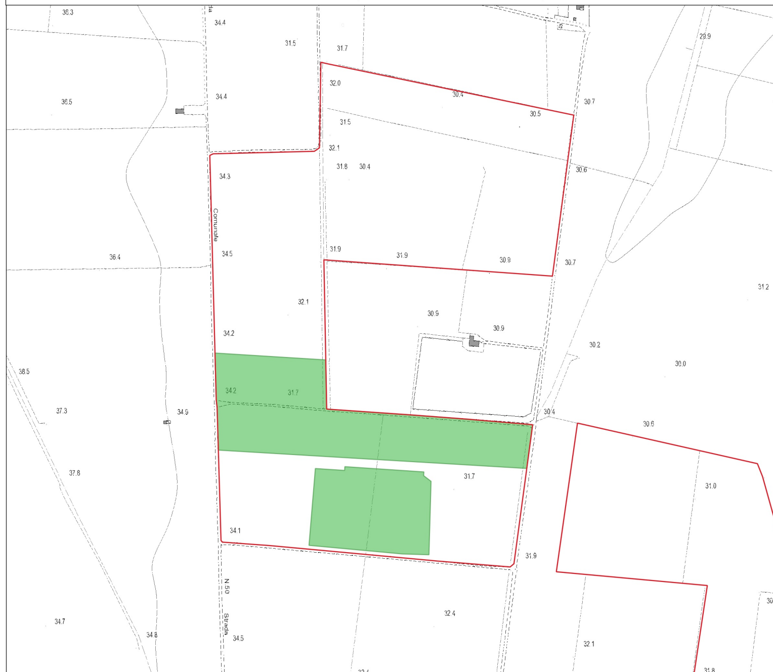
DETTAGLIO 2 - Aree destinate alle opere di imboscamento inquadramento su CTR