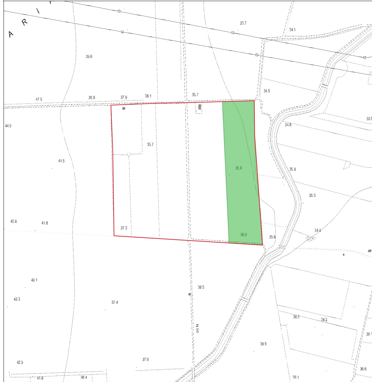
DETTAGLIO 3 - Aree destinate alle opere di imboscamento inquadramento su CTR