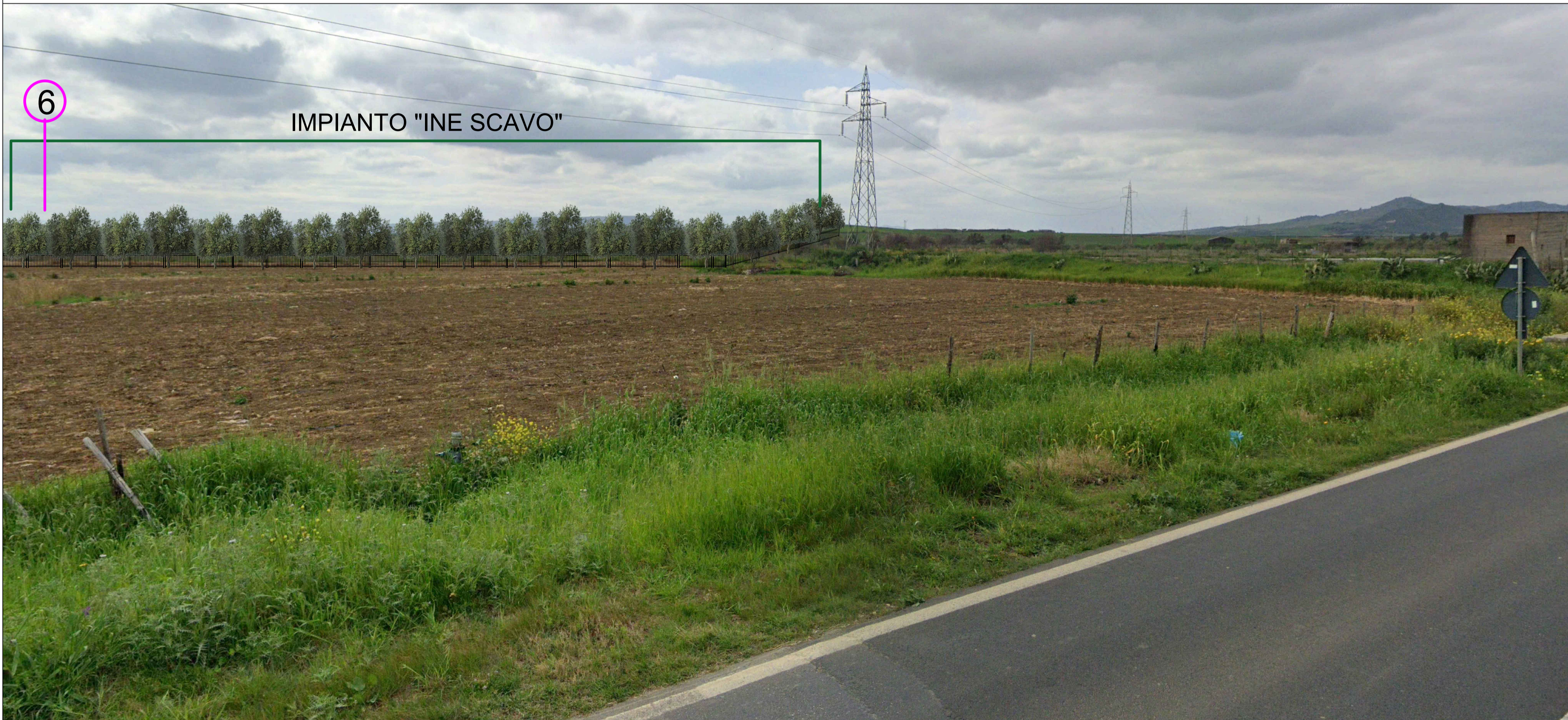
Fotoinserimento SS288 - POST OPERAM