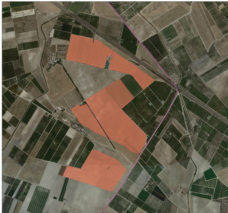
Inquadramento territoriale su Ortofoto