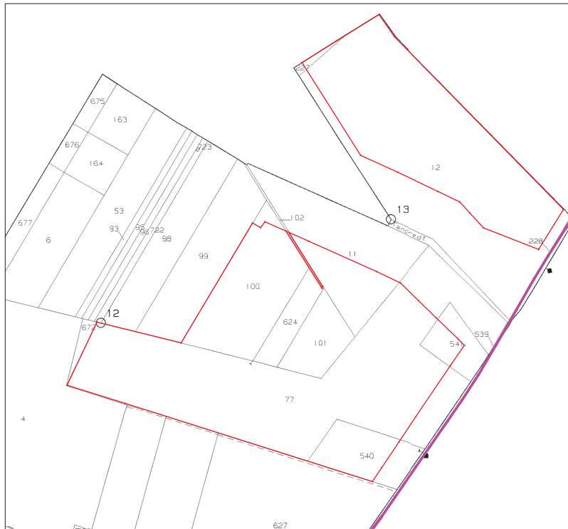
Inquadramento territoriale su Mappa Catastale - Foglio 35 del Comune di Orta Nova