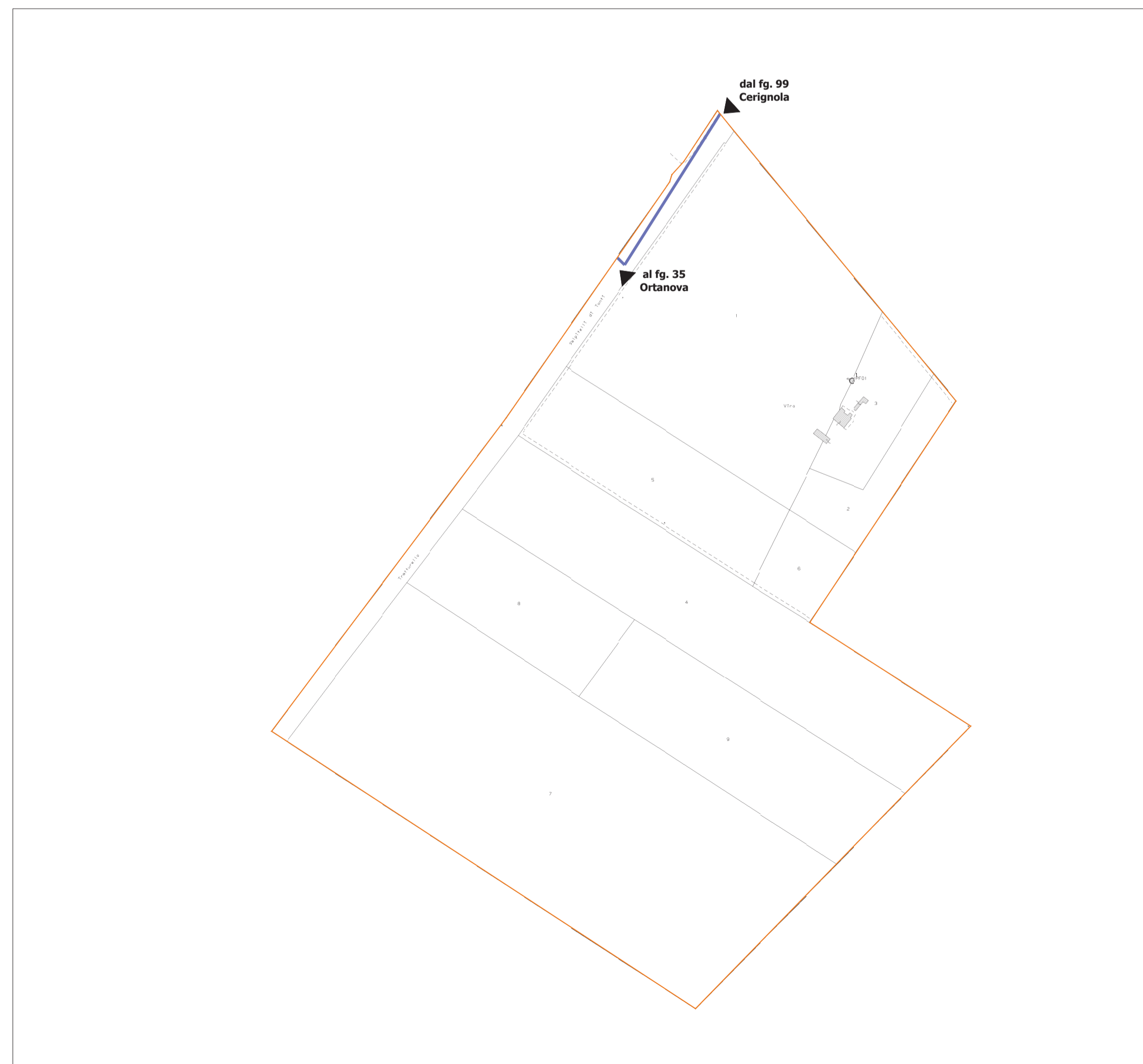
FOGLIO 100 CERIGNOLA