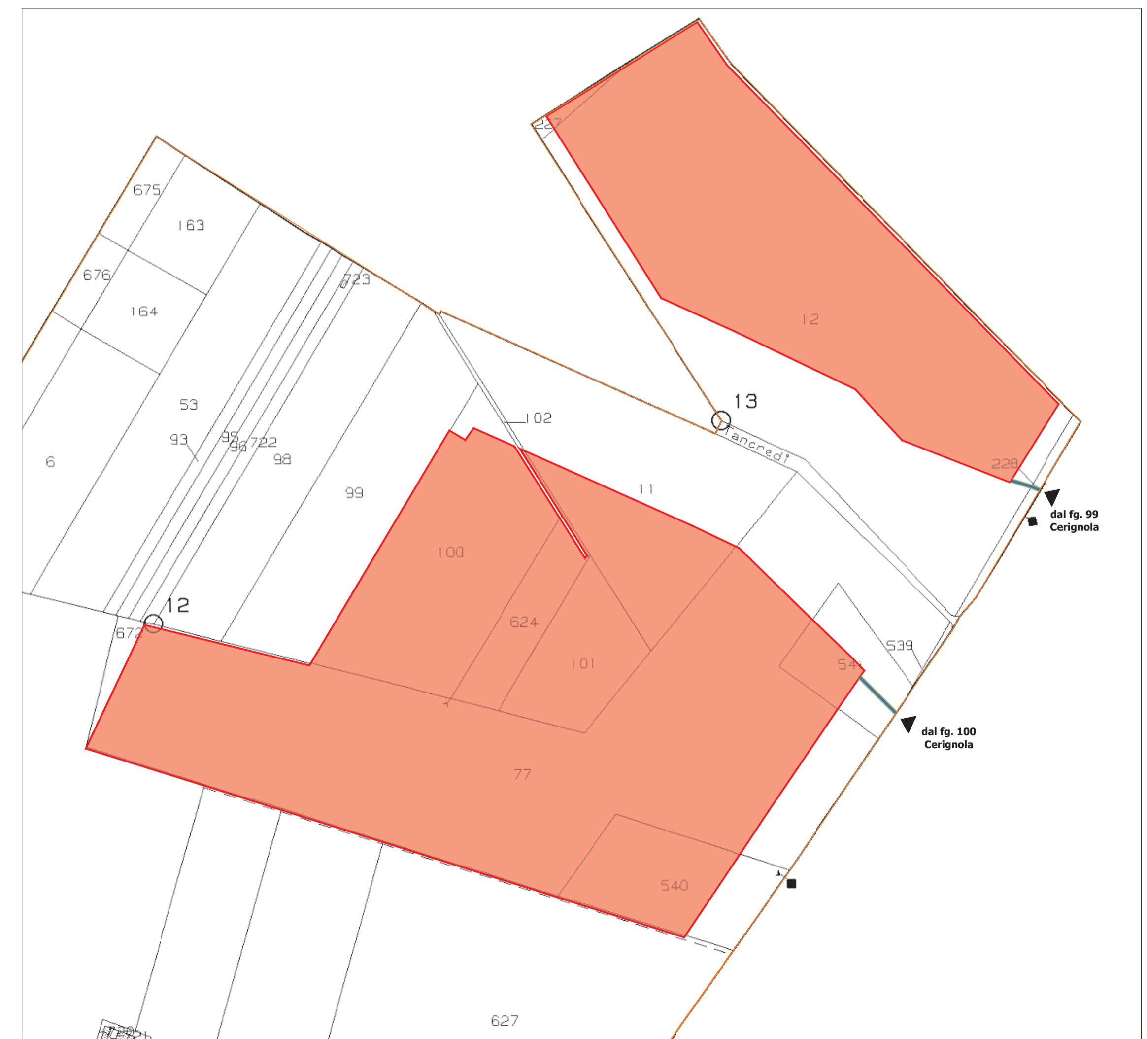
FOGLIO 35 ORTA NOVA