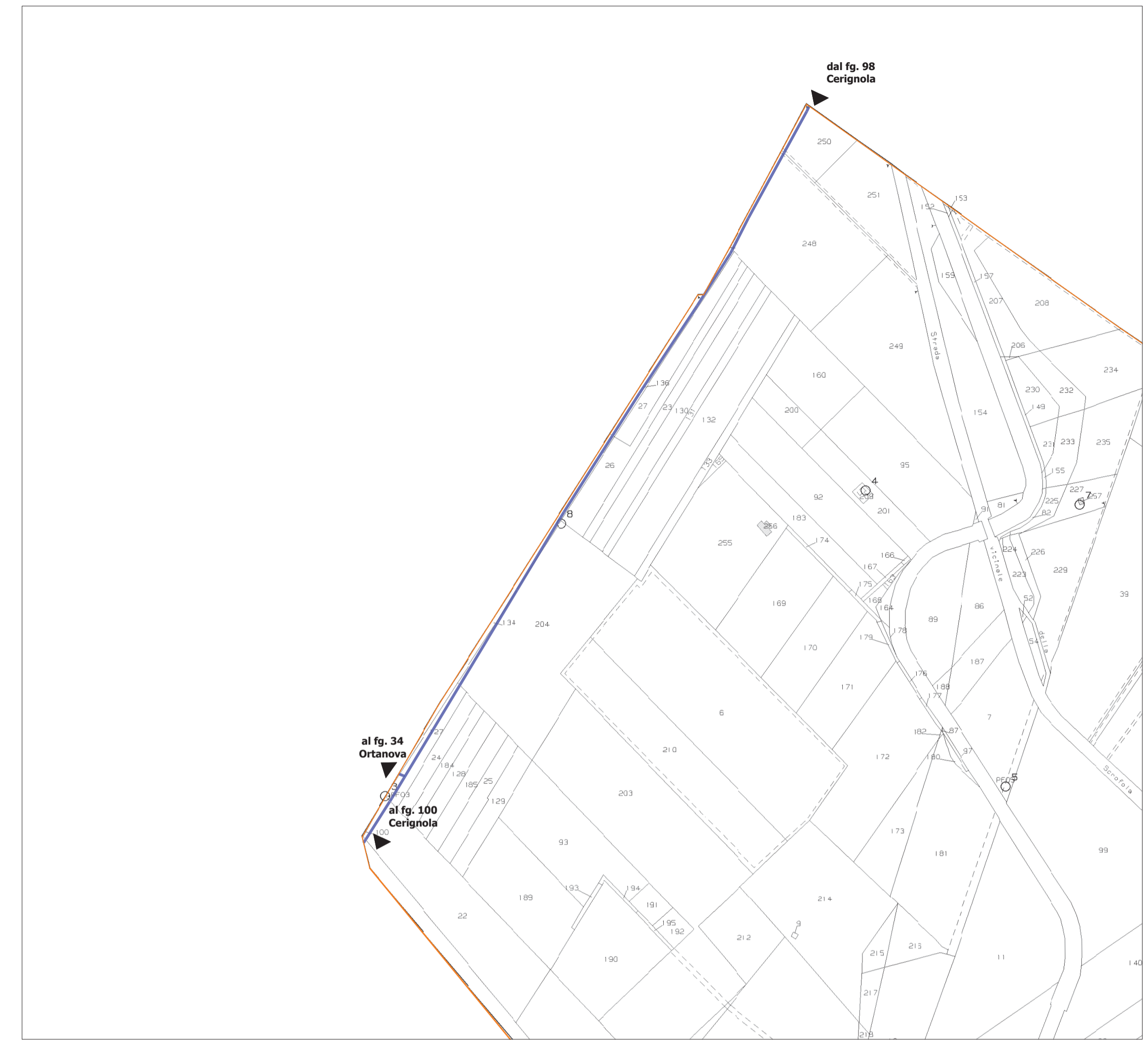
FOGLIO 99 CERIGNOLA