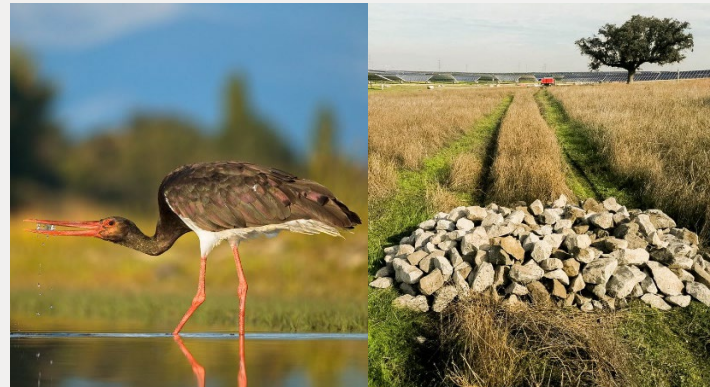
Sviluppato e costruito da Statkraft, 2021 300 MWp

Misure Principali: 5,000 ghiande piantate ogni anno per far crescere tra i 20 e i 30.000 lecci | 25 rifugi per rettili | Ripristino di 2 stagni e creazione di 2 nuovi | Monitoraggio delle Gru | Programma di ripopolamento delle lepri selvatiche .