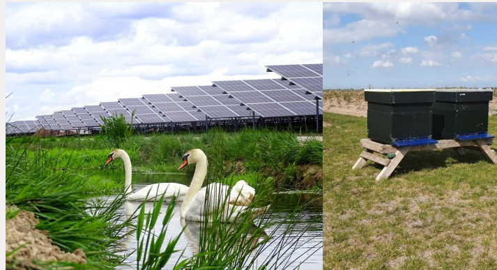
Sviluppato e costruito da Statkraft, 2020 110 MWp

Abbiamo anche promosso la produzione di miele locale dalla presenza di api.