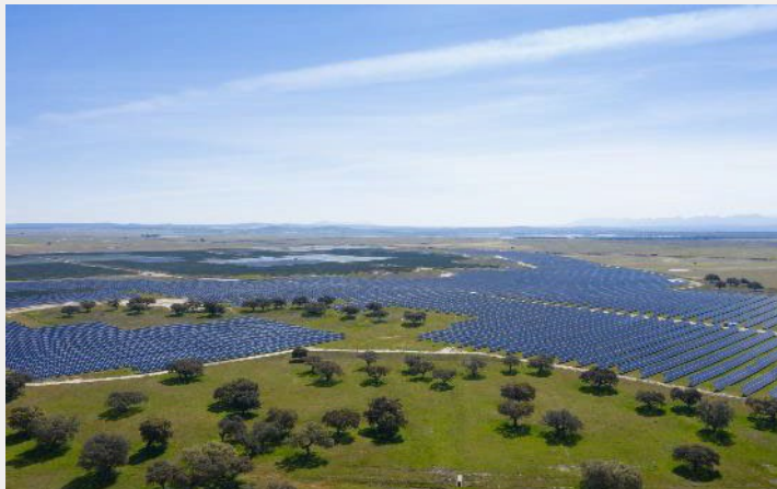
Talayuela, Spagna: Investimenti per 1 milione di euro nella biodiversità, 1,2 milioni di euro nell'economia locale, creazione di 400 posti di lavoro

Creiamo valore, mostrando rispetto e attenzione per i dipendenti, i clienti, l'ambiente e la società.