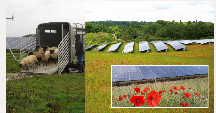
Costruito da Statkraft, 2014 / 2016 2.4 MWp / 5 MW

Abbiamo anche rigenerato più di 600 ettari di terreni relativamente ai progetti sviluppati nel solo Regno Unito combinando prati e fiori di campo permettendo il pascolo a numerosi allevamenti di ovini .