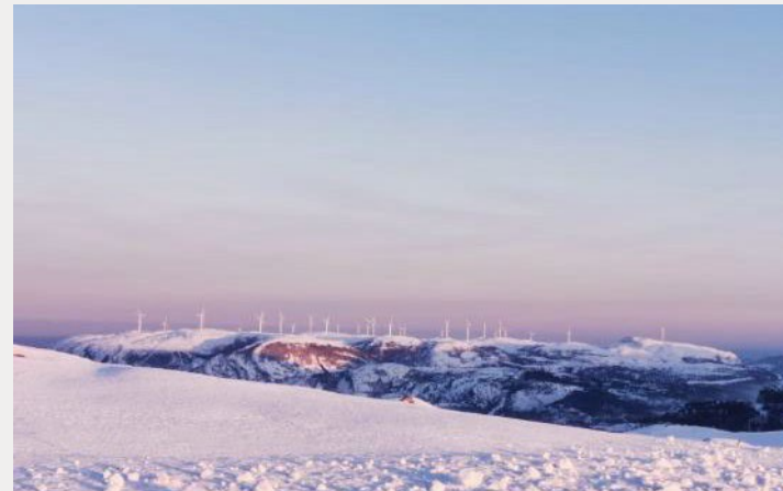
Fosen, Norvegia: Il più grande progetto europeo nel suo genere, con 277 singole turbine eoliche

Pensiamo in modo creativo, riconoscendo le opportunità e sviluppando soluzioni efficaci.