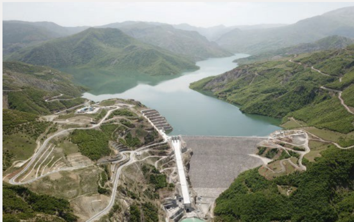
Moglicë, Albania: Una delle dighe nel suo genere più alte al mondo, produce 450 GWh all'anno

Utilizziamo conoscenze ed esperienza per raggiungere obiettivi ambiziosi ed essere riconosciuti come leader del settore.