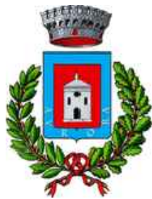
Comune di Ururi