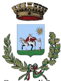
Comune di San Martino in Pensilis