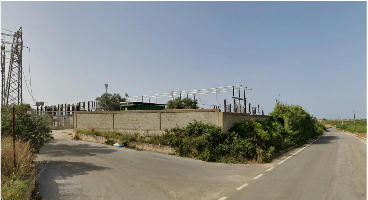
Vista 3 su CP Mazara 2