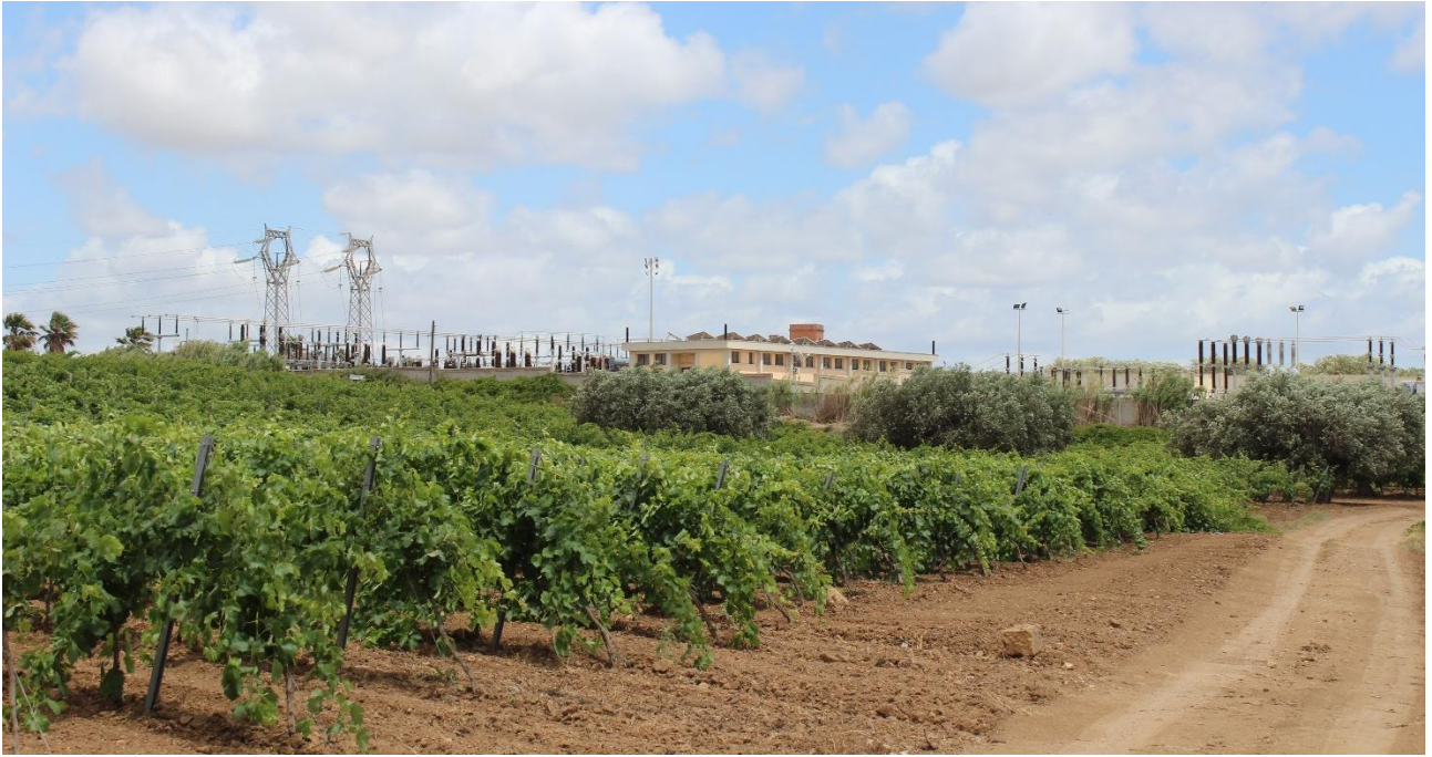
Vista 4 su Strada Vicinale S. Michele da Ovest