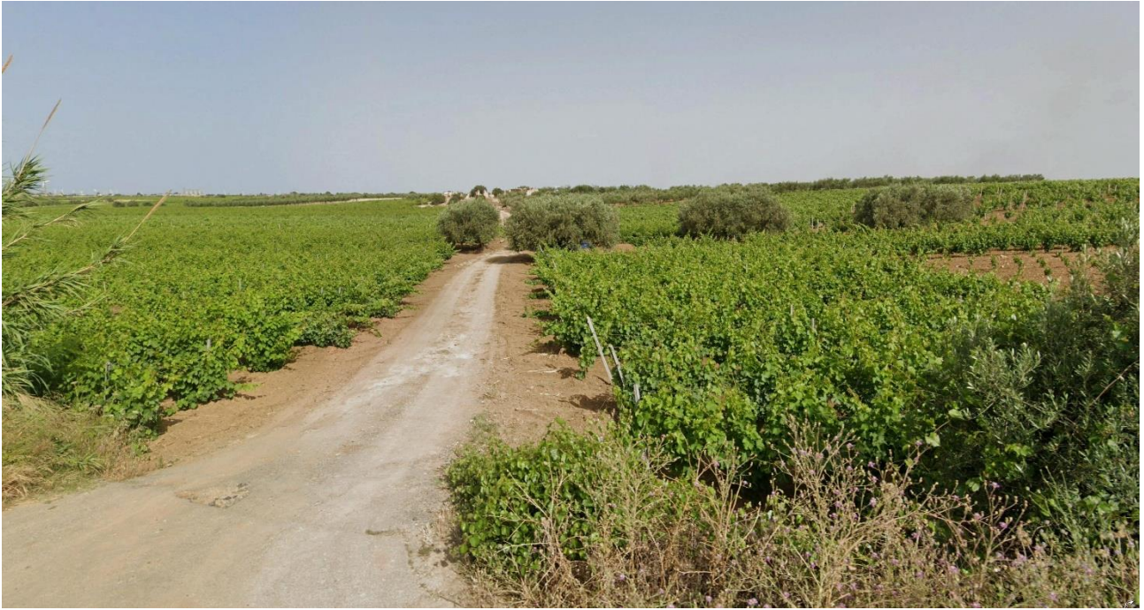
Vista 2 su Strada Vicinale S. Michele da Est