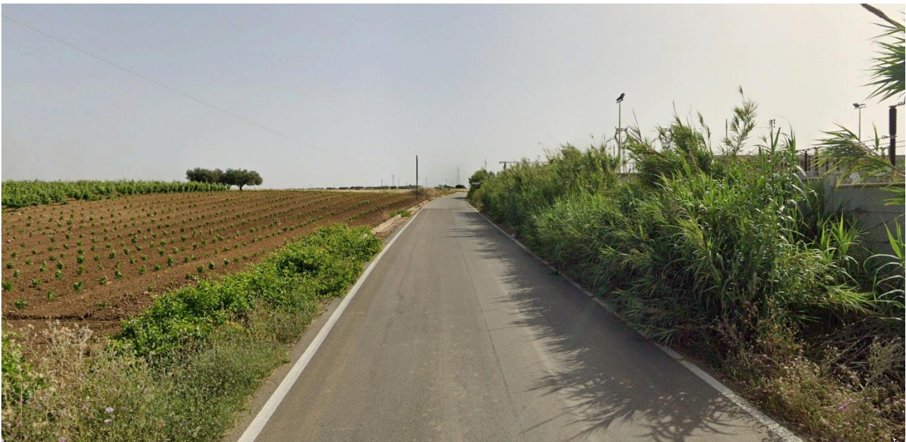
Vista 1 su SR 18 (EX Regia Trazzera)