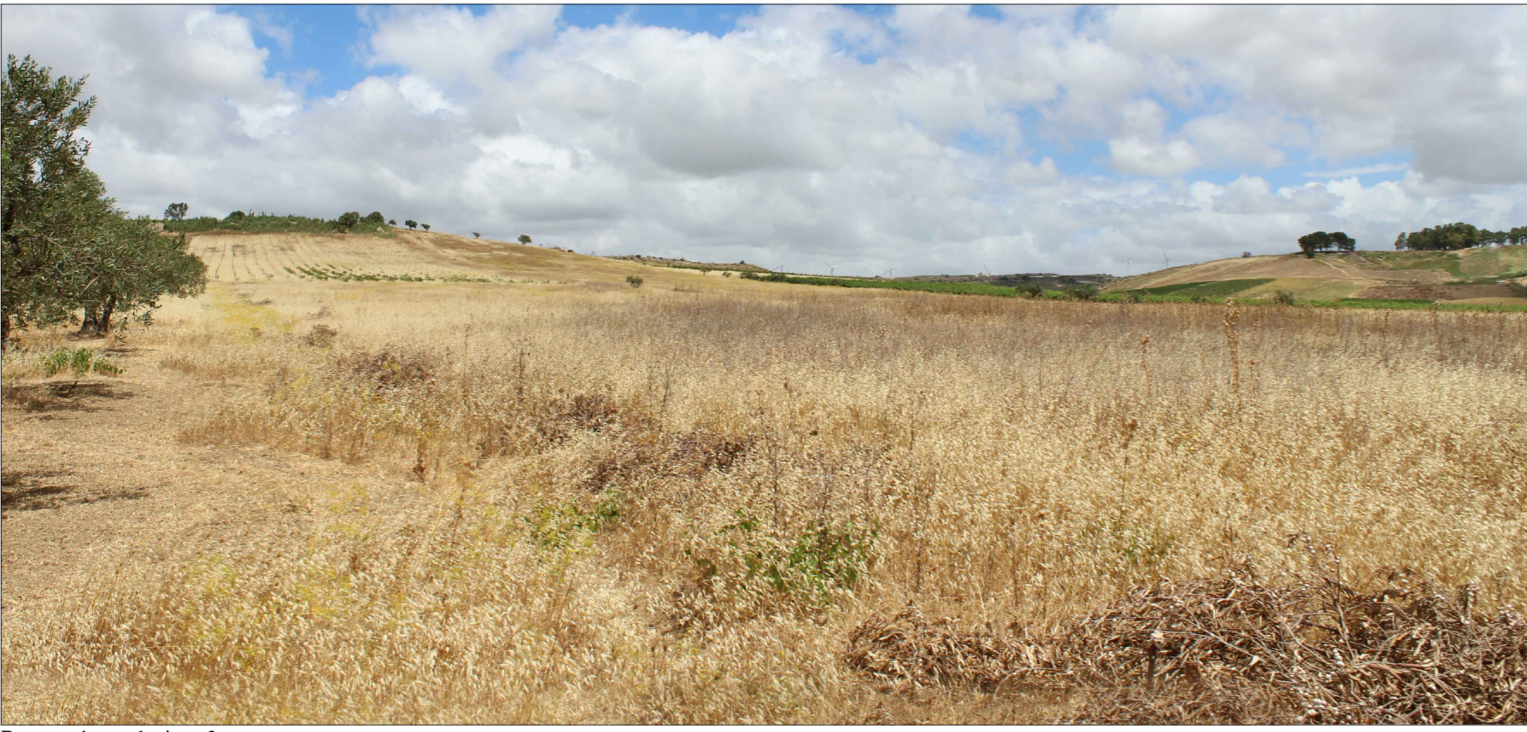
Panoramica n. 6 - Area 2