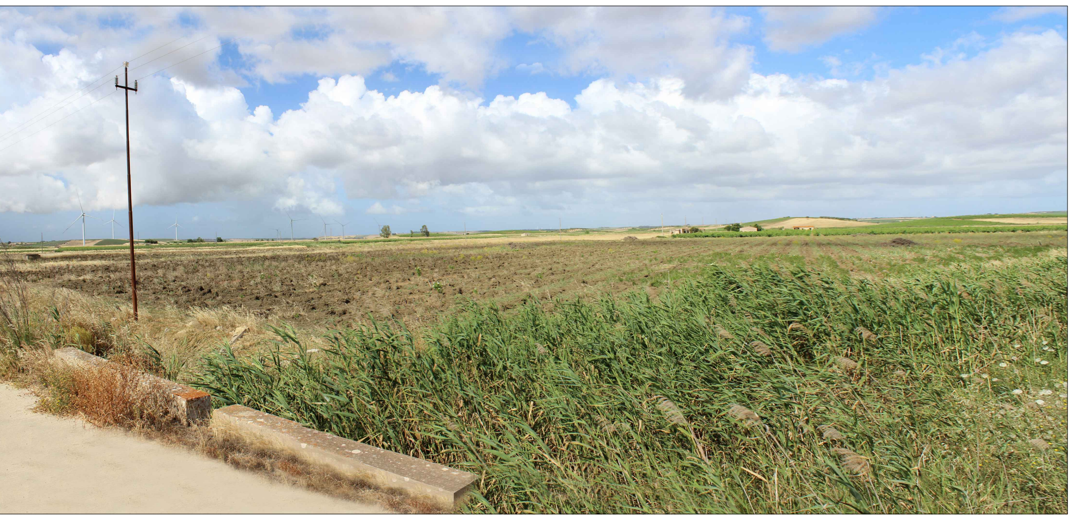
Panoramica n. 3 - Area 1