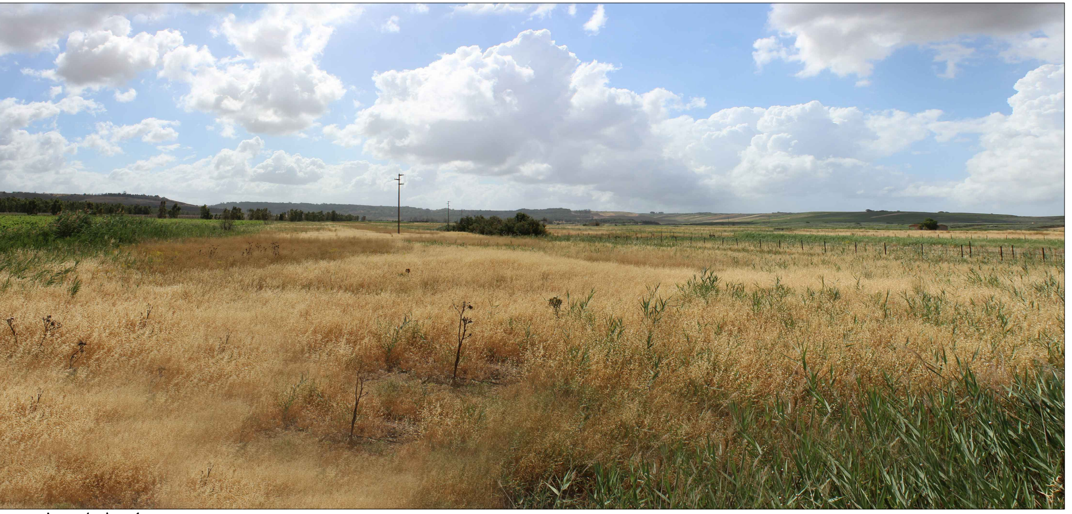
Panoramica n. 4 - Area 1