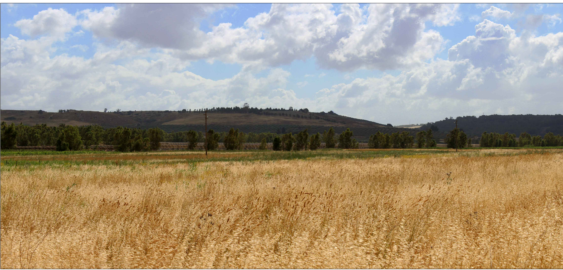
Panoramica n. 5 - Area 1