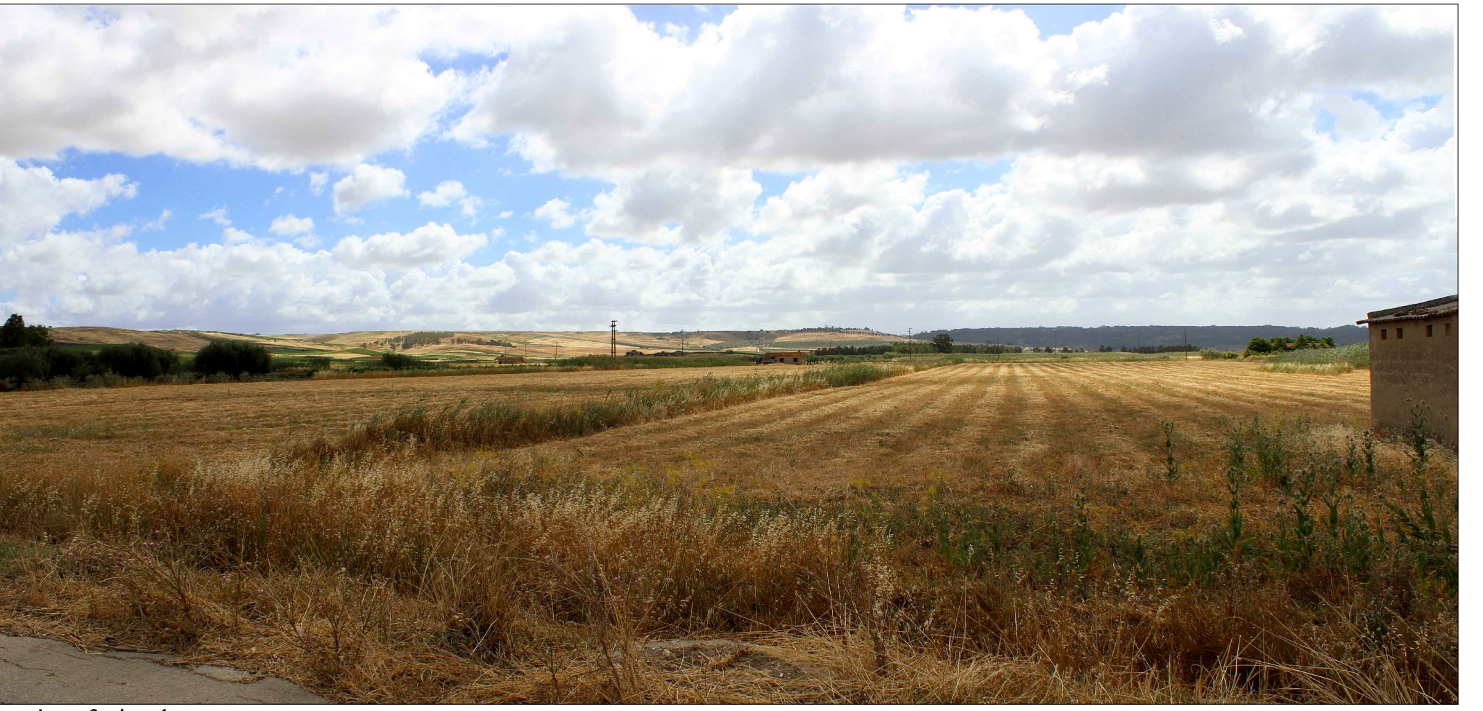
Panoramica n. 2 - Area 1