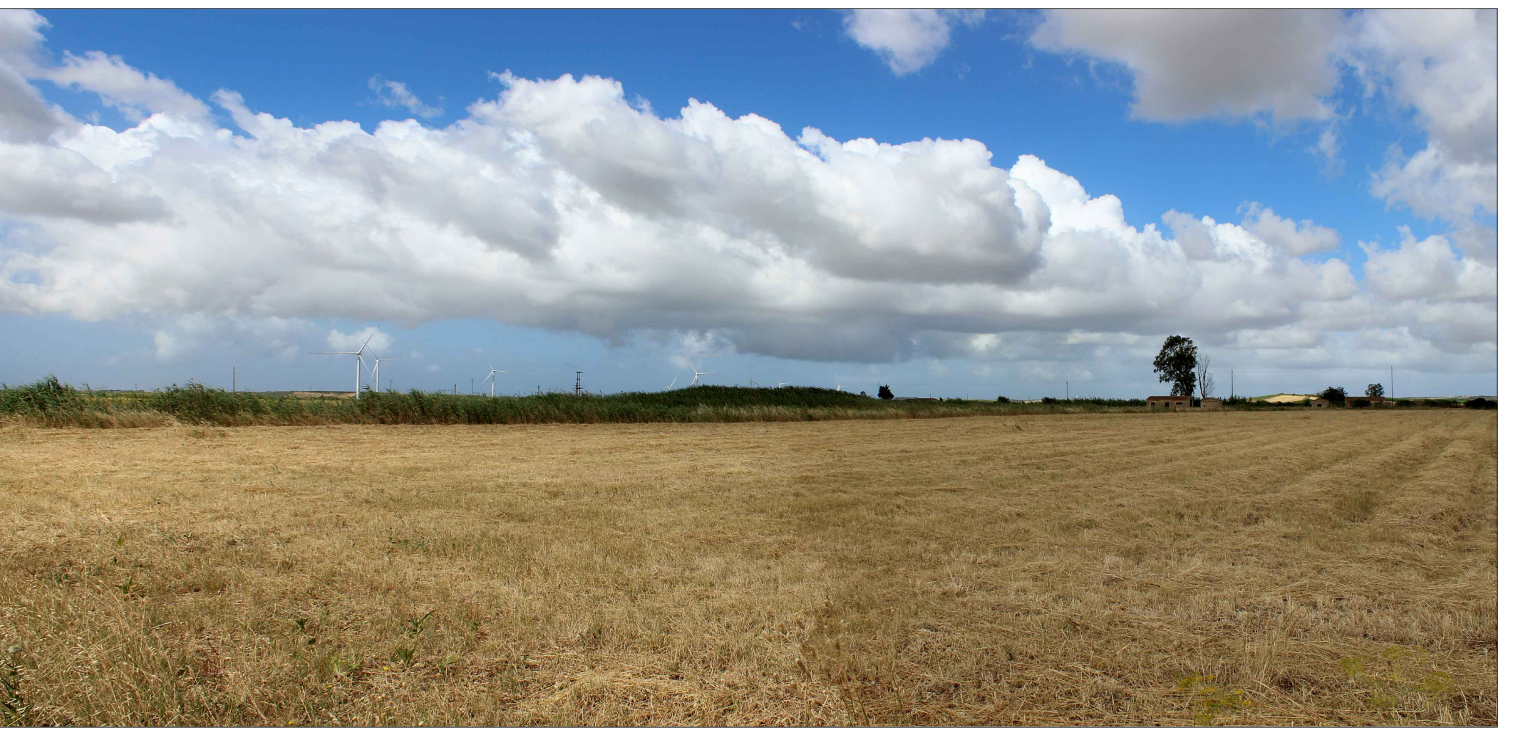
Panoramica n. 1 - Area 1