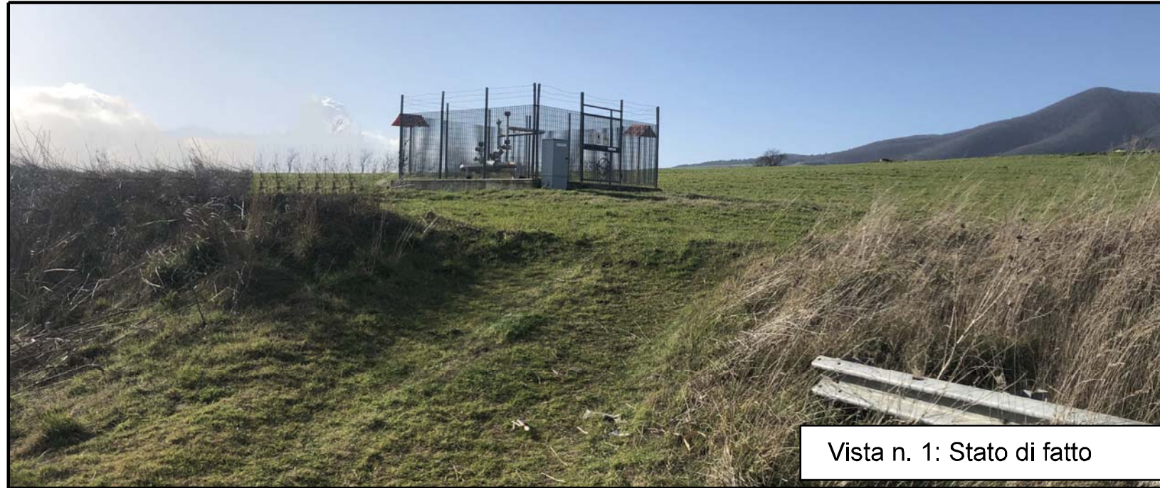
Vista n. 1: Stato di fatto