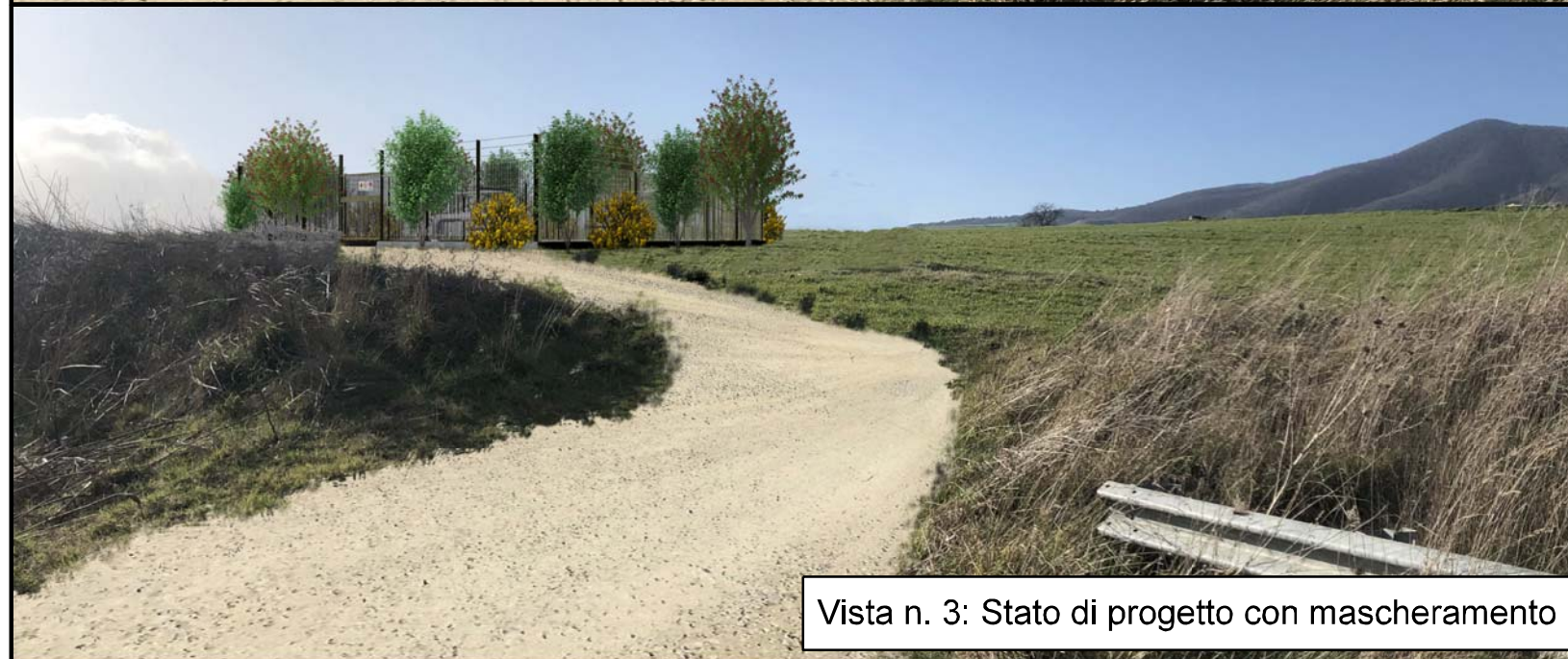
Vista n. 3: Stato di progetto con mascheramento