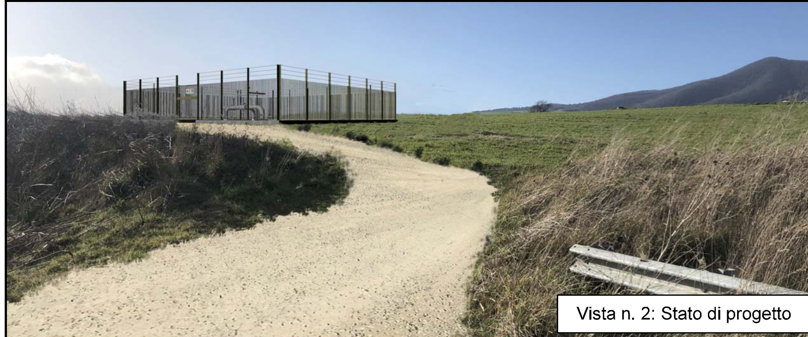
Vista n. 2: Stato di progetto