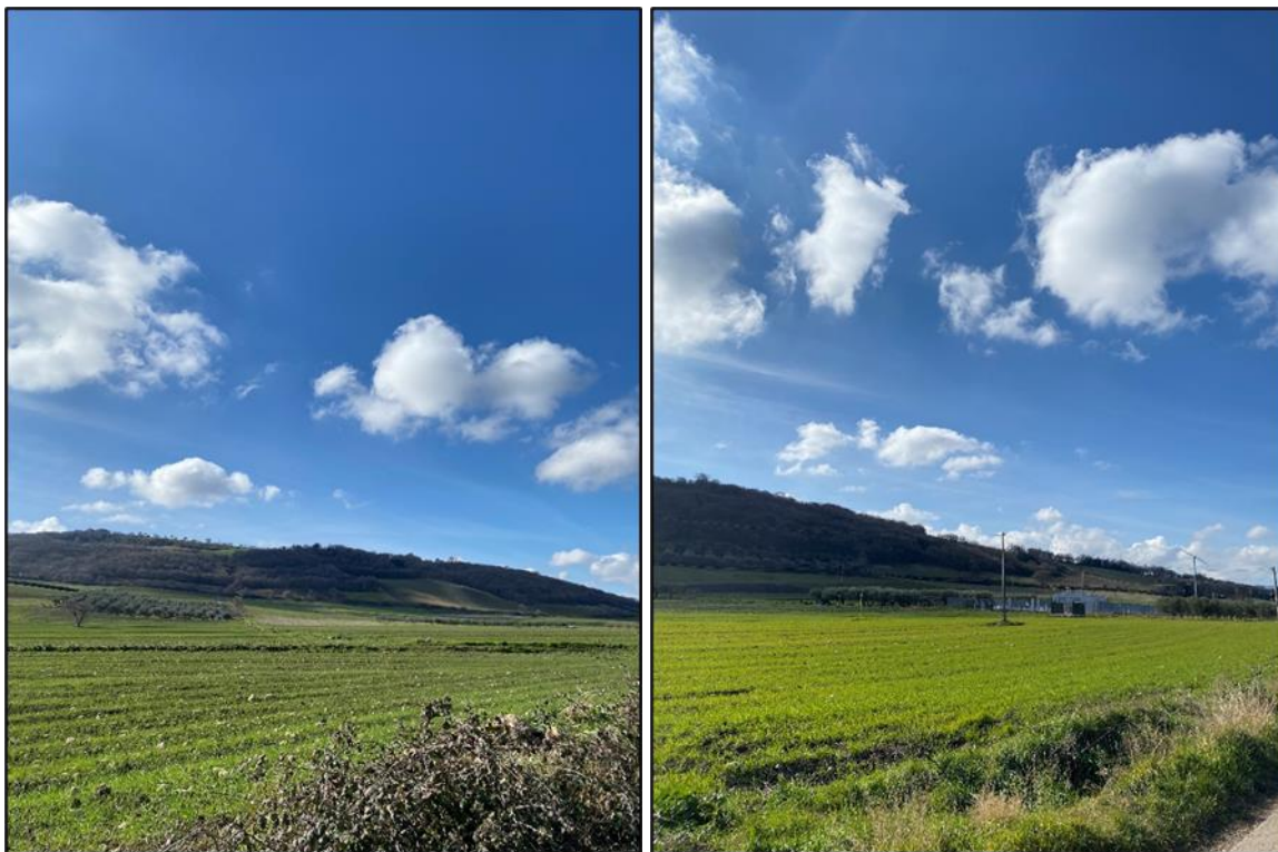
Foto 13 – 14: Seminativi in prossimità degli aerogeneratori WTG 8 e WTG 9