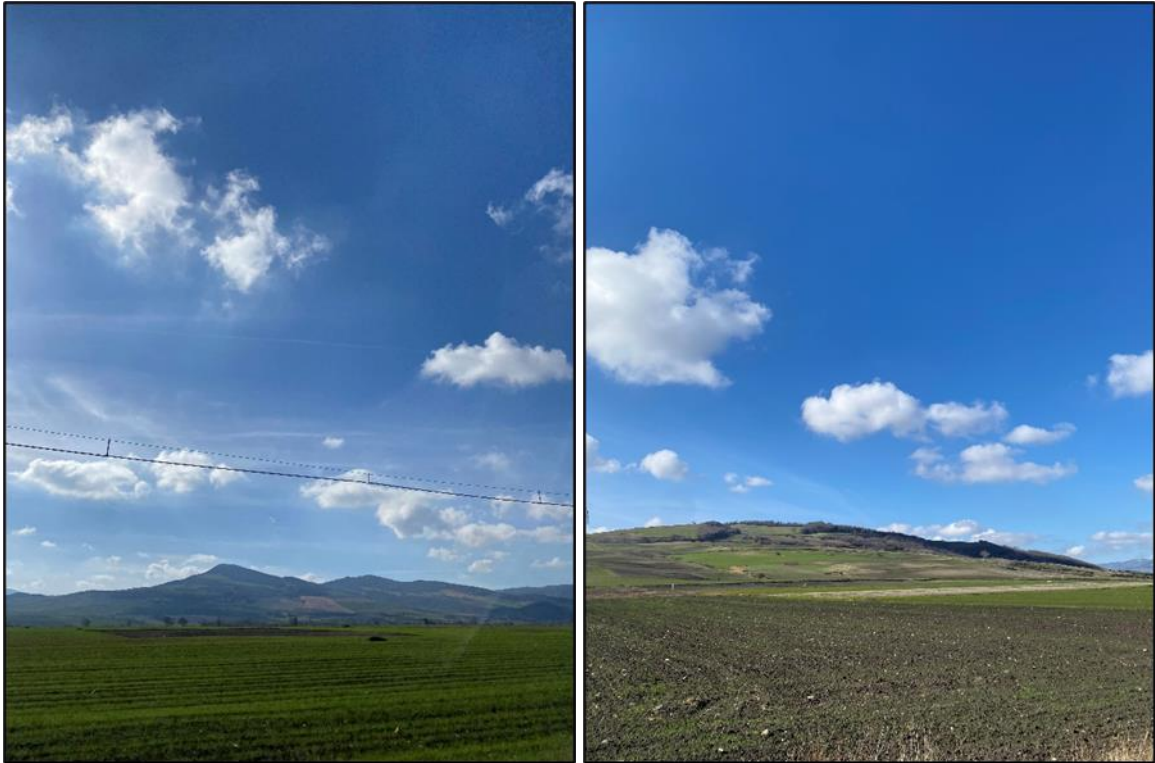
Foto 5 – 6: Seminativi in prossimità degli aerogeneratori WTG 3 e WTG 4