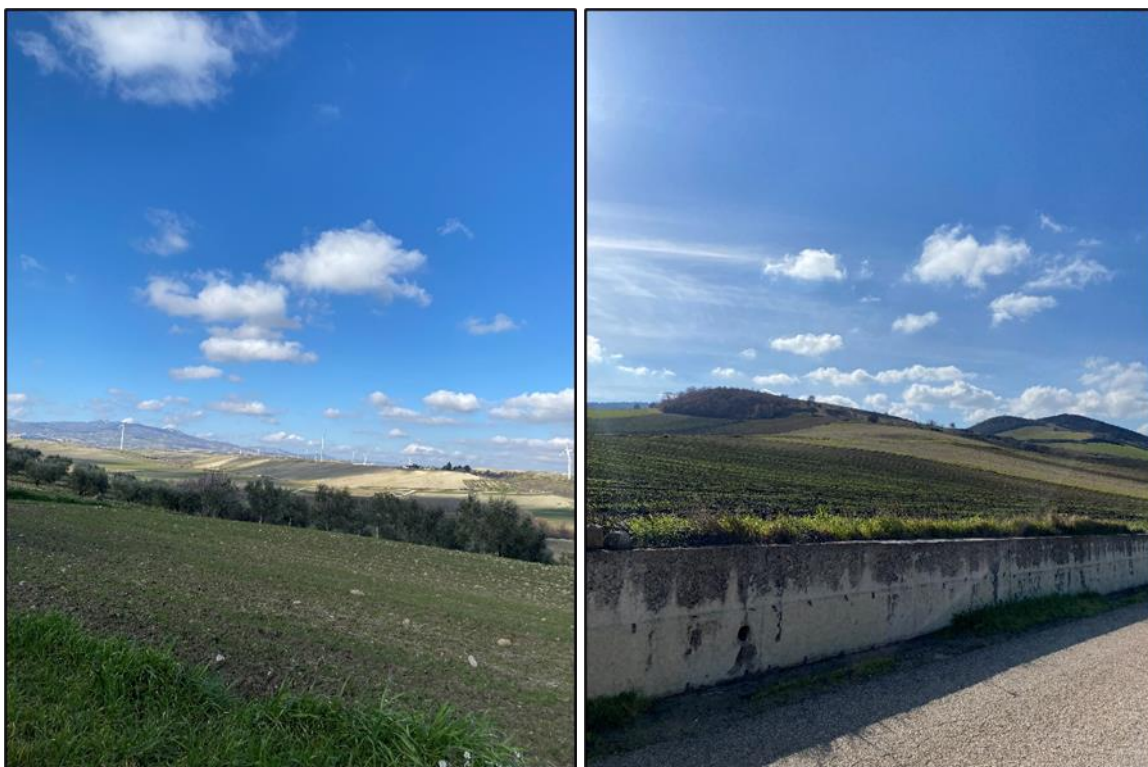
Foto 15 – 16: A sinistra uliveti prossimi ai seminativi dove sorgerà l'aerogeneratore WTG 10; a destra seminativi in prossimità della pala WTG 11