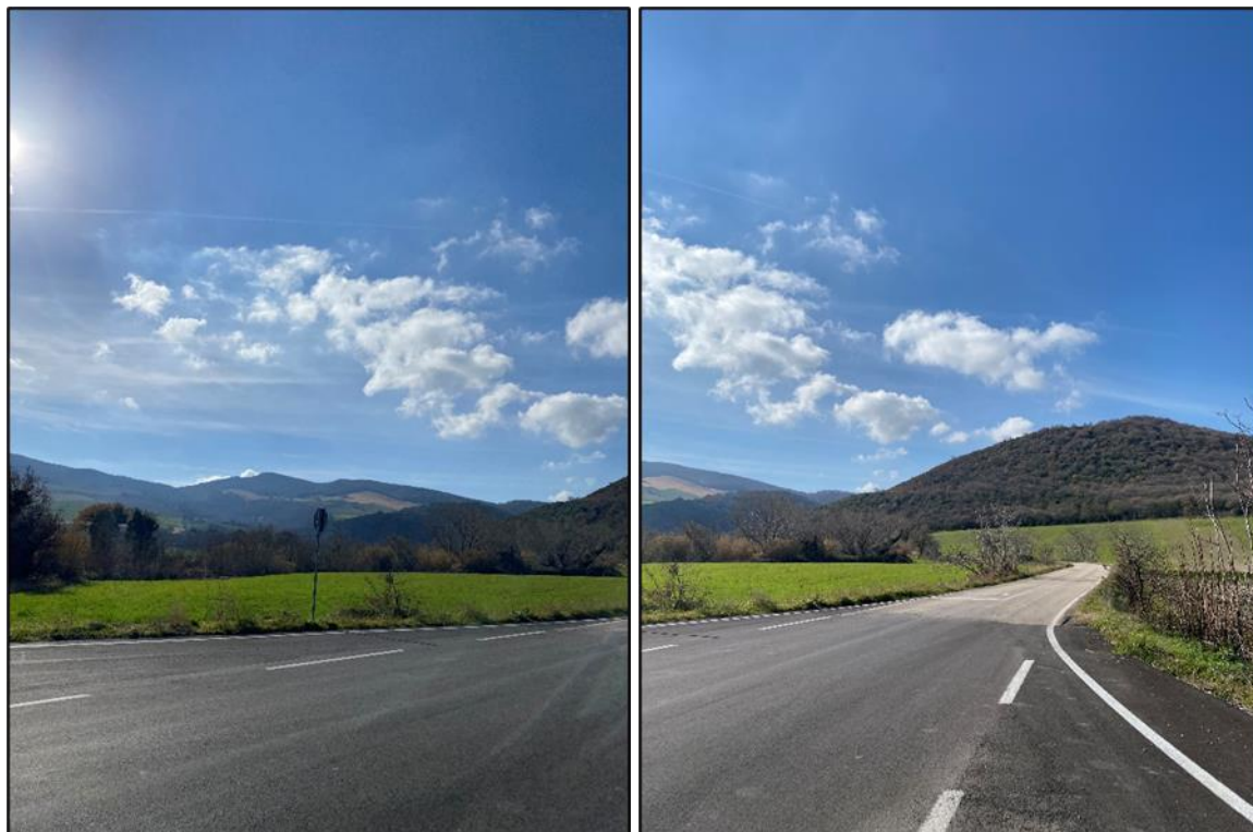
Foto 23 – 24 – 25: Aree boscate in prossimità (a circa 130 m) dell'area di progetto