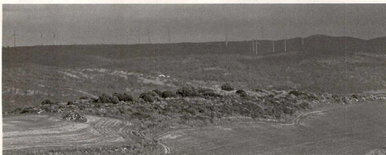
FOTO N°3: IL COMPLESSO NURAGICO DI SITZIDDIRI. COM'ERA POSSIBILE NON VEDERLO?