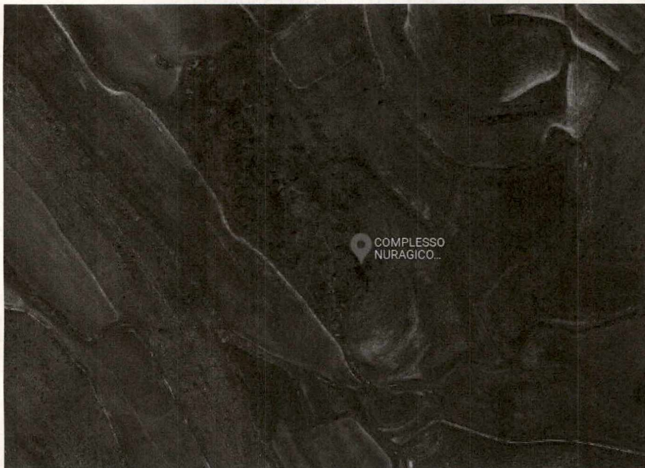
FOTO N°2: L'ESTESO COMPLESSO NURAGICO DI SITZIDDIRI CON VILLAGGIO ANNESSO