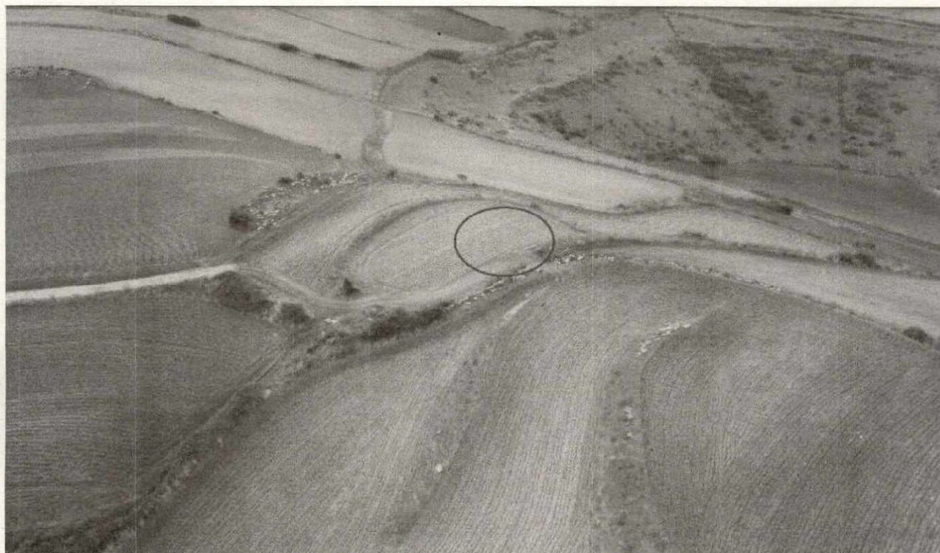
FOTO N°1 - FOTO DELLA LOCALITA' SITZIDDIRI PRESENTATA NEL PROGETTO. IL CERCHIO ROSSO INDICA IN MANIERA MOLTO APROSSIMATA IL PUNTO DOVE VERRA' INSTALLATO L'AEROGENERATORE N°4