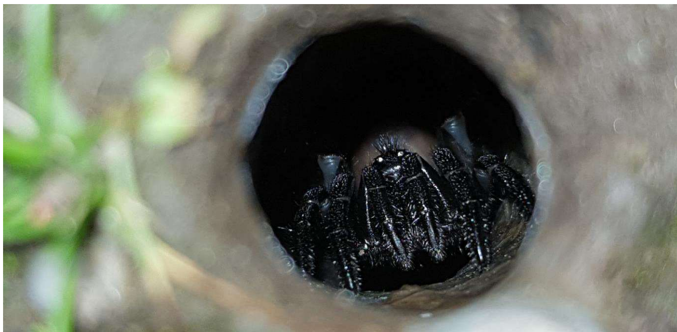
FOTO N°4: RARO ESEMPLARE DI RAGNO NURAGICO ( Amblyocareum Nuragicus )