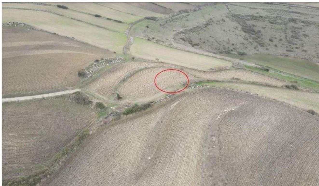
FOTO N°1 - FOTO DELLA LOCALITA' SITZIDDIRI PRESENTATA NEL PROGETTO. IL CERCHIO ROSSO INDICA IN MANIERA MOLTO APROSSIMATA IL PUNTO DOVE VERRA' INSTALLATO L'AEROGENERATORE N°4

Ministero dell'Ambiente e della Sicurezza Energetica Direzione Generale Valutazioni Ambientali Modulistica – 31/01/2023