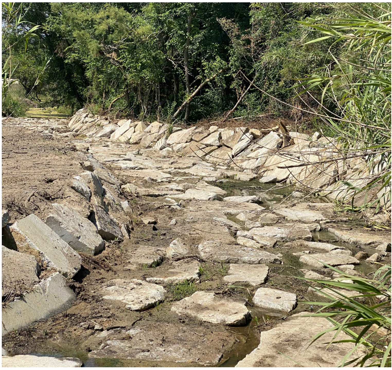
Esempio di risagomatura fondo alveo con scogliera in massi ciclopici