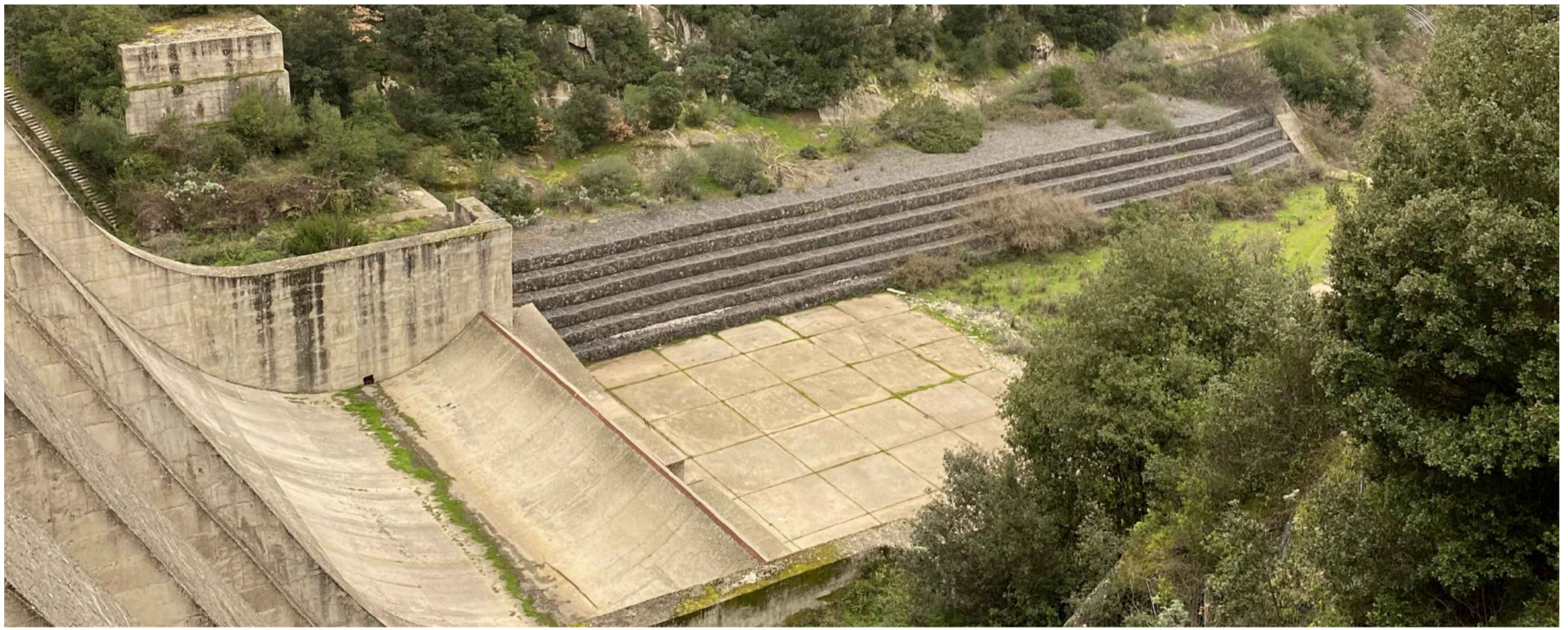
Esempio di sistemazione con gabbioni (Vasca di calma diga alto Temo)