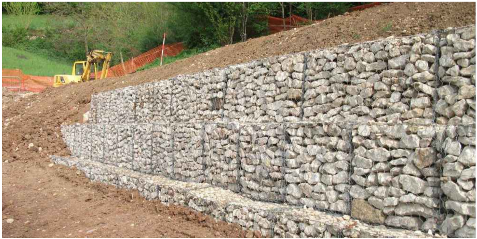
Esempio di sistemazione con gabbioni