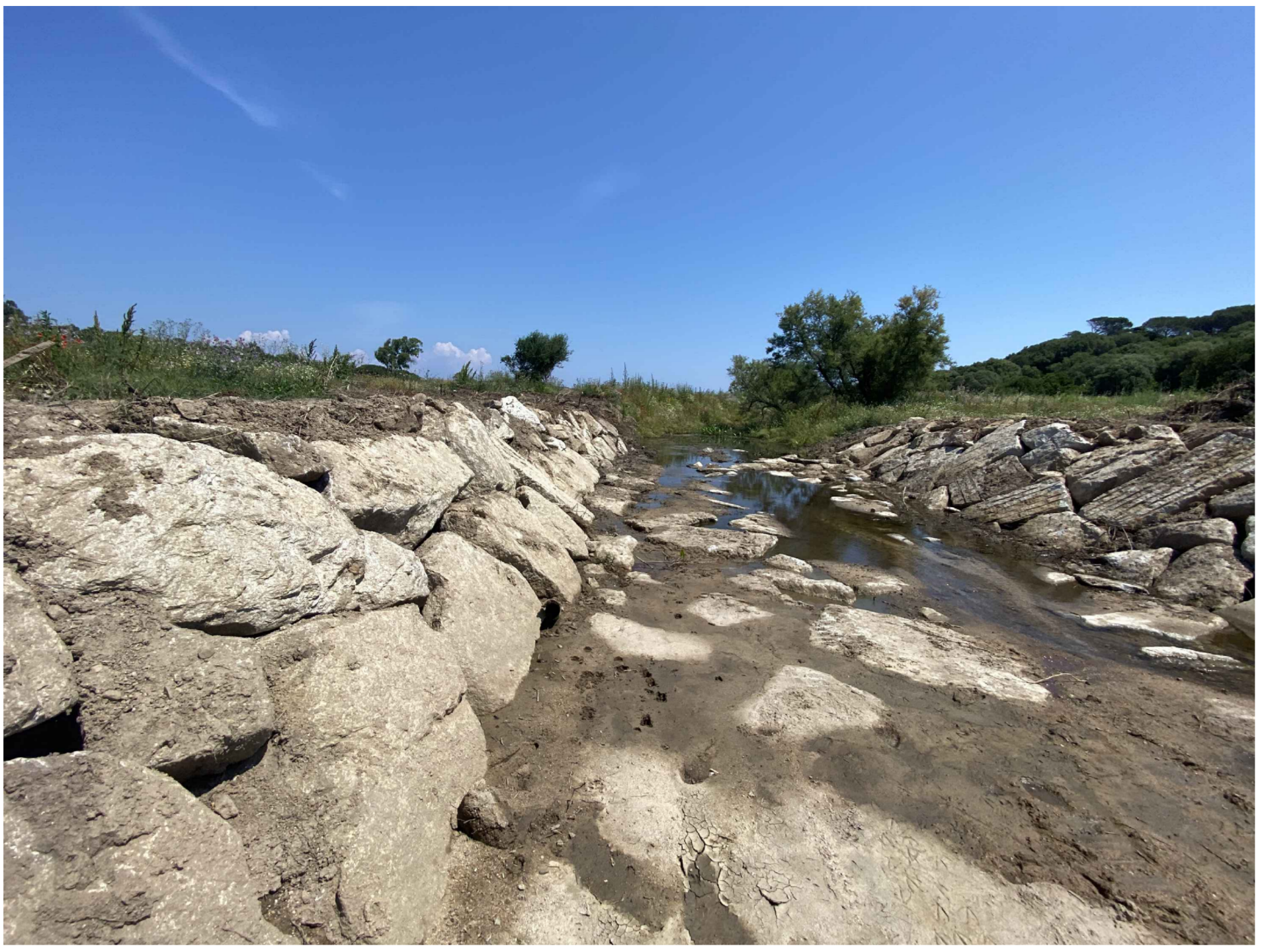
Esempio di risagomatura fondo alveo con scogliera in massi ciclopici