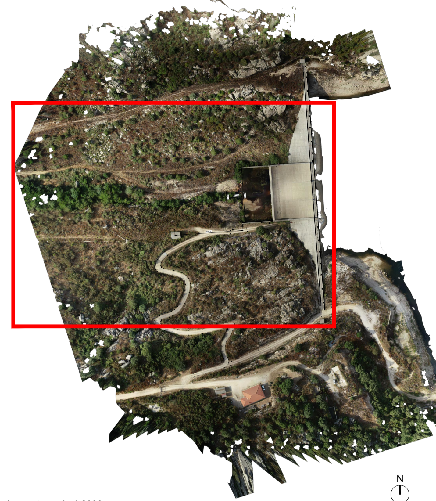
Inquadramento scala 1:2000