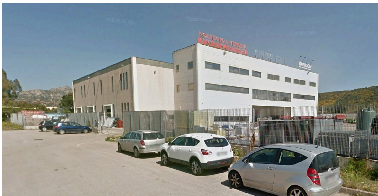
Figura 5 - Ricettore R2 fabbricato commerciale