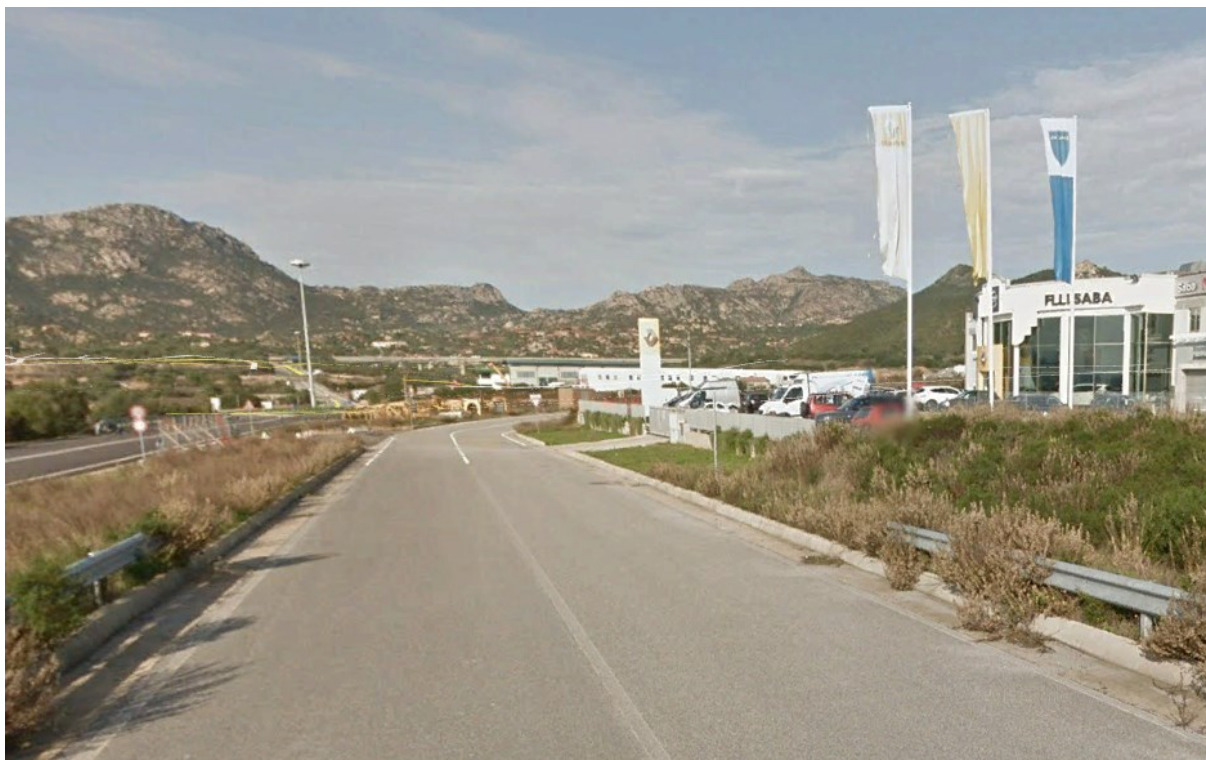
Figura 4 - Ricettore R1 concessionaria auto