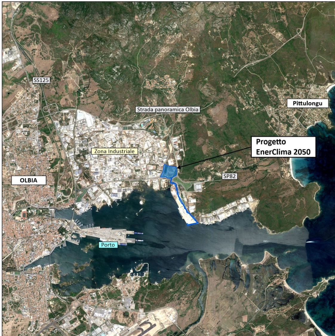
Figura 1 - Ubicazione sito in esame

Il Terminale sorgerà all'estremità orientale della zona industriale di Cala Saccaia (Consorzio CIPNES), in una zona posta a nord-est del centro abitato di Olbia (OT).