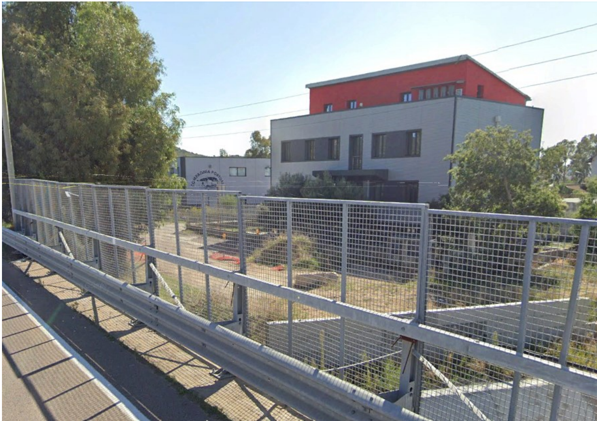
Figura 6 - Ricettore R3 fabbricato compagnia portuale privata