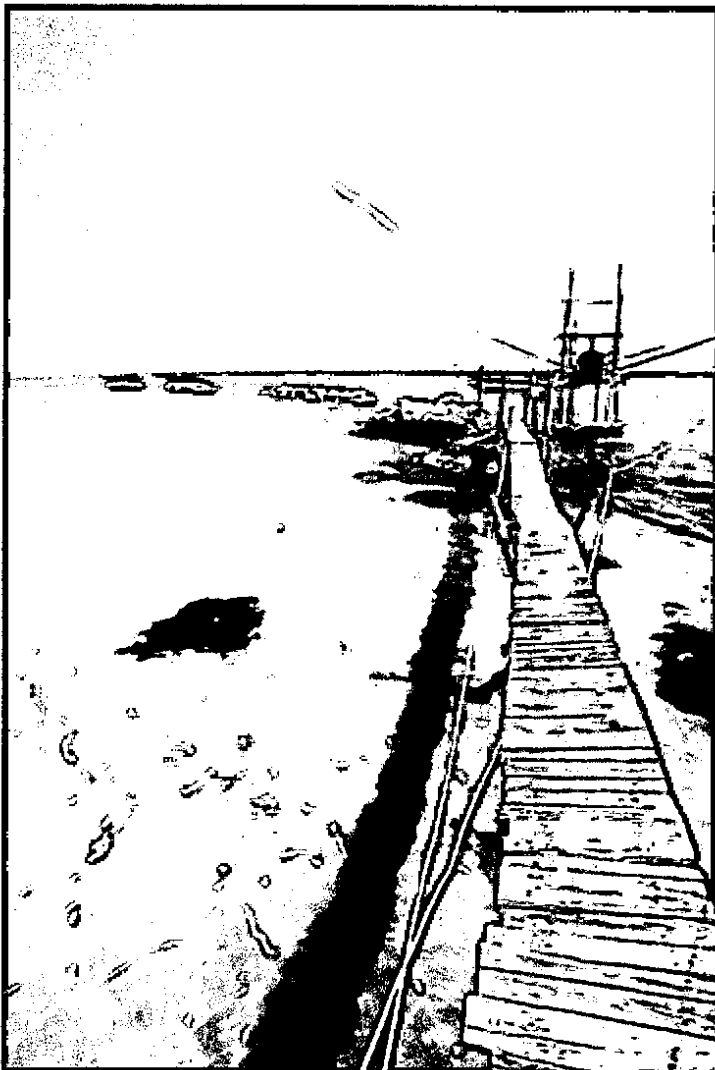
Fig. 2 immagine di P.ta Cavalluccio

Marina di Vasto tutte comprese all'interno dell'istituendo Parco Nazionale della Costa Teatina (Fig. 2)