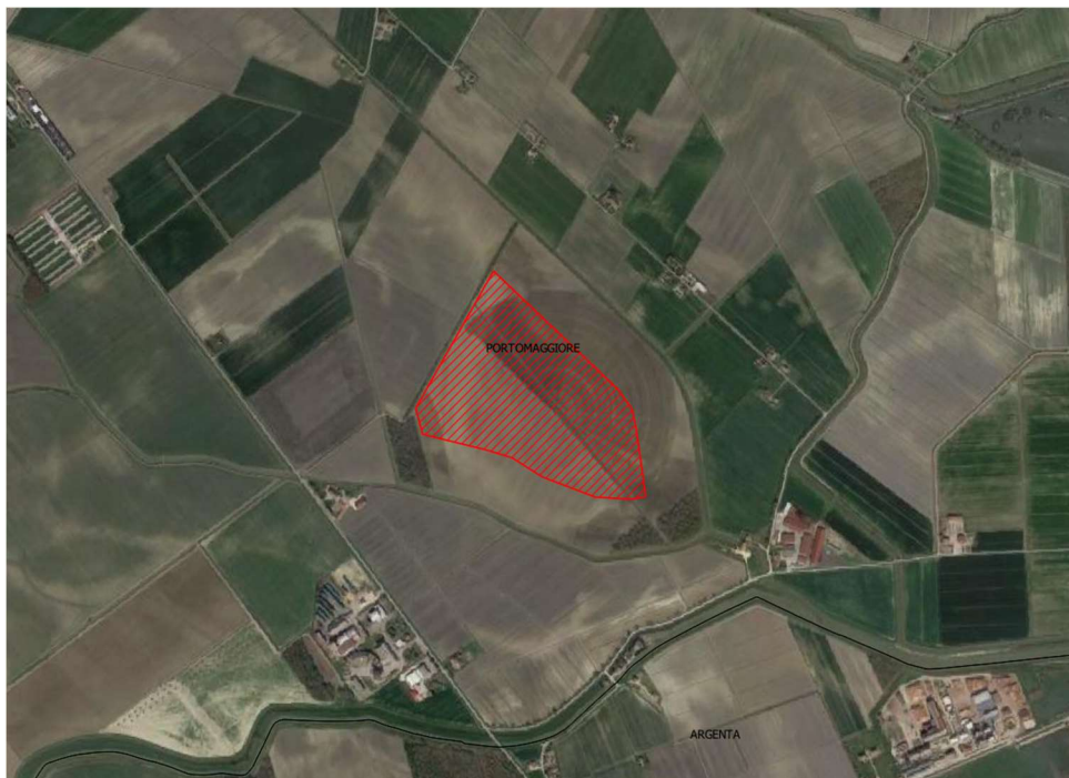
Figura 1: Aerofotogrammetrico – Impianto denominato

Nella figura seguente si riporta la collocazione del sito su vista aerofotogrammetrica.