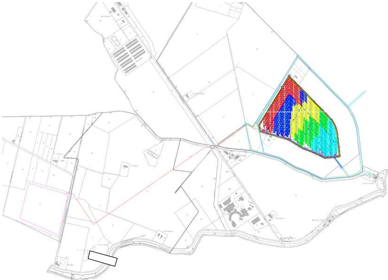
Figura 3: Layout preliminare di impianto

Di seguito si riporta una rappresentazione di layout preliminare di impianto, comprese le opere di connessione: cavidotto 36 kV fino alla stazione in progetto, di futura realizzazione.