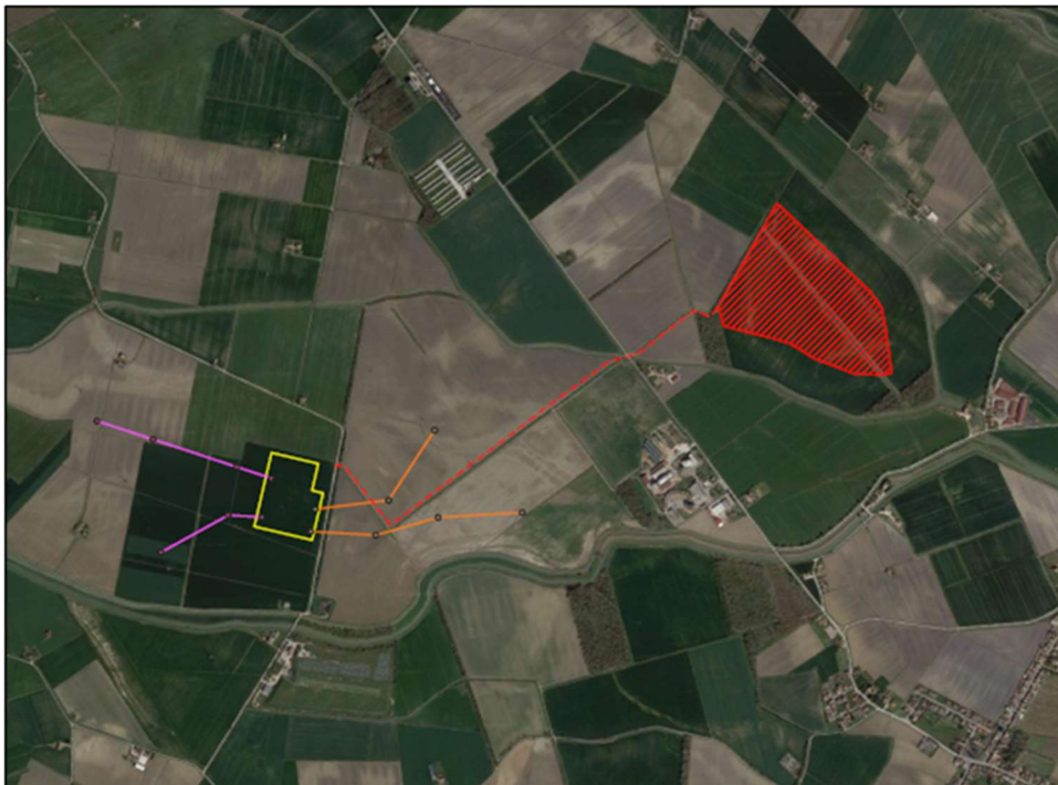
Figura 1: Aerofotogrammetrico – Impianto denominato

Nella figura seguente si riporta la collocazione del sito su vista aerofotogrammetrica (fonte Google Earth Pro ©).