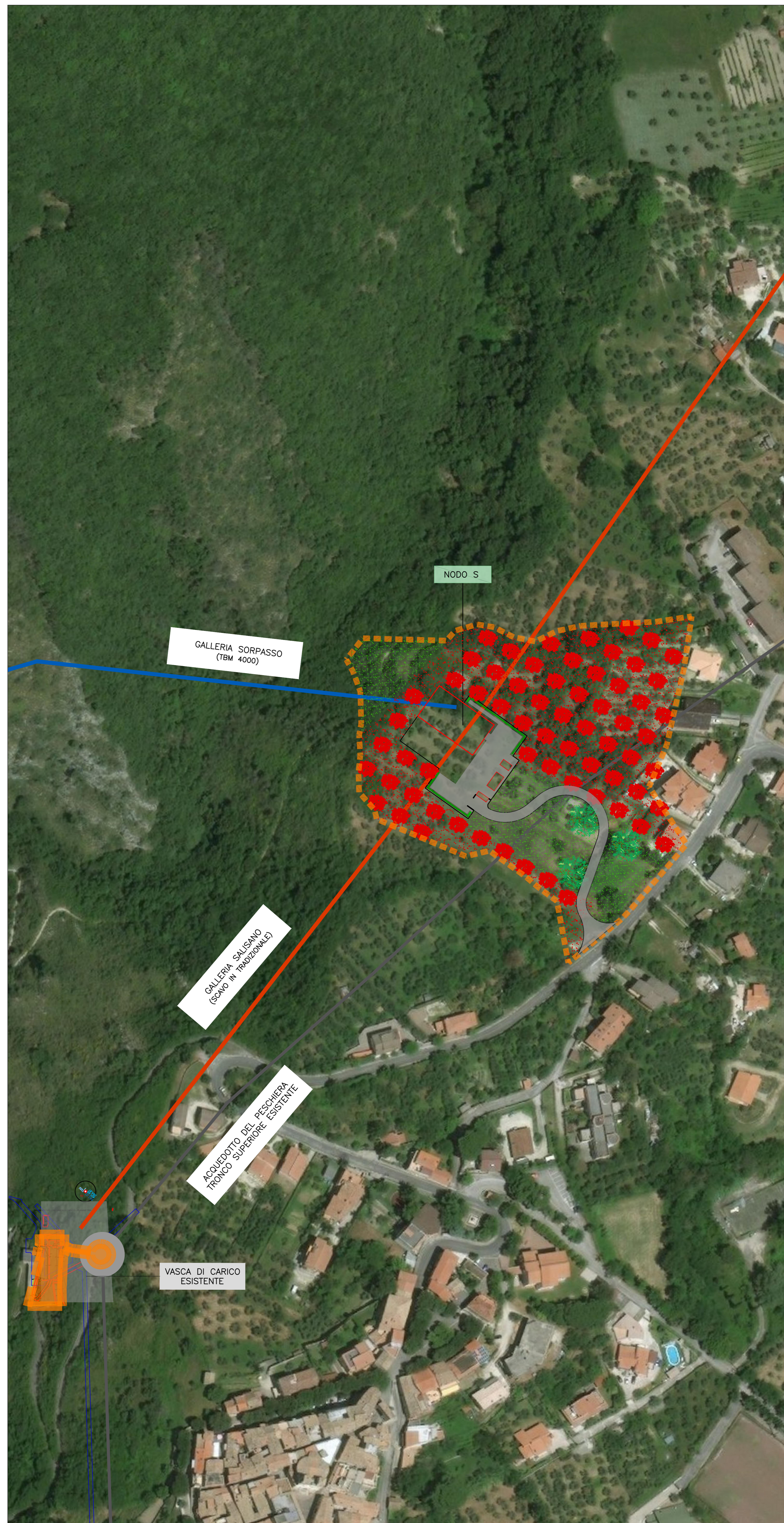
COROGRAFIA 1:1000 POST OPERAM