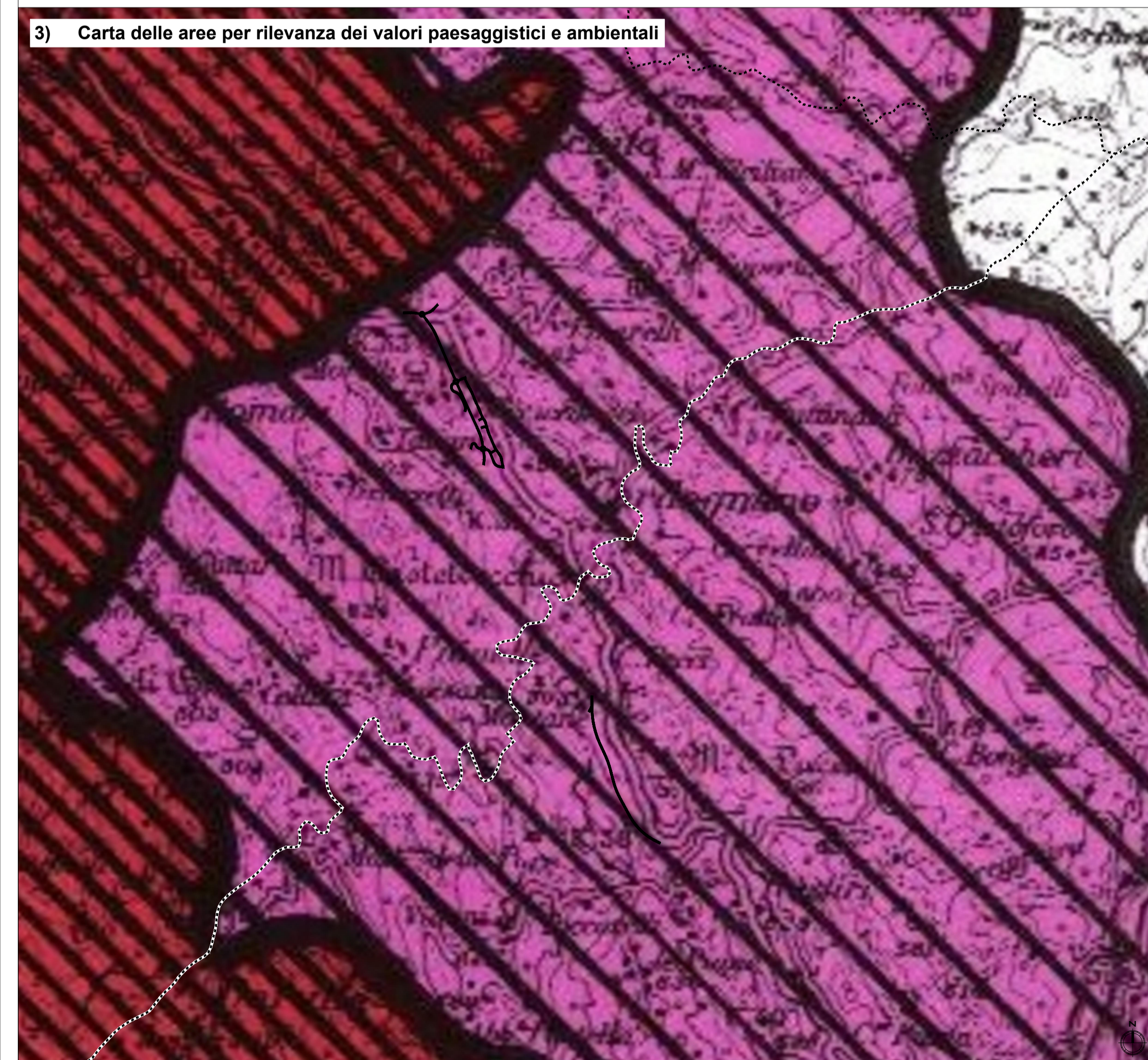
3) Carta delle aree per rilevanza dei valori paesaggistici e ambientali