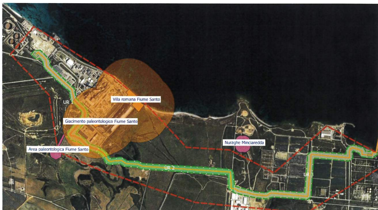
Immagine di dettaglio con le fasce di rispetto dei beni sottoposti a tutela diretta, ai sensi della Parte II del D.lgs.42/2004