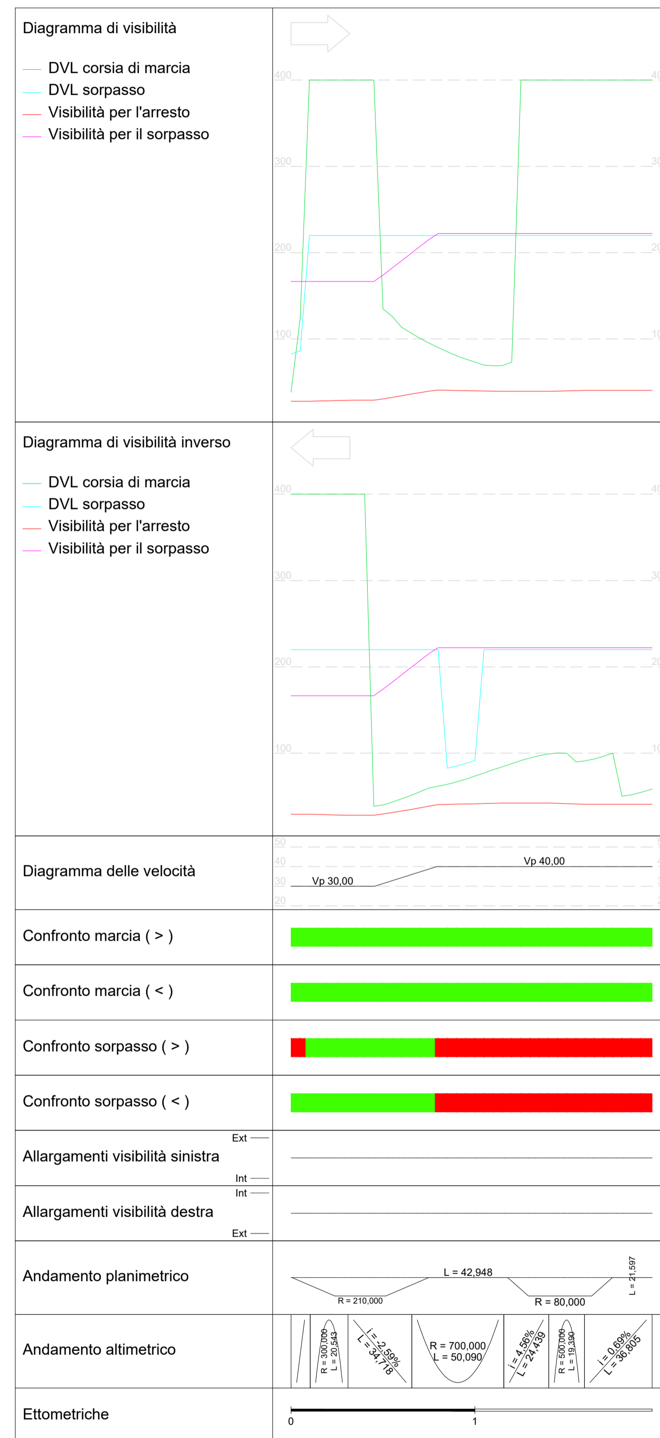
DIAGRAMMA DI VELOCITÀ E VISUALE LIBERA