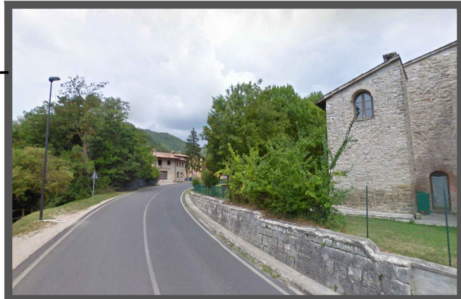
Infrastrutturali - Centro abitato