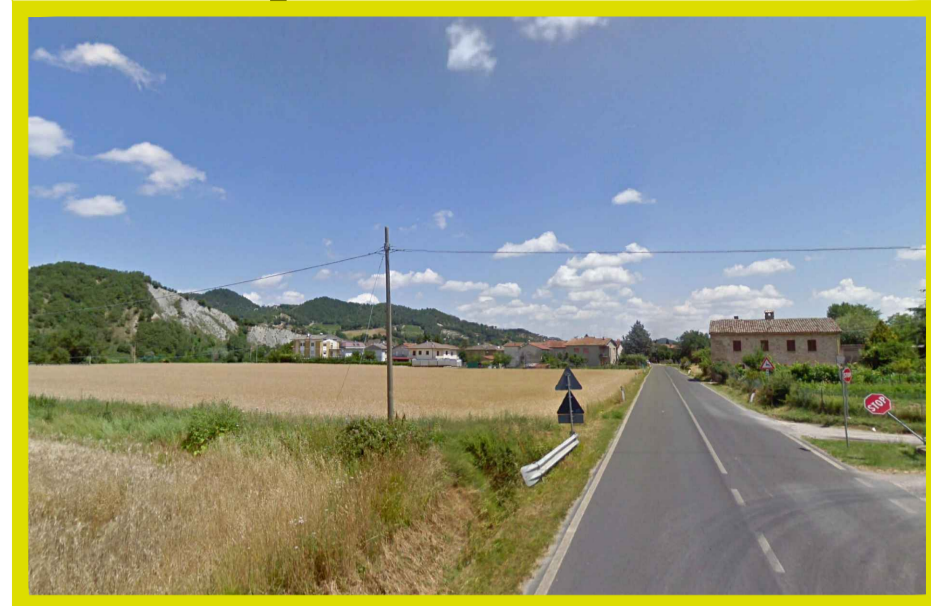
Fisici e naturali - Aree agricole