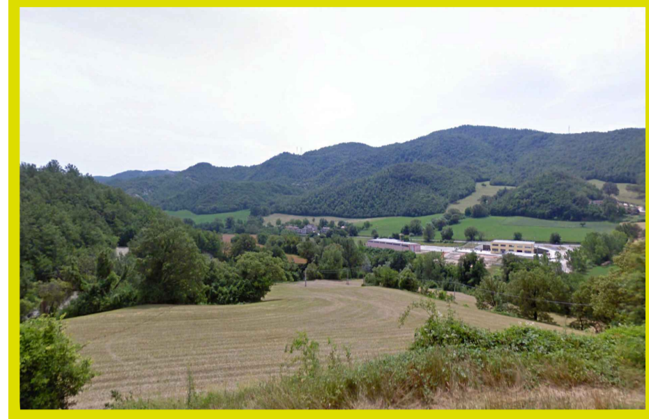
Fisici e naturali - Aree boscate