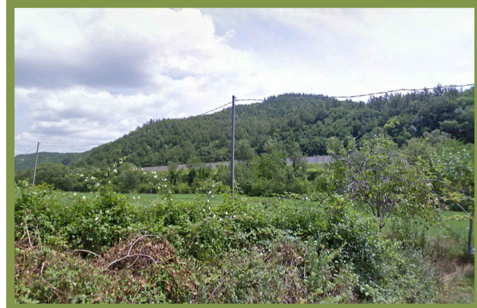
Fisici e naturali - Reticolo idrografico