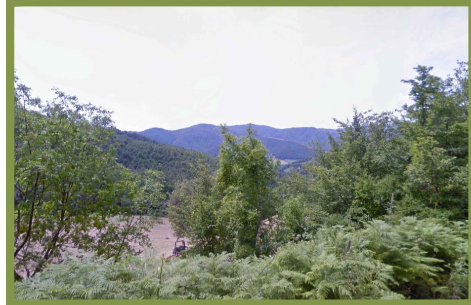
Fisici e naturali - Aree boscate