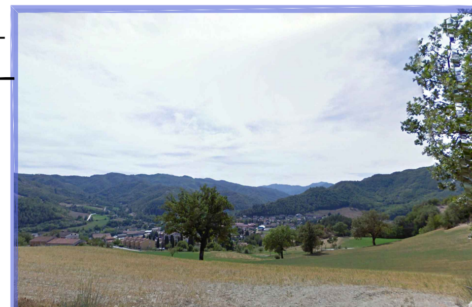
Patrimonio culturale - Beni puntuali