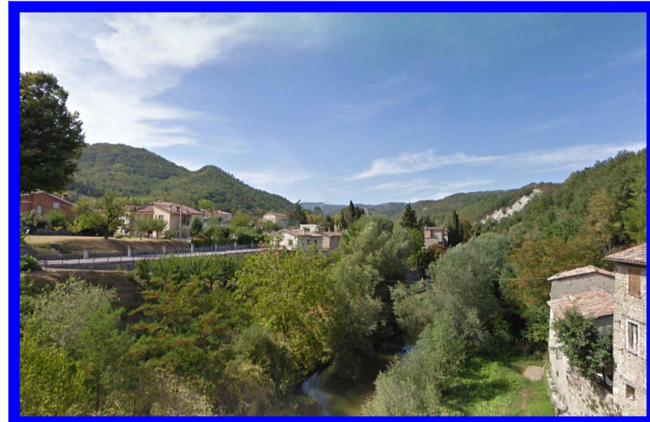
Fisici e naturali - Reticolo idrografico