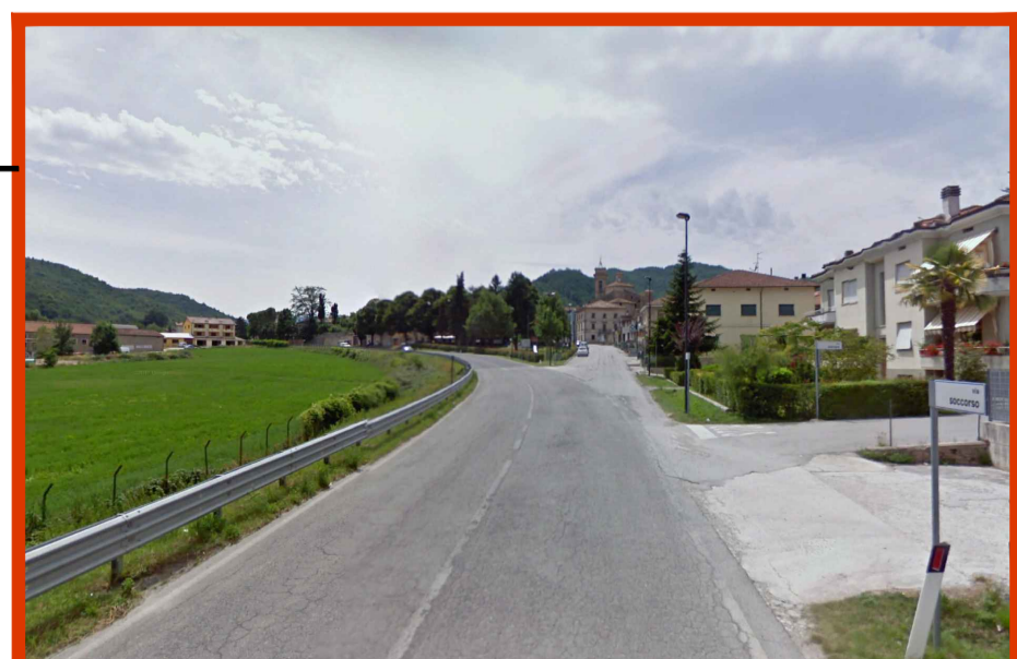
Insediativi e Infrastrutturali - Centro abitato