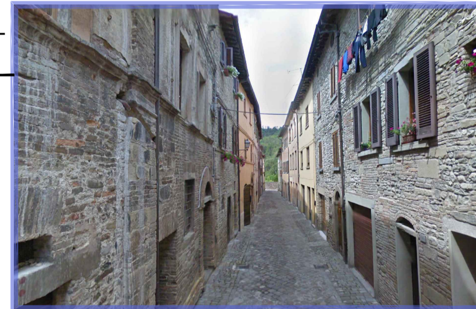
culturale - Beni puntuali