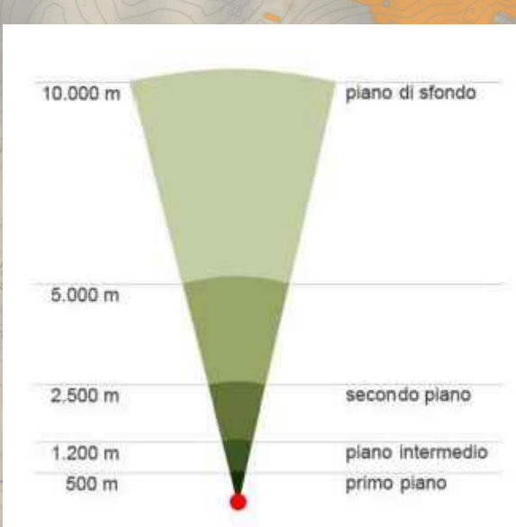
Schema fasce di visibilità