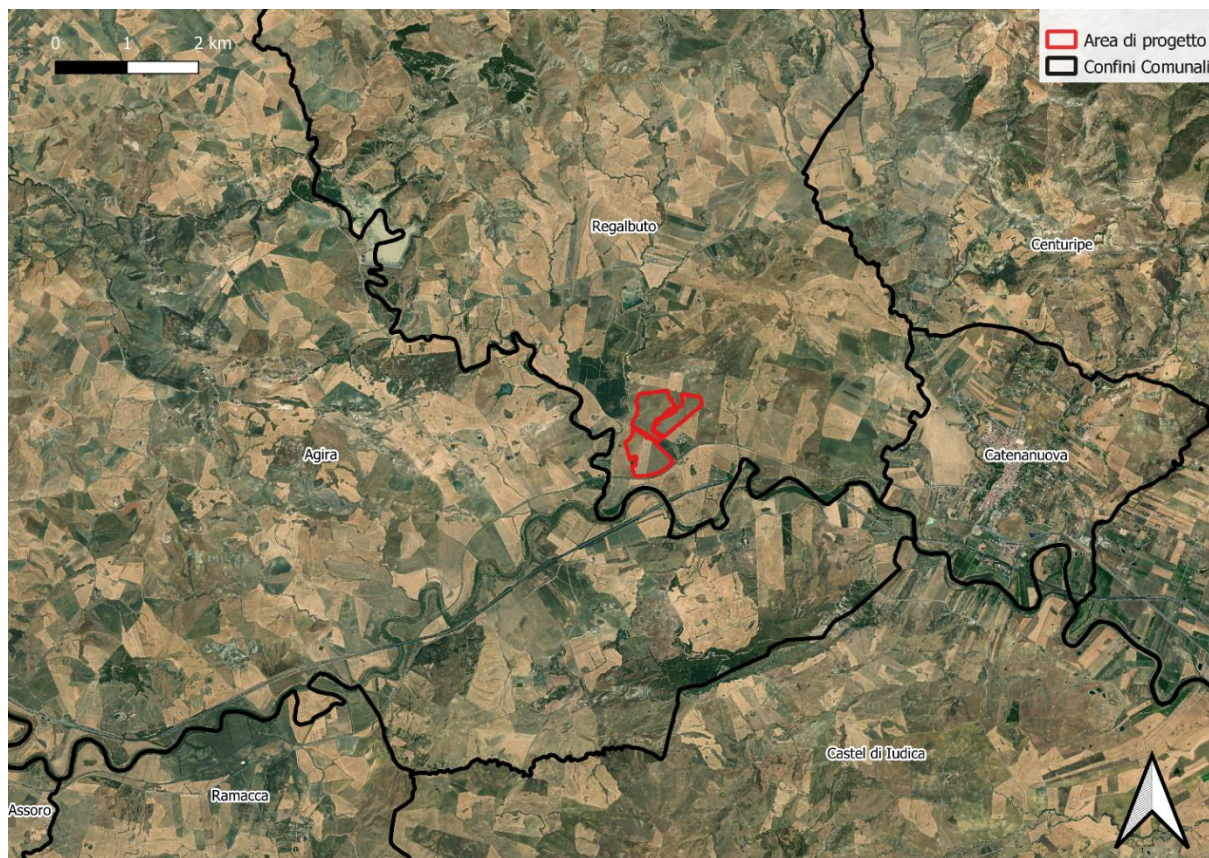
Figura 1.1: Inquadramento dell'area di progetto

Il sito in oggetto risulta inoltre posto a circa 400 metri a nord dal tracciato dell'autostrada A19, in adiacenza con la fascia di rispetto nord della ferrovia Palermo-Catania, circa 5 km a ovest della stazione di Catenanuova-Centuripe e a circa 1,8 km dall'incrocio tra la strada provinciale SP60 e la strada provinciale SP59.