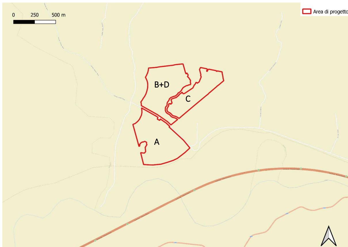
Figura 1.2: Inquadramento stradale dell'area di progetto

Il campo fotovoltaico in progetto è costituito da 4 sezioni, A, B, C, D: