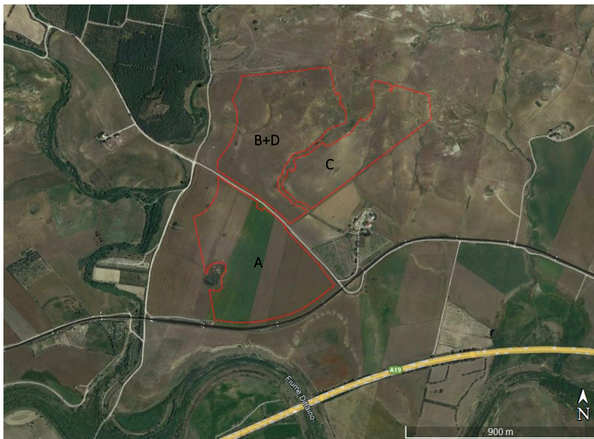
Figura 1.3: Localizzazione area d'intervento

L'area deputata all'installazione dell'impianto fotovoltaico in oggetto risulta essere adatta allo scopo presentando una buona esposizione ed è facilmente raggiungibile ed accessibile attraverso le vie di comunicazione esistenti.