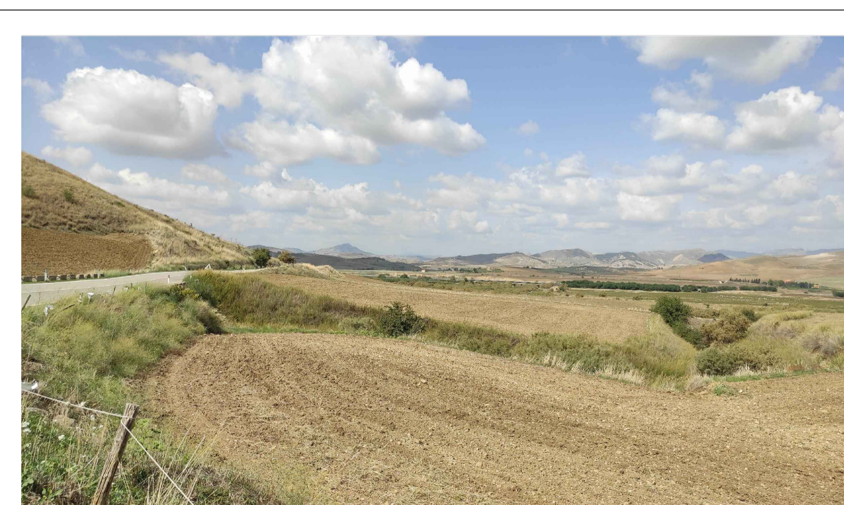
FOTONSERIMENTO 2 - STATO DI FATTO