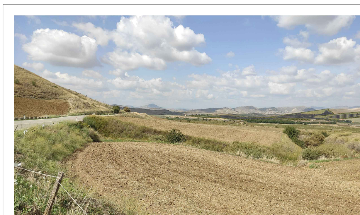
FOTONSERIMENTO 2 - STATO DI PROGETTO