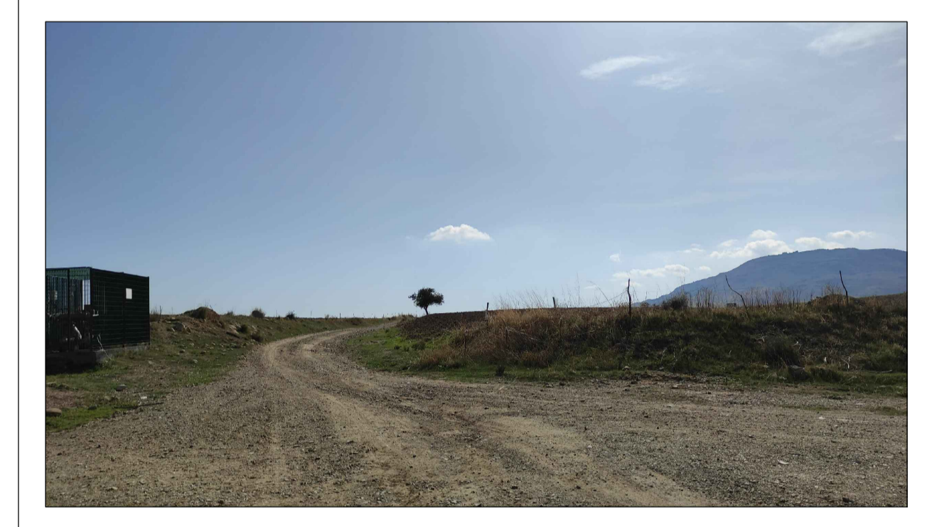
FOTOINSERIMENTO 5 - STATO DI FATTO