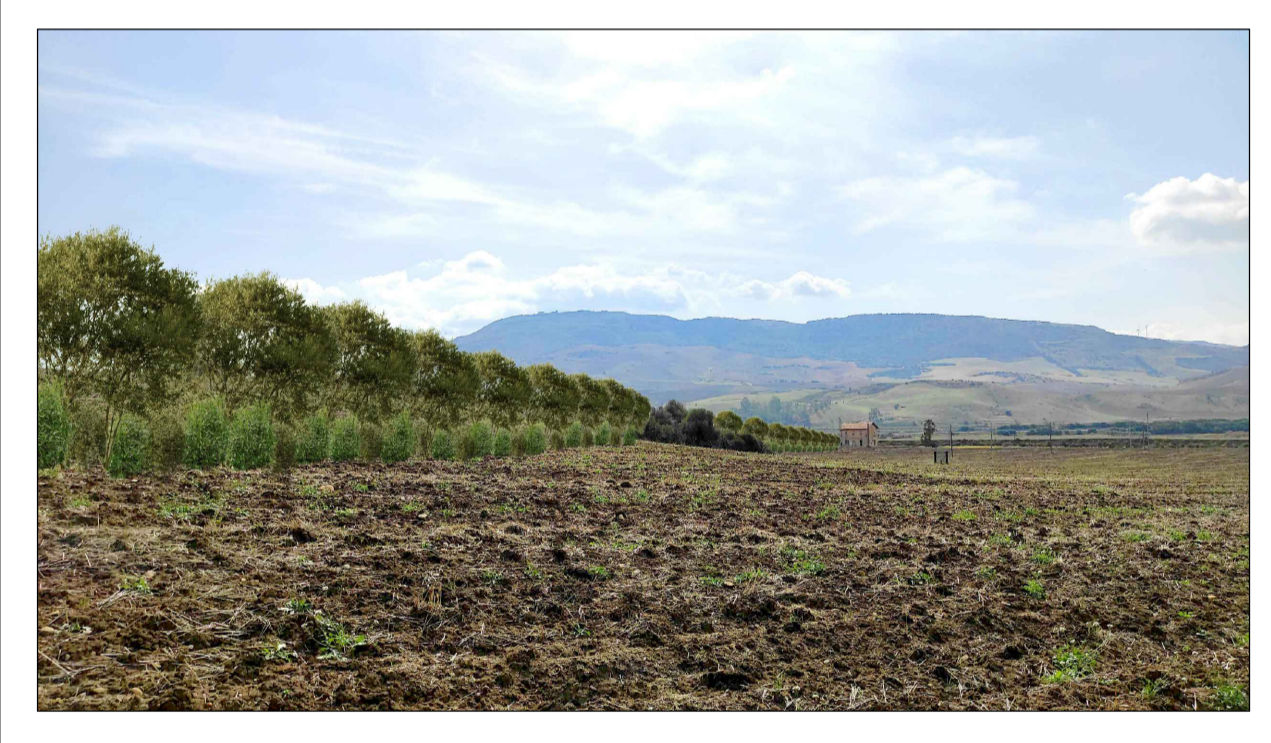
FOTOINSERIMENTO 6 - STATO DI PROGETTO