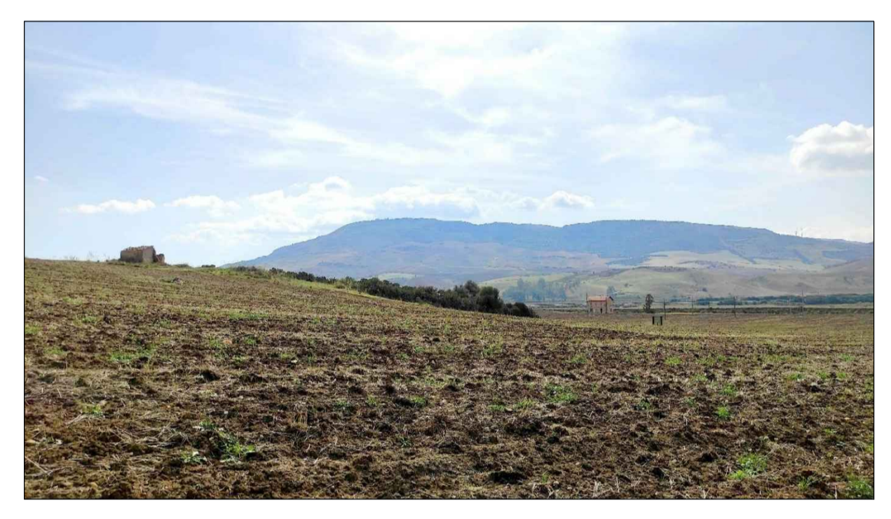
FOTOINSERIMENTO 6 - STATO DI FATTO