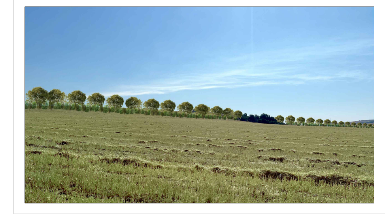
FOTOINSERIMENTO 3 - STATO DI PROGETTO