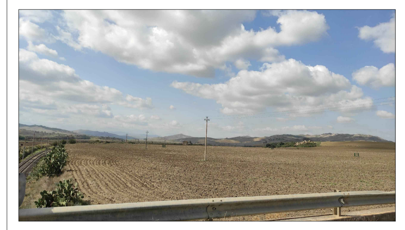
FOTOINSERIMENTO 10.1 - STATO DI FATTO