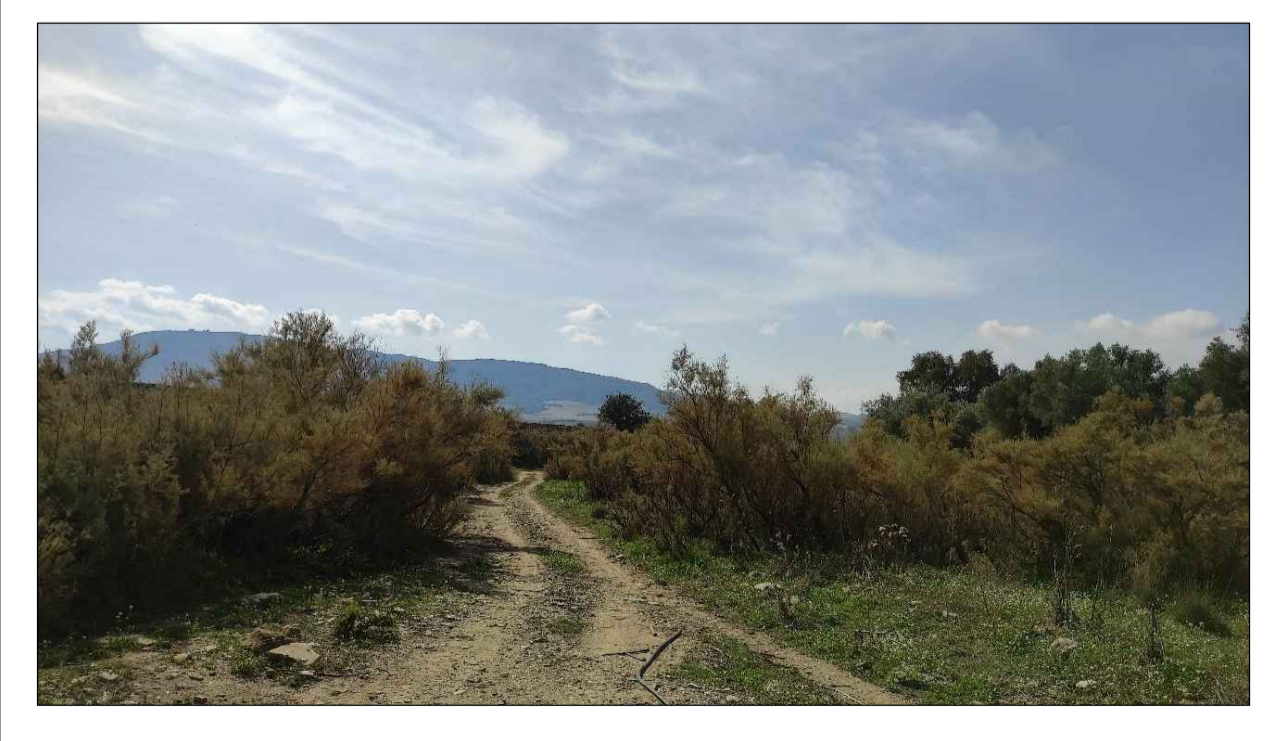
PUNTO DI PRESA FOTOGRAFICA 7