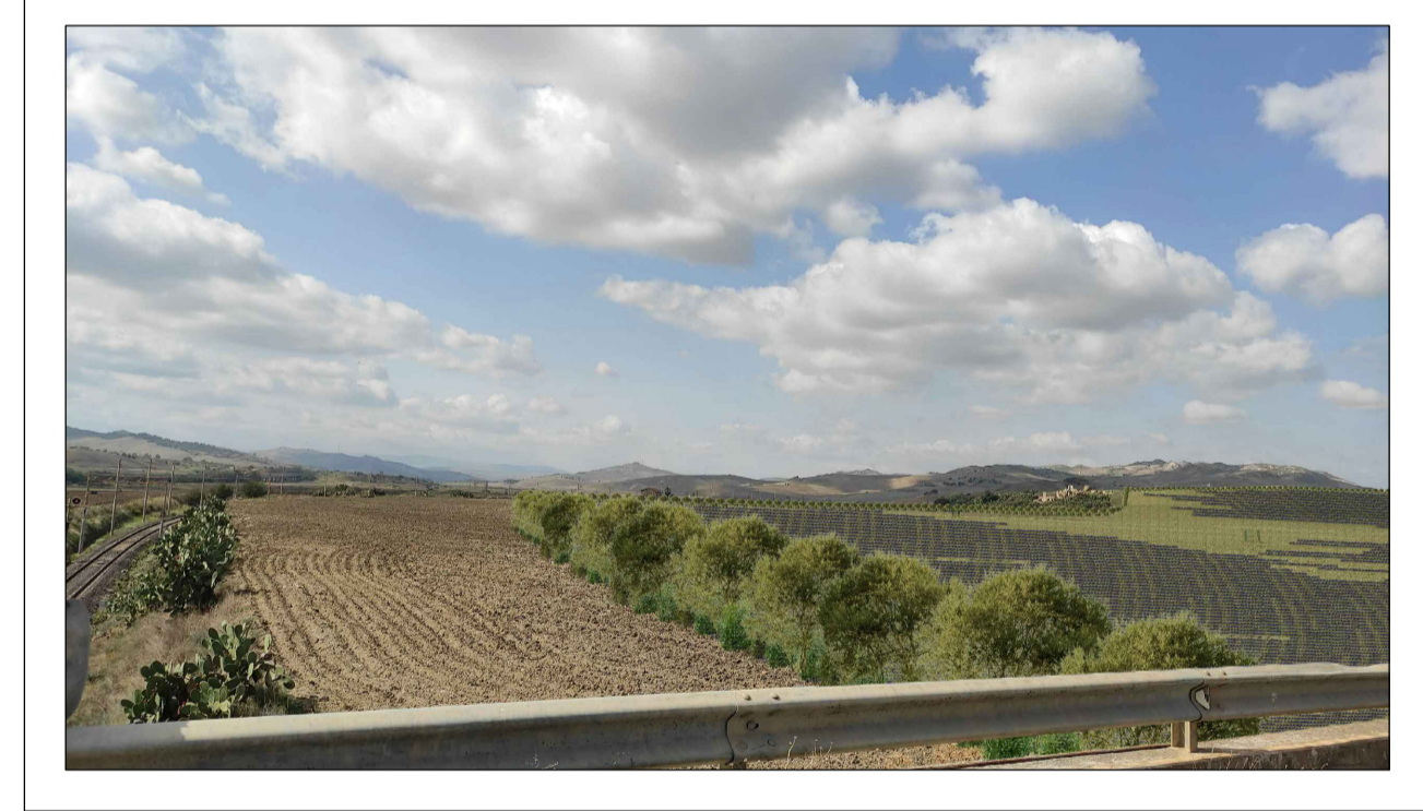
FOTOINSERIMENTO 4 - STATO DI PROGETTO