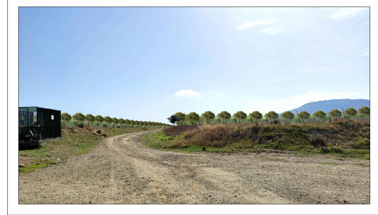
FOTOINSERIMENTO 5 - STATO DI PROGETTO