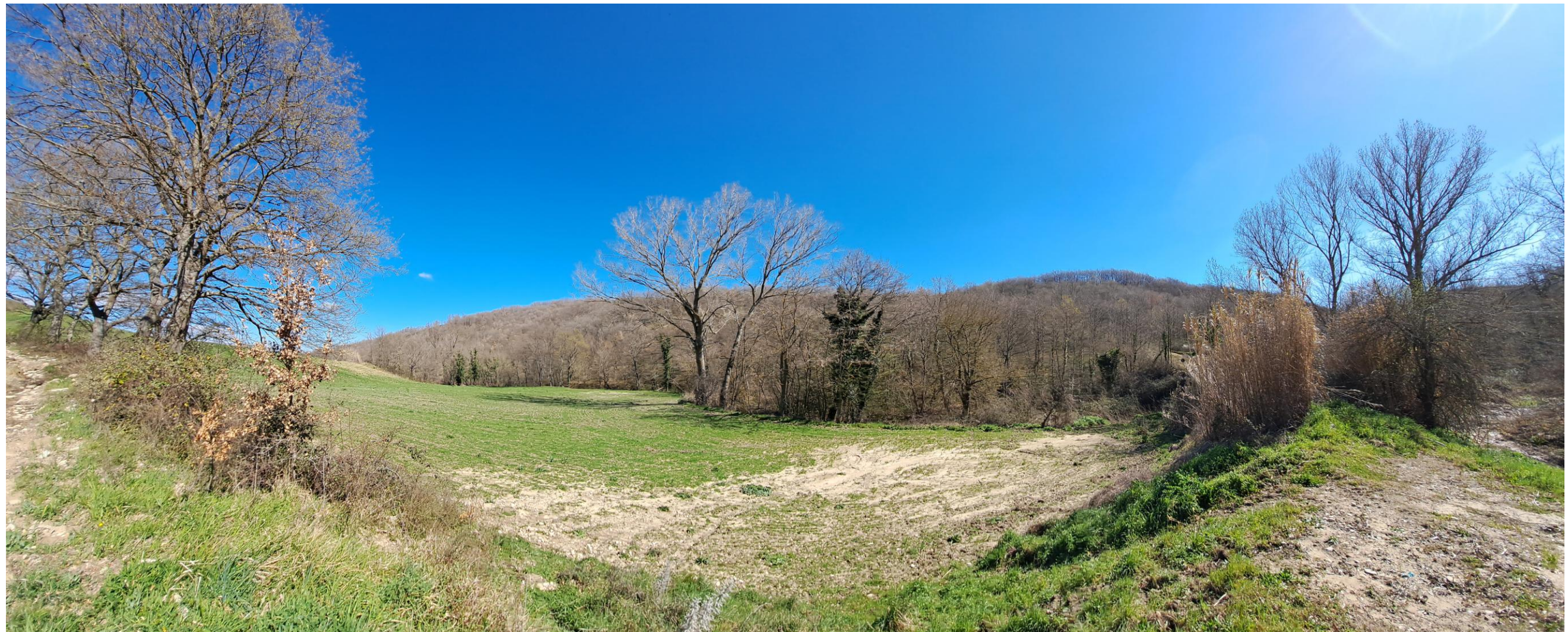
Scatto 5_ Vallone Lapilloso_Vista ANTE OPERAM in direzione di Maschito