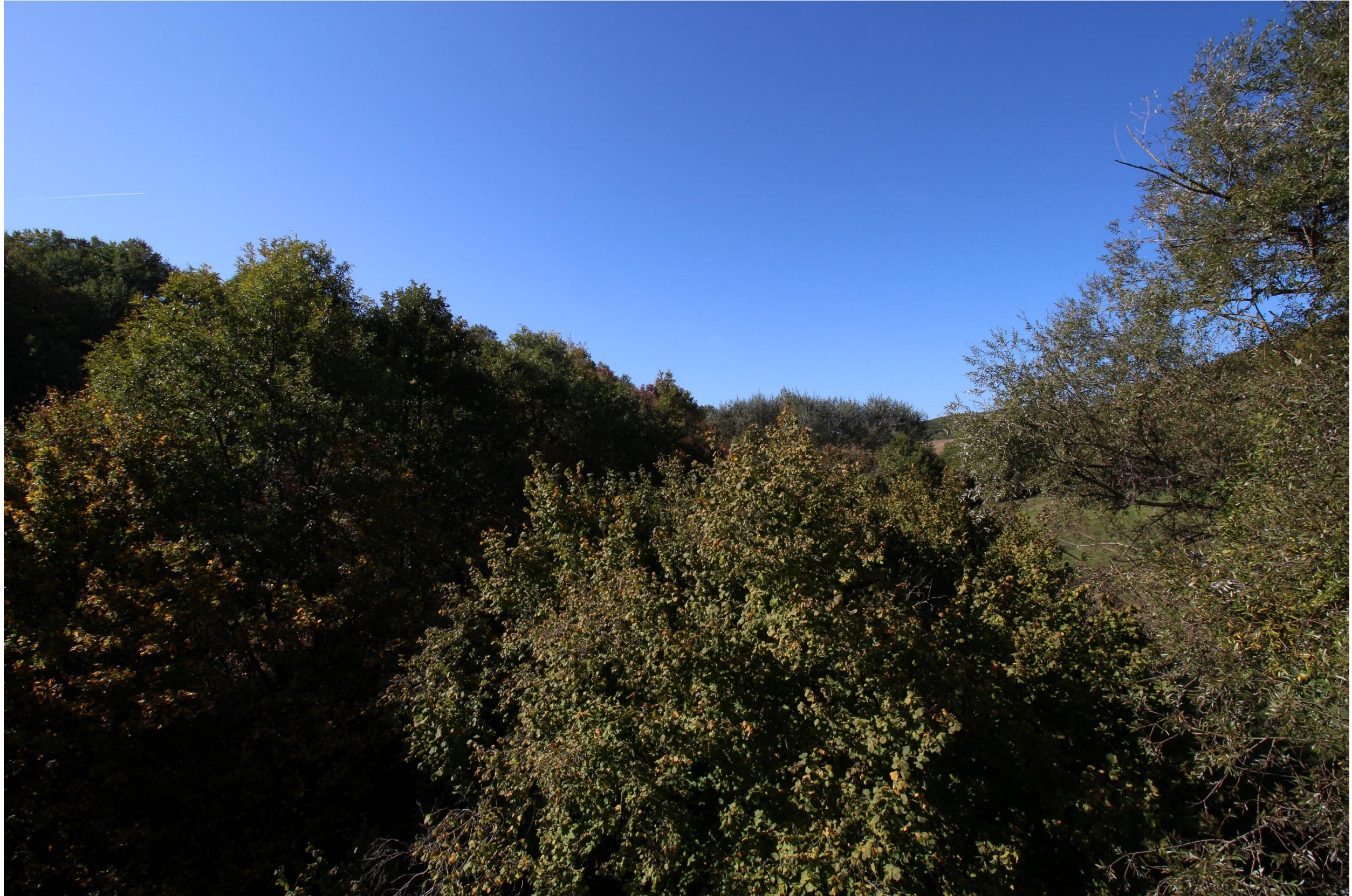
Scatto 3_Vista in direzione del Vulture - Ante operam = Post operam