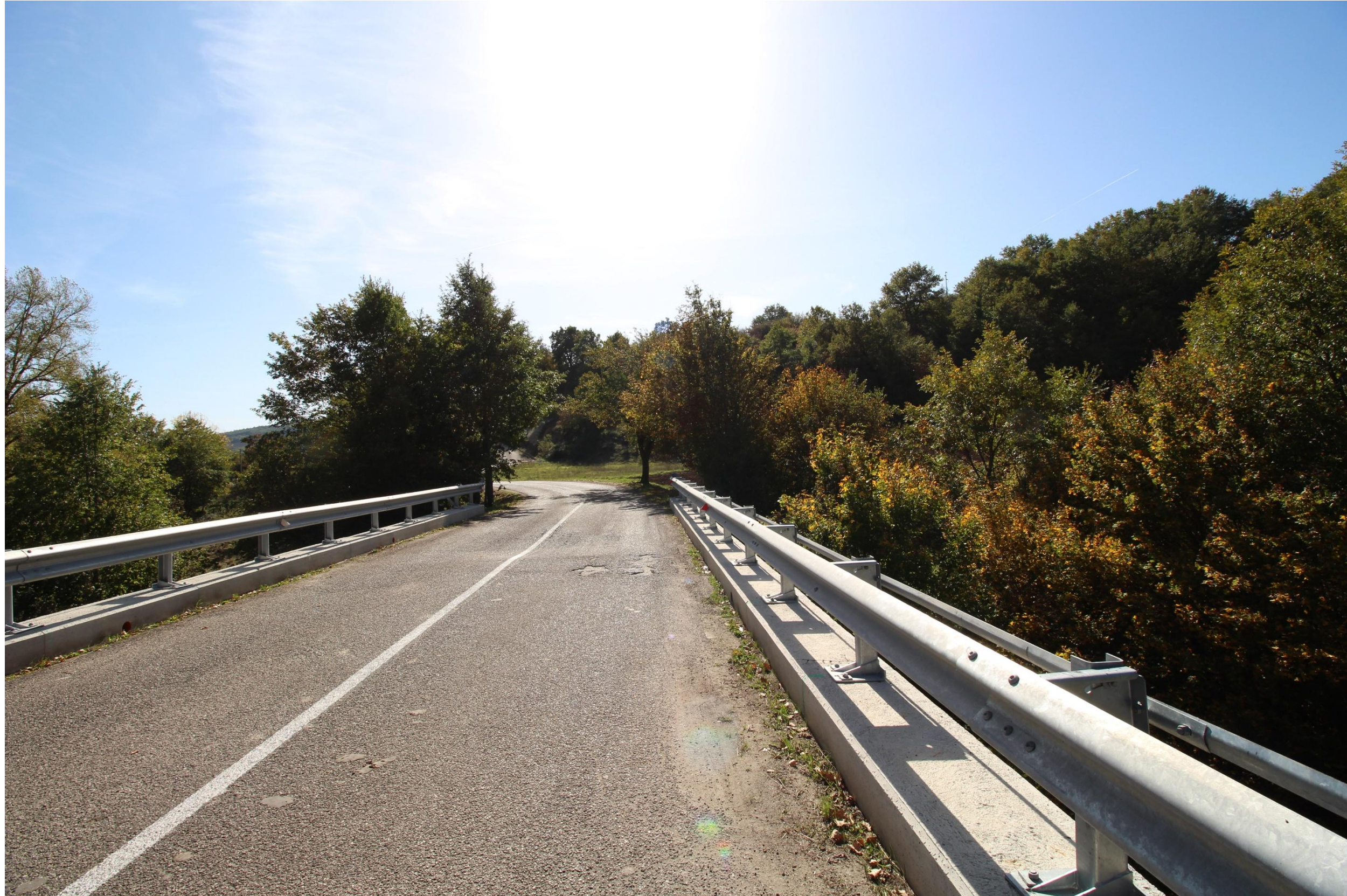
Scatto 1_Vista in direzione di Lagopesole dal Torrente Fiumarella - Ante operam = Post operam