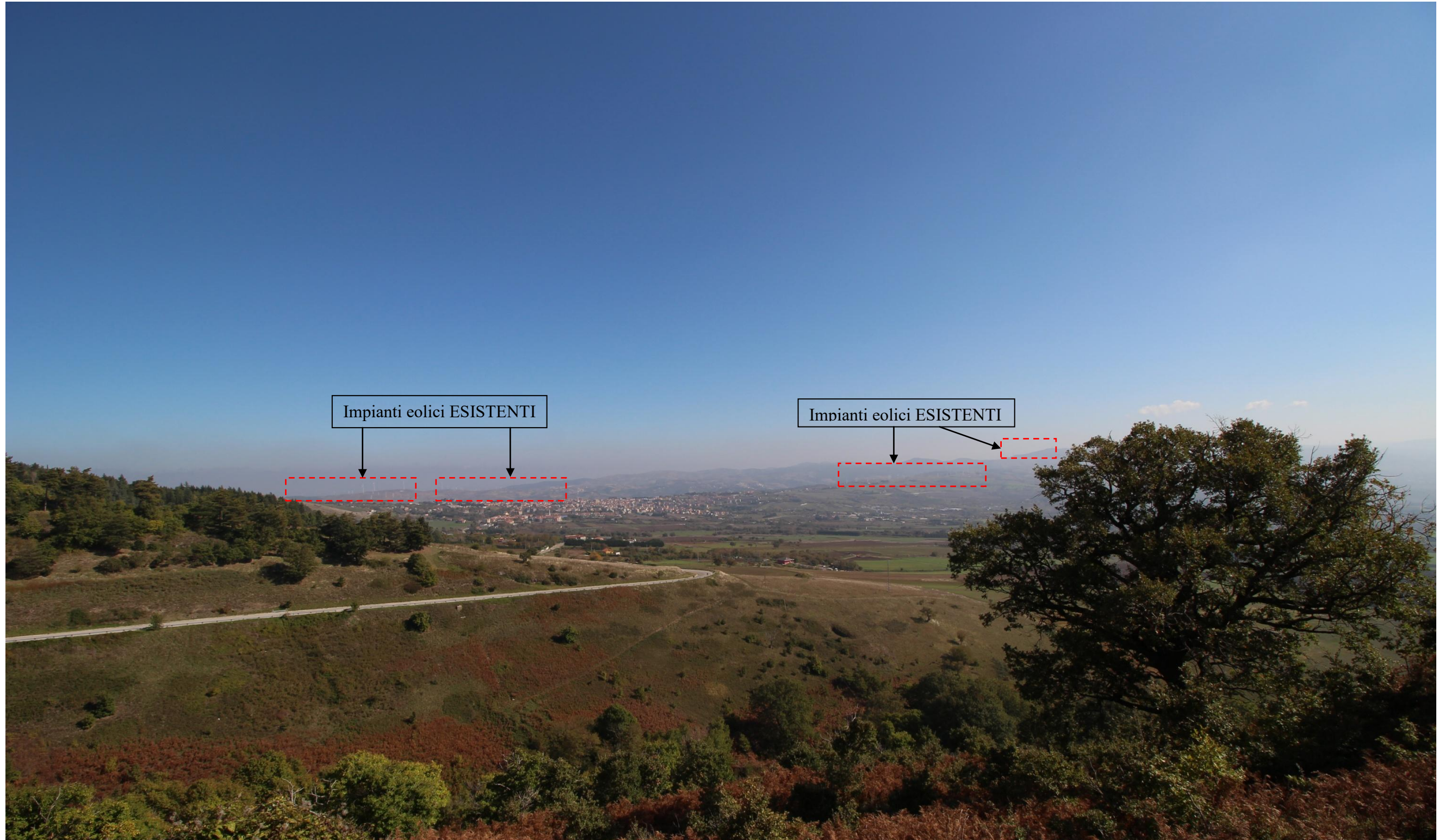
Scatto 7_Vista ANTE OPERAM dalla S.P 167 in direzione dell'area impianto