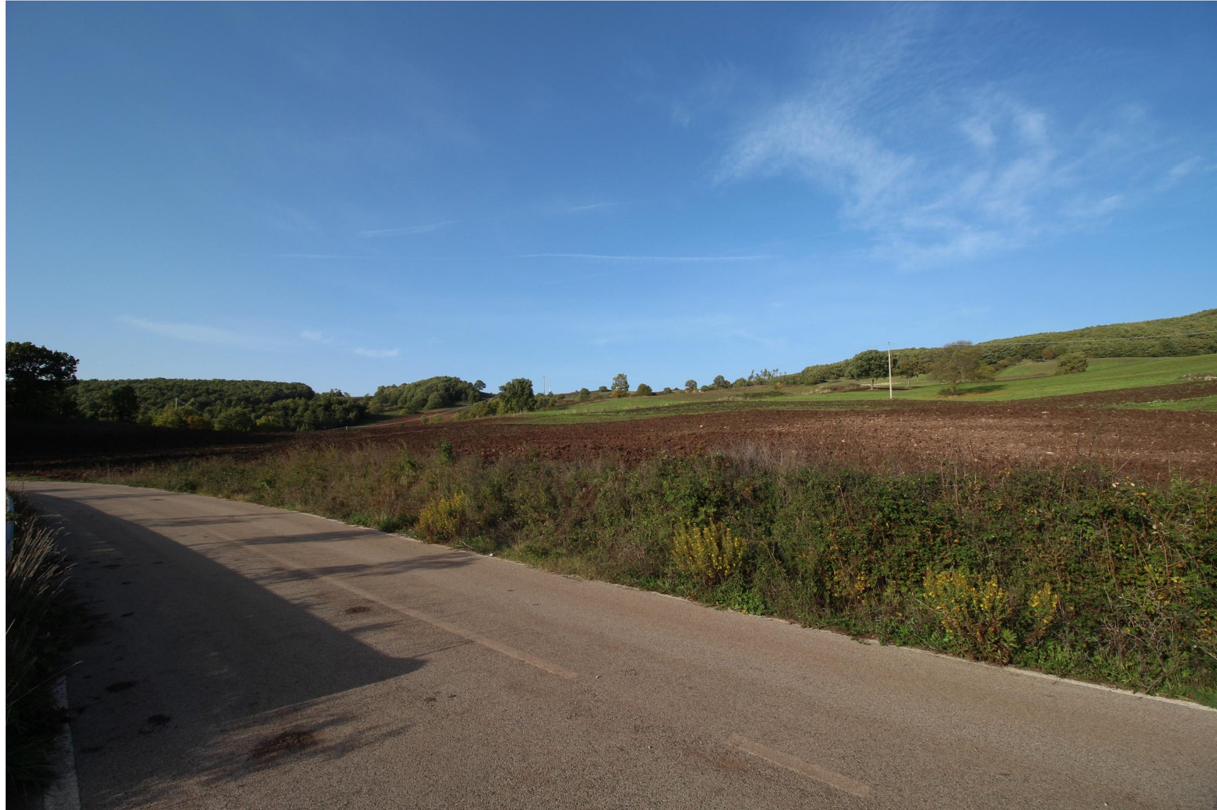
Scatto 10_ ANTE OPERAM = POST OPERAM