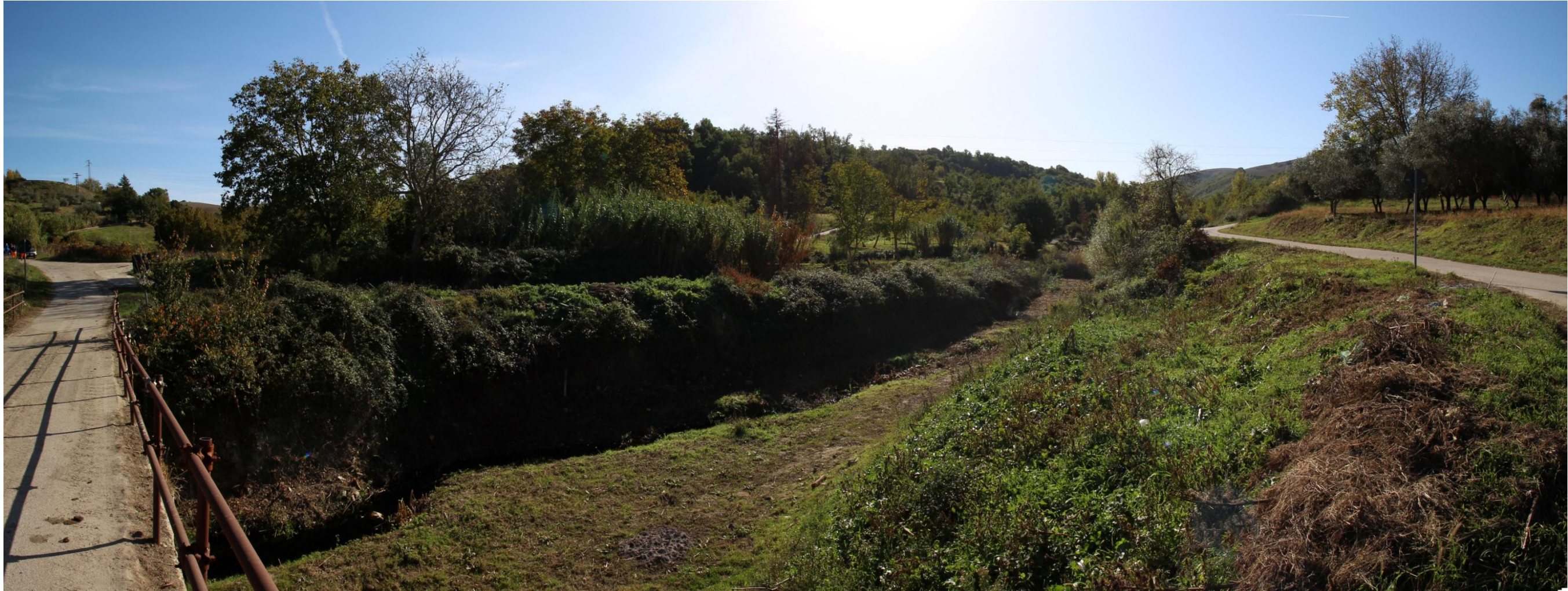
Scatto 4_Vallone Cerasa, Fiumara dell'Arcidiano Vista ANTE OPERAM