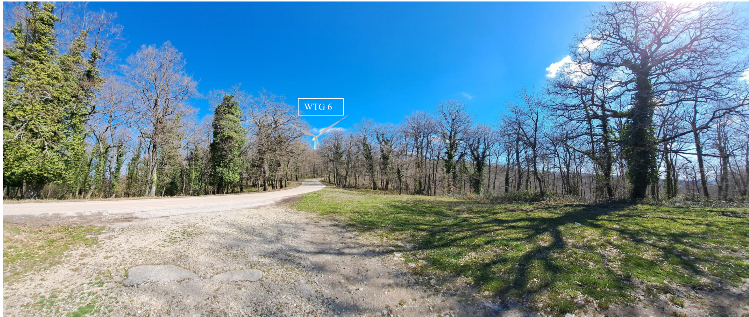
Scatto 8_ Vista POST OPERAM dalla S.P 8 in direzione di Maschito