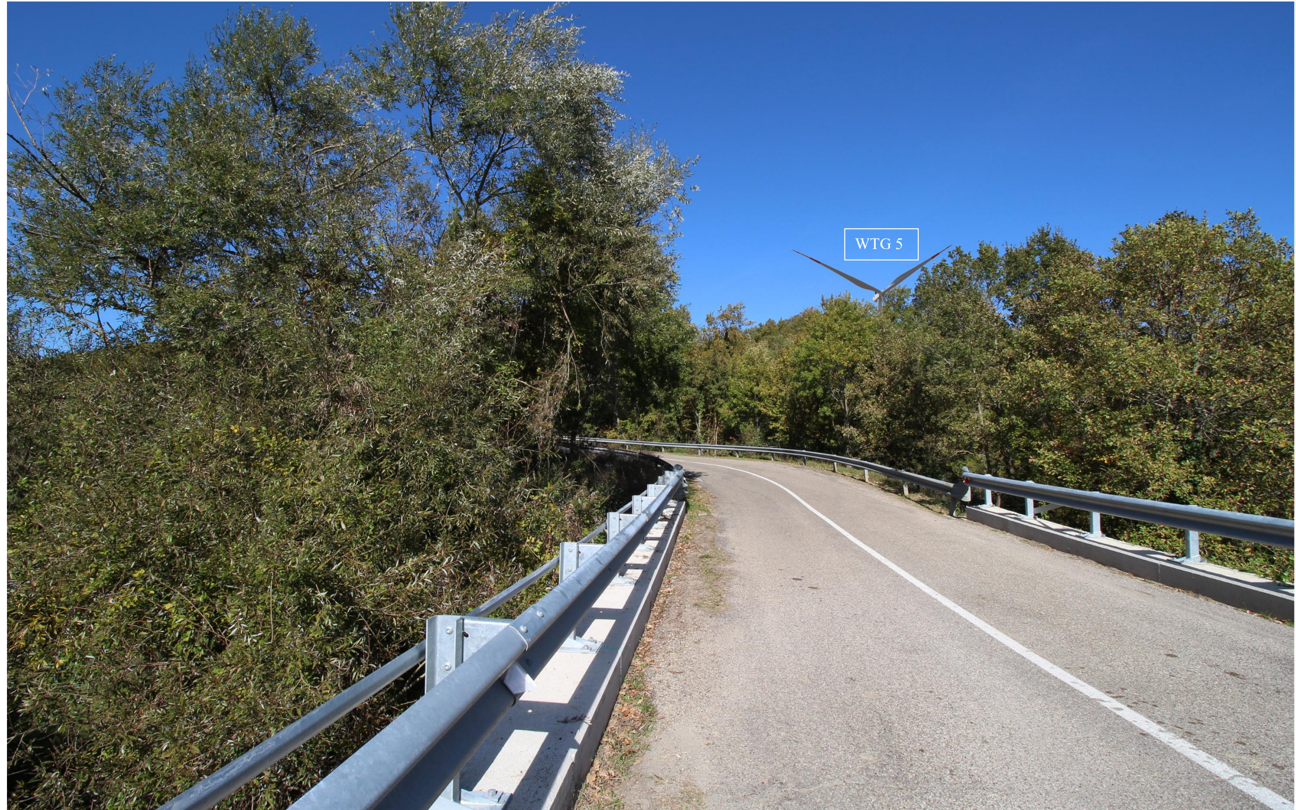
Scatto 2_ Vista POST OPERAM in direzione di Maschito dal Torrente Fiumarella