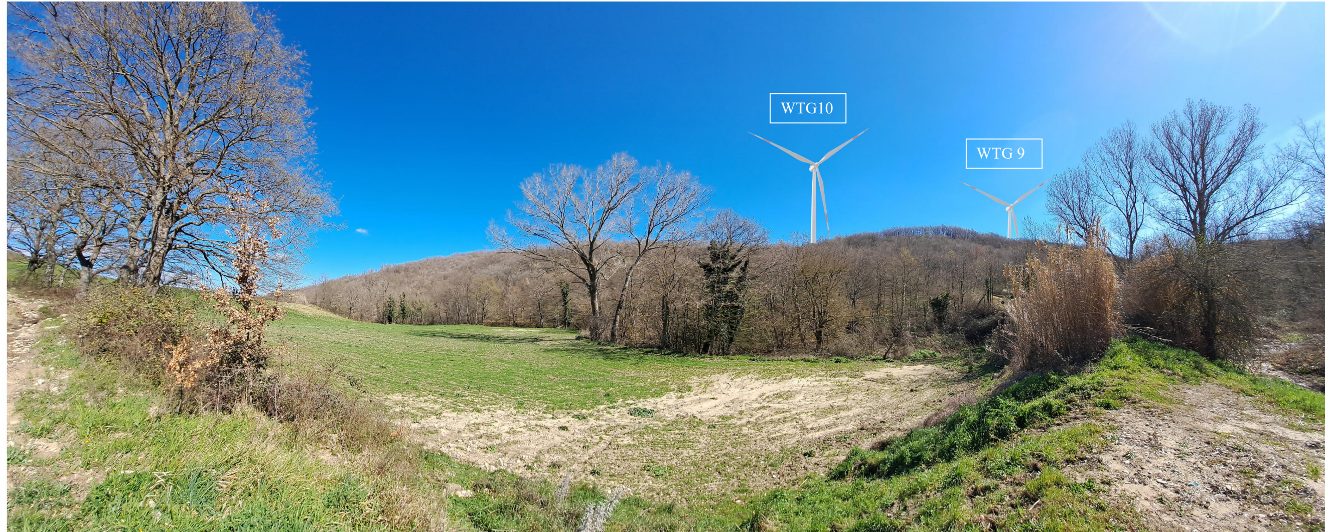
Scatto 5_ Vallone Lapilloso_Vista POST OPERAM in direzione di Maschito