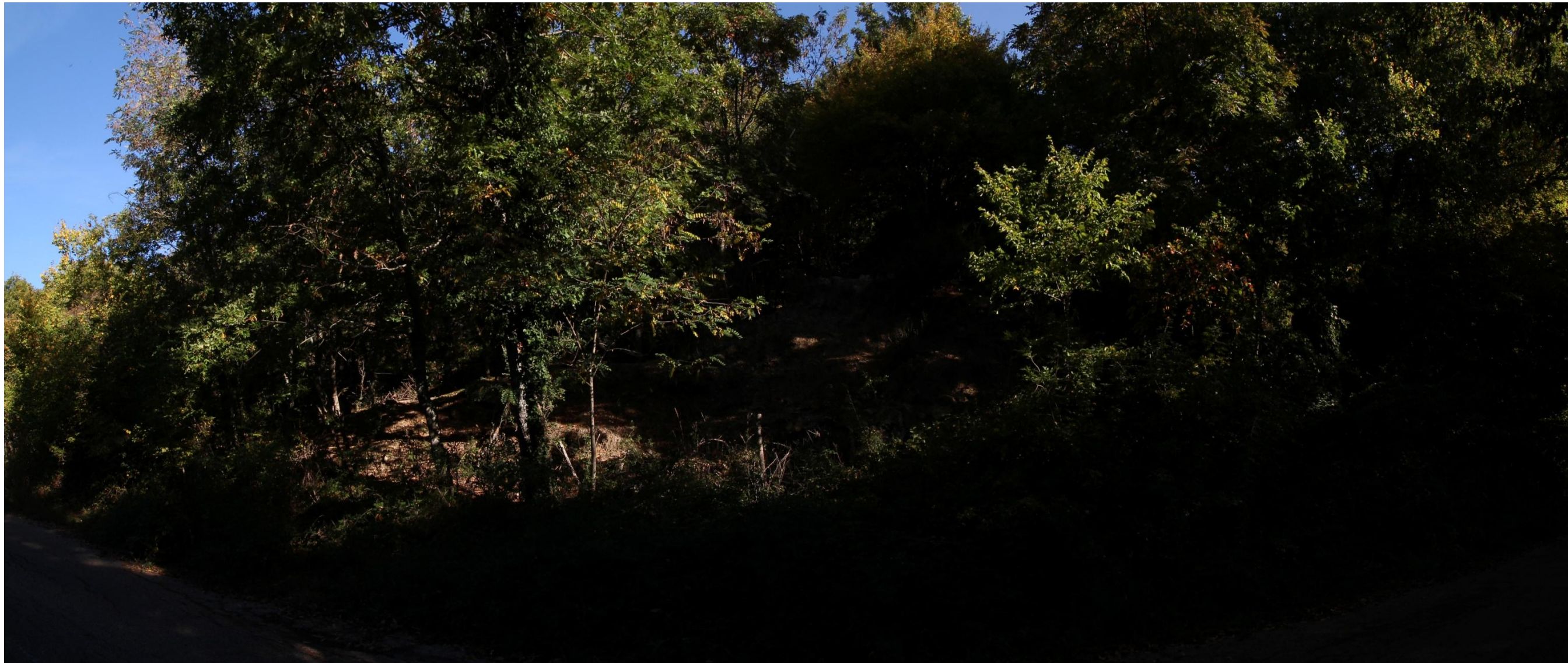
Scatto 11_ANTE OPERAM = POSTE OPERAM