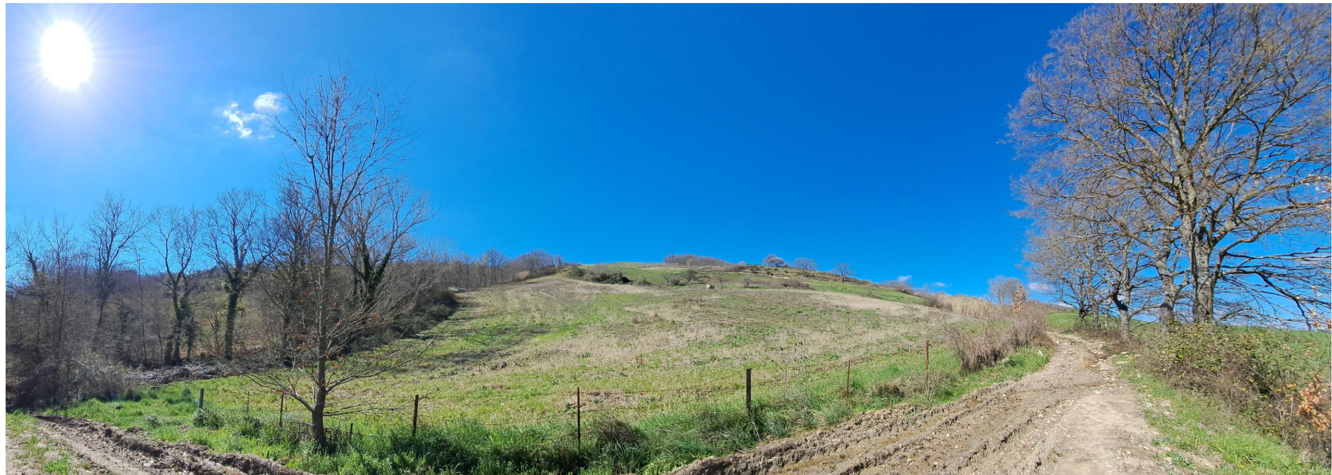
Scatto 6_ Vallone Lapilloso_Vista in direzione del Monte Vulture_ ANTE OPERAM=POST OPERMA