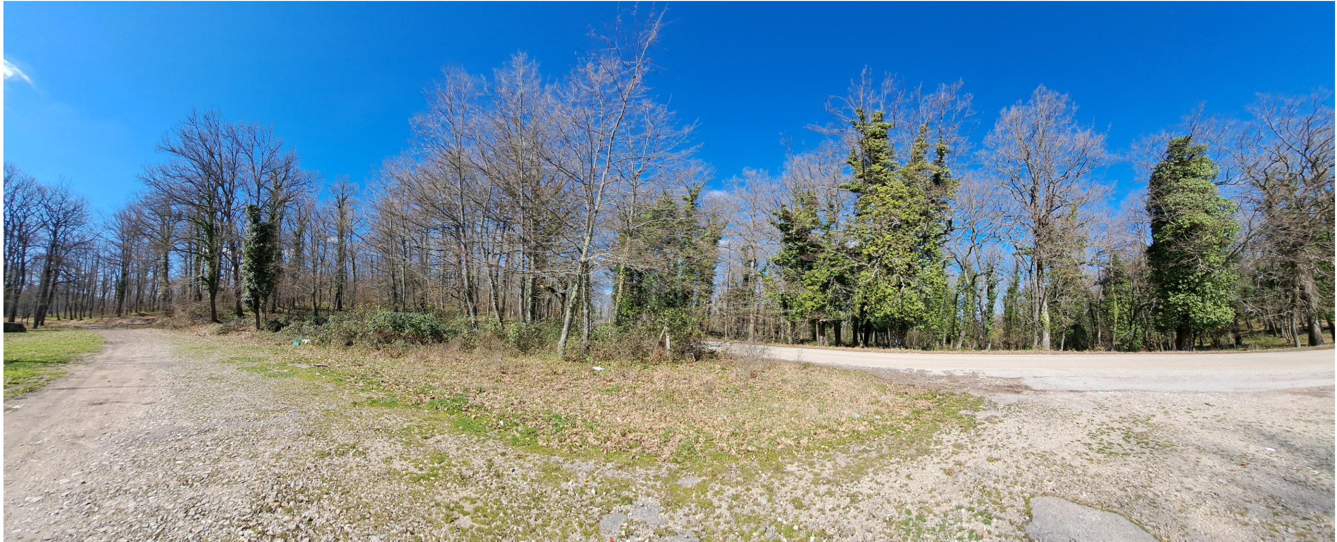
Scatto 9_ Vista S.P 8 in direzione del Monte Vulture_ ANTE OPERAM = POST OPERAM