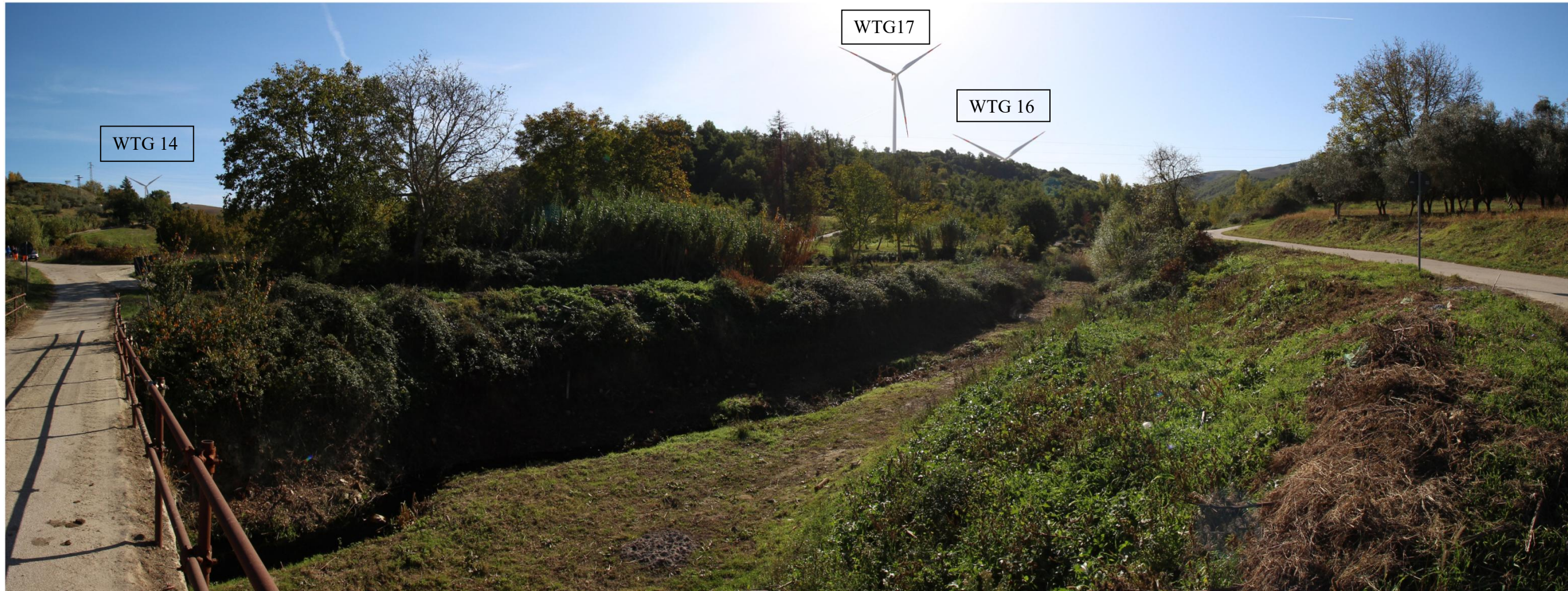
Scatto 4_ Vallone Cerasa, Fiumara dell'Arcidiano Vista POST OPERAM