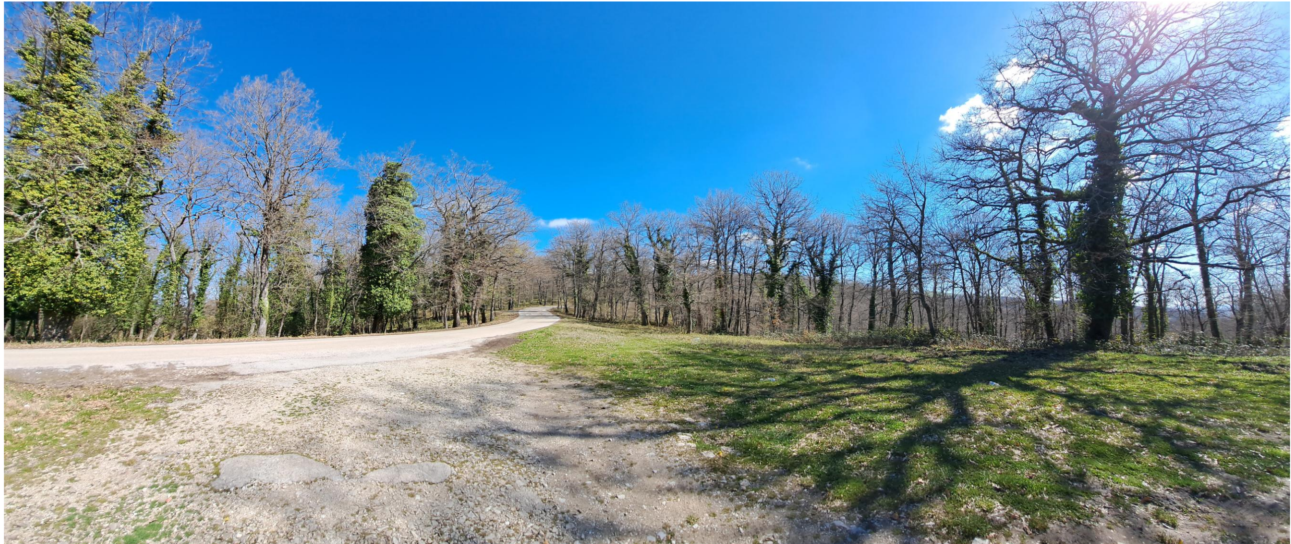
Scatto 8_ Vista ANTE OPERAM dalla S.P 8 in direzione di Maschito