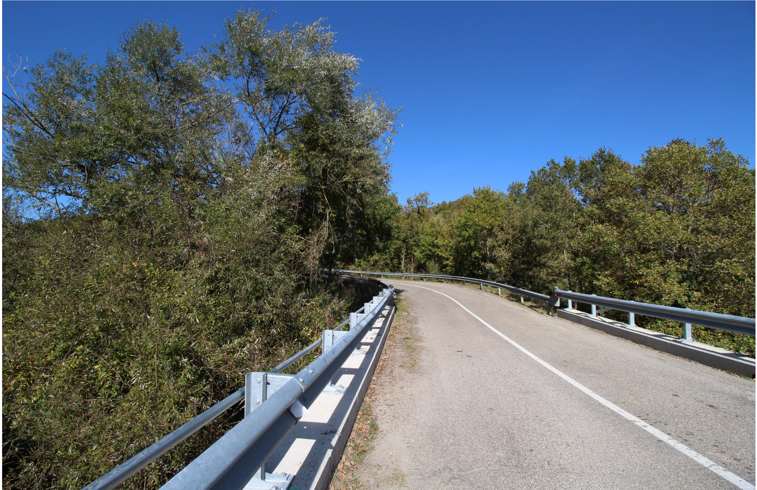
Scatto 2_Vista ANTE OPERAM in direzione di Maschito dal Torrente Fiumarella