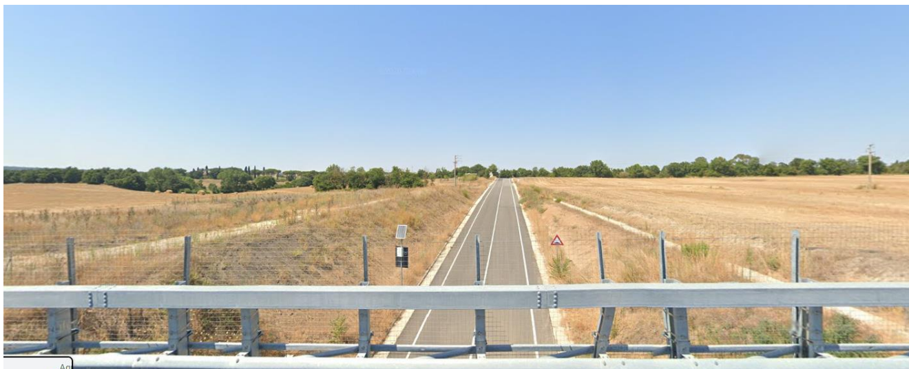
Foto 6 Vista terreni Tassoni lato sinistro SS675 direzione Vetralla (Foto 6)