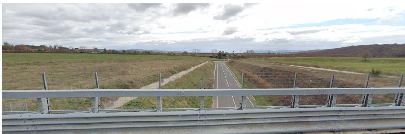
Foto 5 Vista terreni Tassoni lato destro SS675 direzione Vetralla (Foto 5)