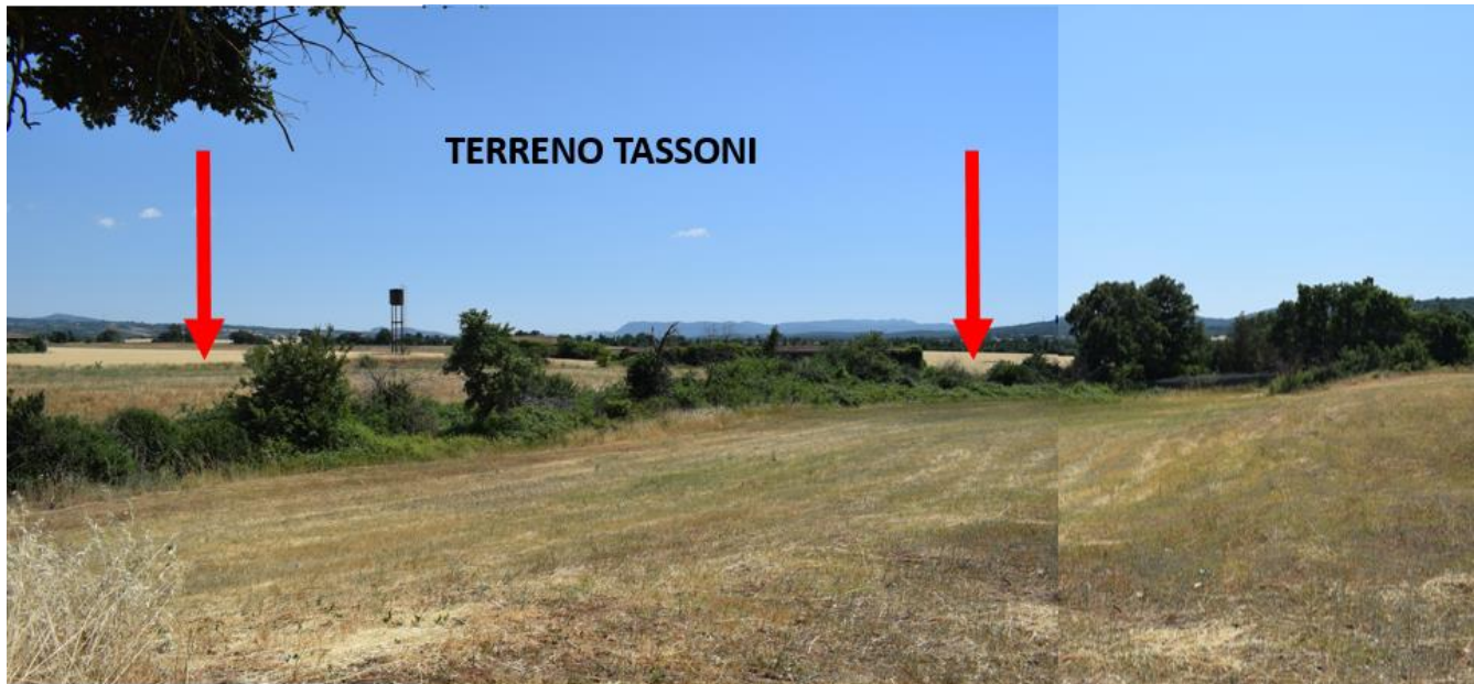
Foto 12 Panoramica terreno proprietà TASSONI dai terreni confinanti