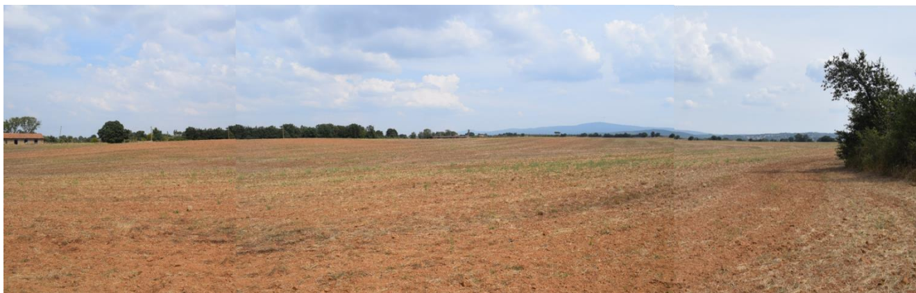
Foto 3 Panoramica terreno proprietà TASSONI ex cava e terreni agricoli contermini (Foto 3)

Regione Lazio – Provincia VITERBO – Comune VETRALLA Loc. CINELLI (Casale Gabriella)