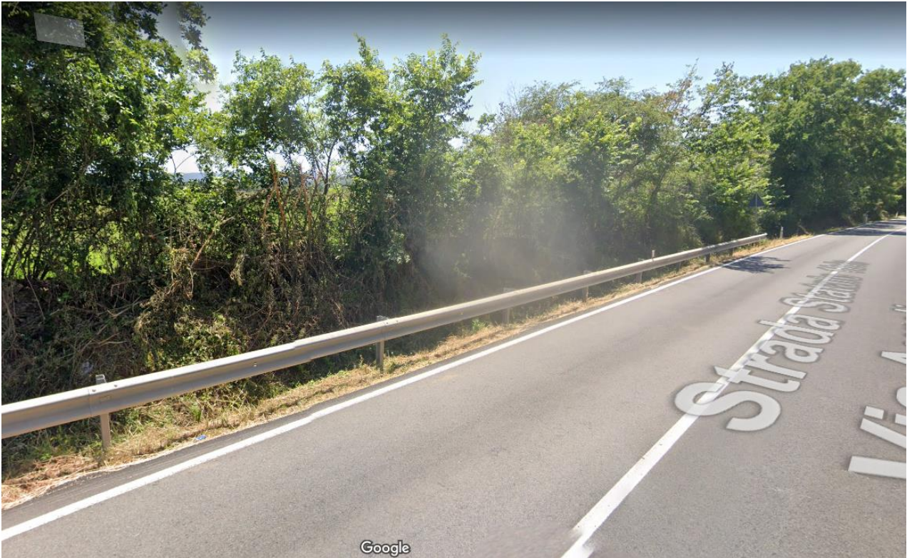
Foto 10 Vista terreni Tassoni lato sinistro direzione Monte Romano dalla SS Aurelia bis (Foto 9)