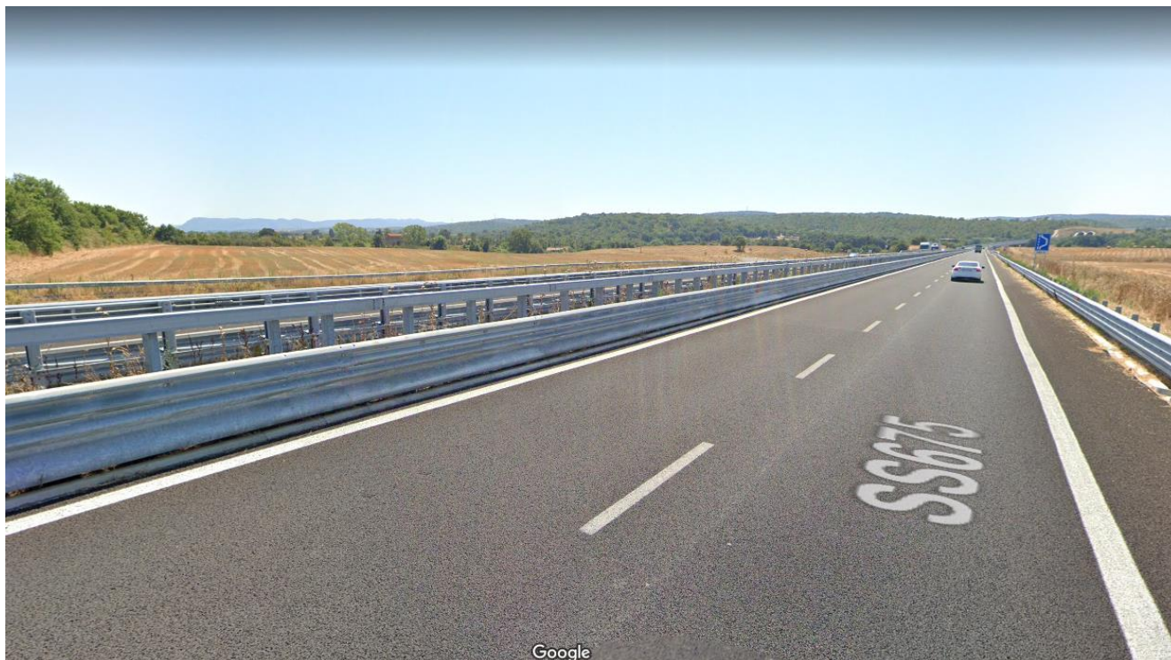
Foto 8 Vista terreni lato sinistro SS675 direzione Monte Romano (Foto 8)