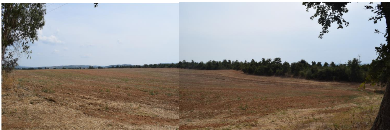
Foto 2 Panoramica terreno proprietà TASSONI ex cava e terreni agricoli contermini (Foto 2)