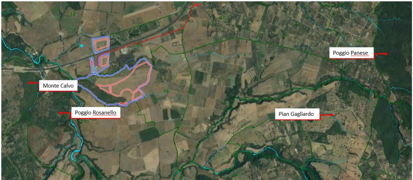
Figura 2 Inquadramento su area vasta