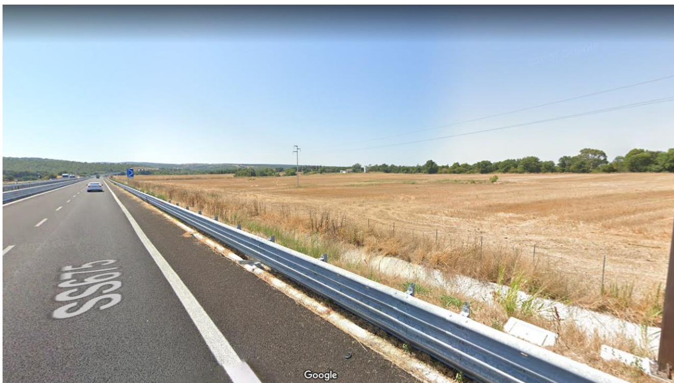
Foto 7 Vista terreni lato destro SS675 direzione Monte Romano (Foto 7)