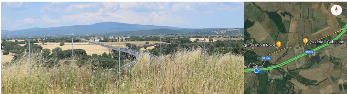
Foto 11 Panoramica terreno proprietà TASSONI da Monte Calvo SS 675