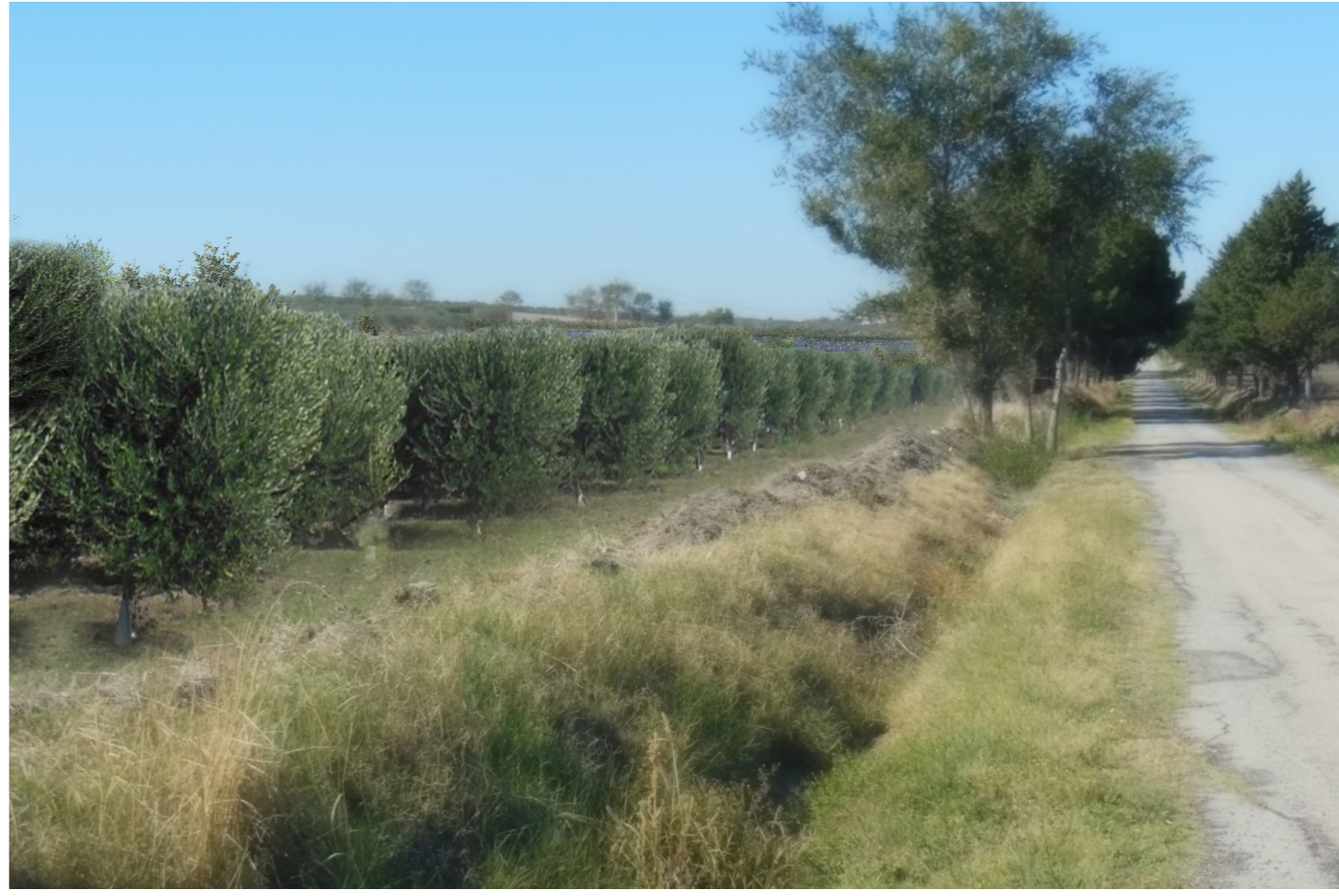
V2-VISTA RAVVICINATA CAMPO 2