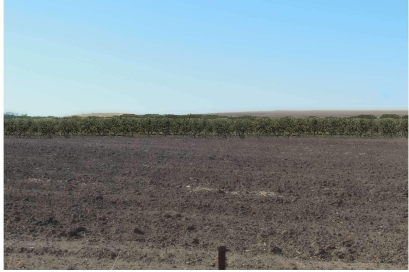
V10- VISTA DAL BENE 4-VERIFICA CON FOTOINSERIMENTO