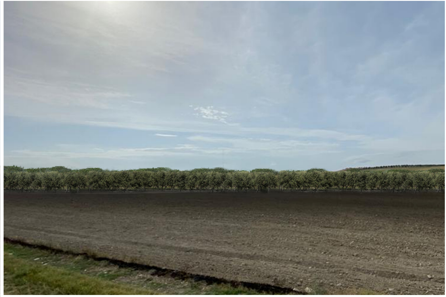
V1-VISTA RAVVICINATA CAMPO 1