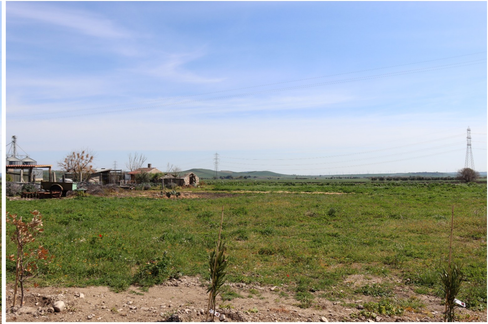
V5-VISTA DAI BENI 2 E 3-VERIFICA CON FOTOINSERIMENTO