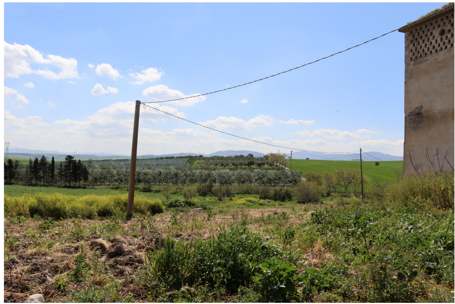
V11- VISTA DAL BENE 5-VERIFICA CON FOTOINSERIMENTO