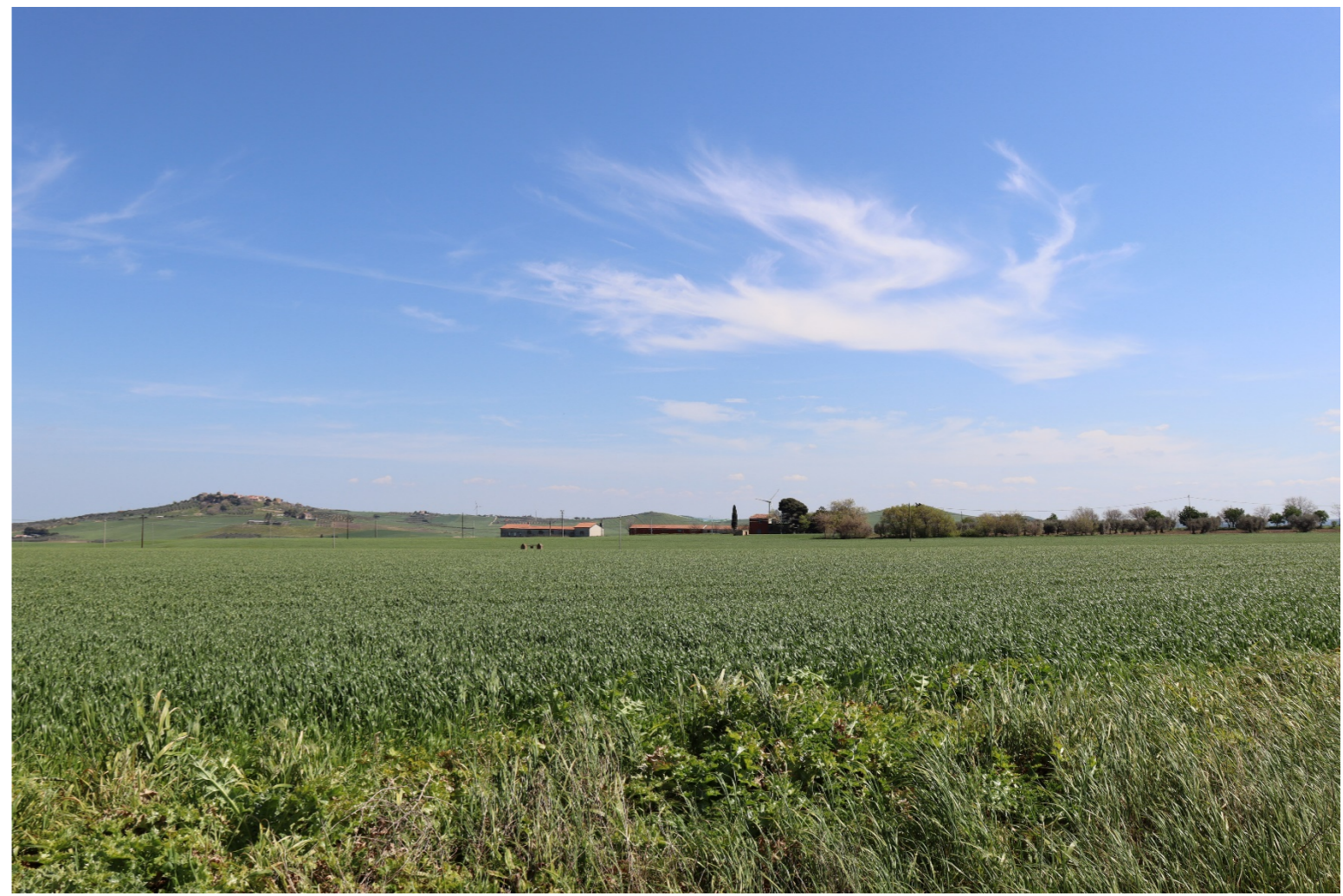
V6- VISTA DAI BENI 33 E 34-VERIFICA CON FOTOINSERIMENTO