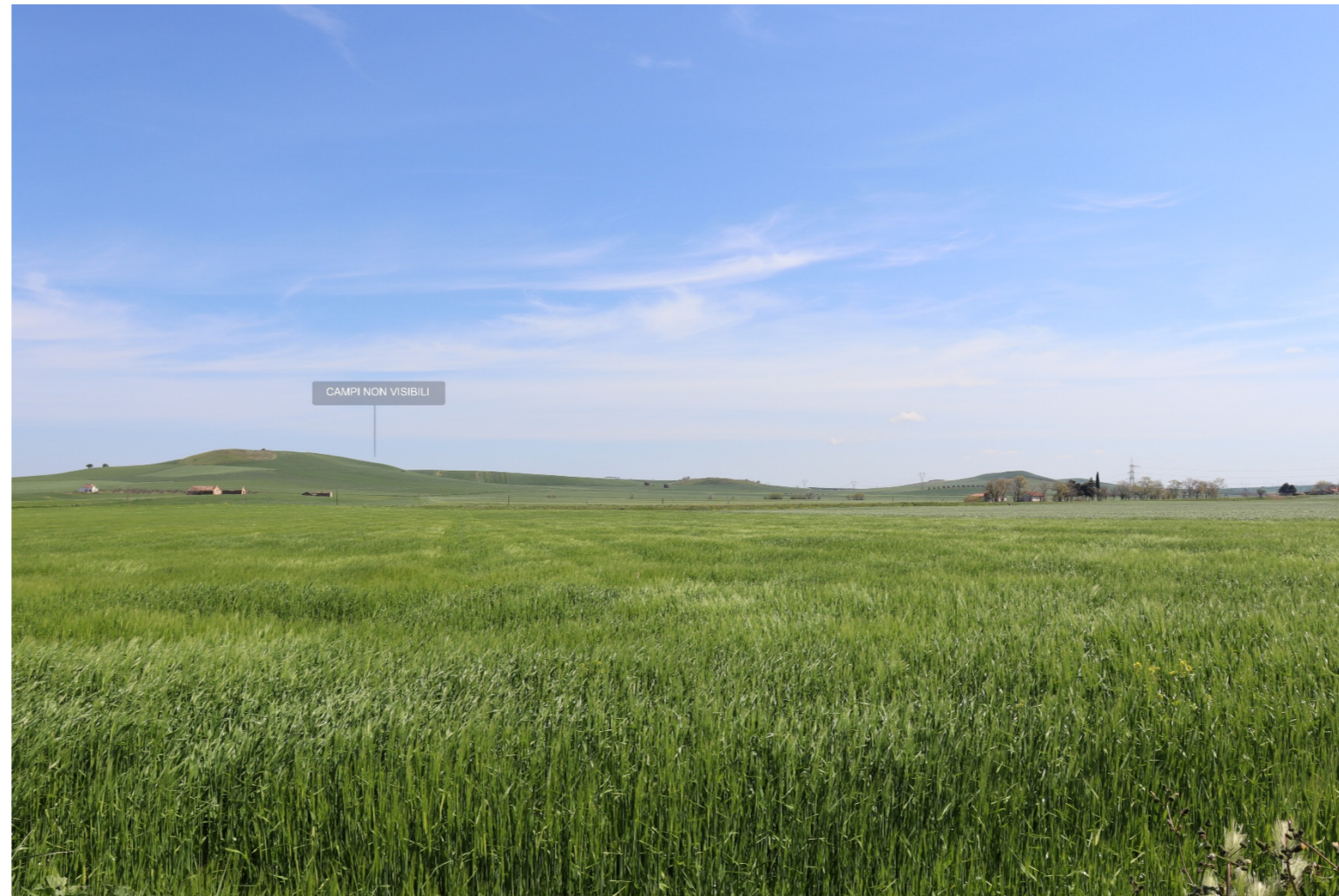
V4-FOTO DA BENE 1-CAMPI NON VISIBILI