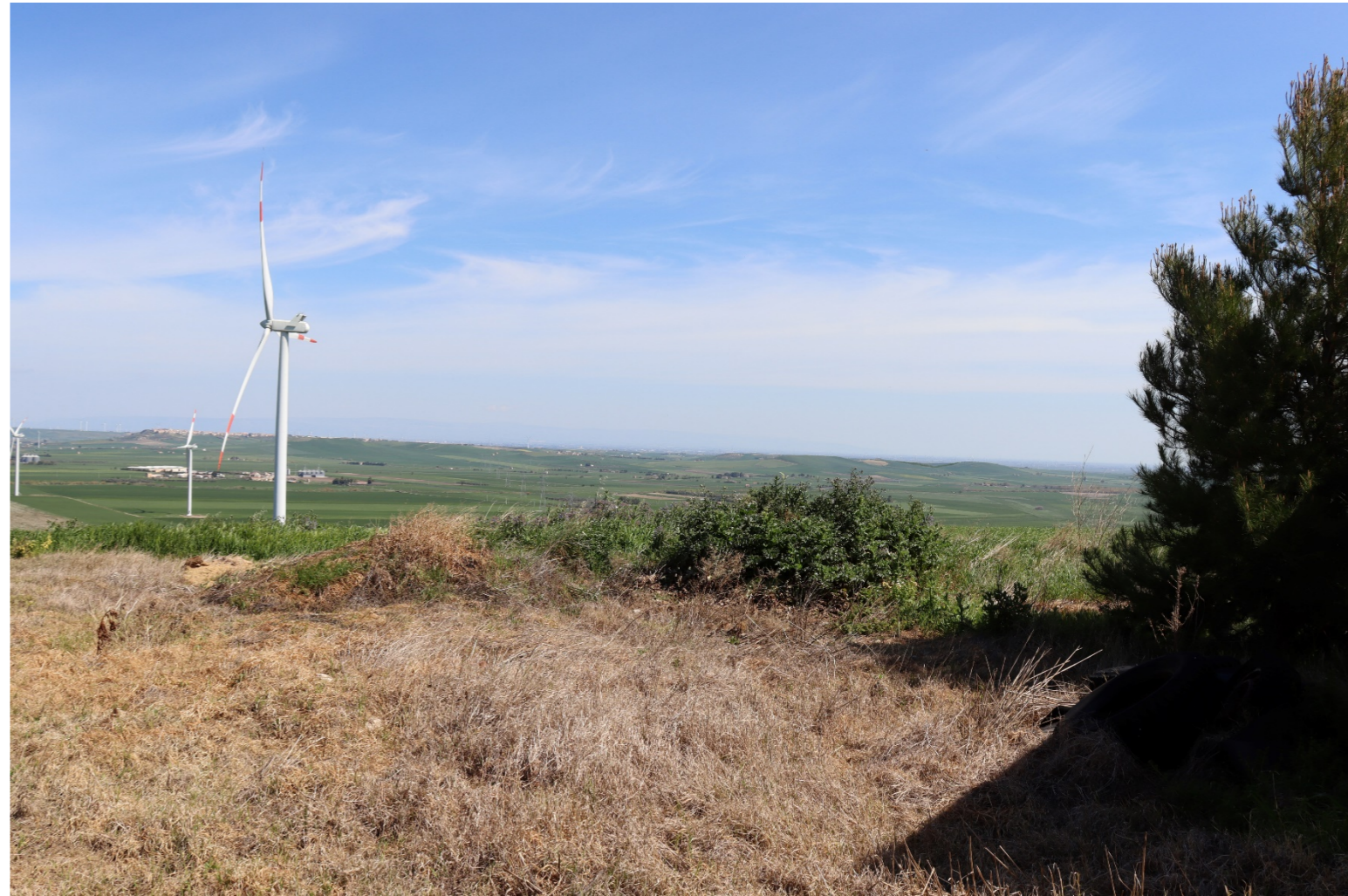
V8-VISTA DAL BENE 37-VERIFICA CON FOTOINSERIMENTO