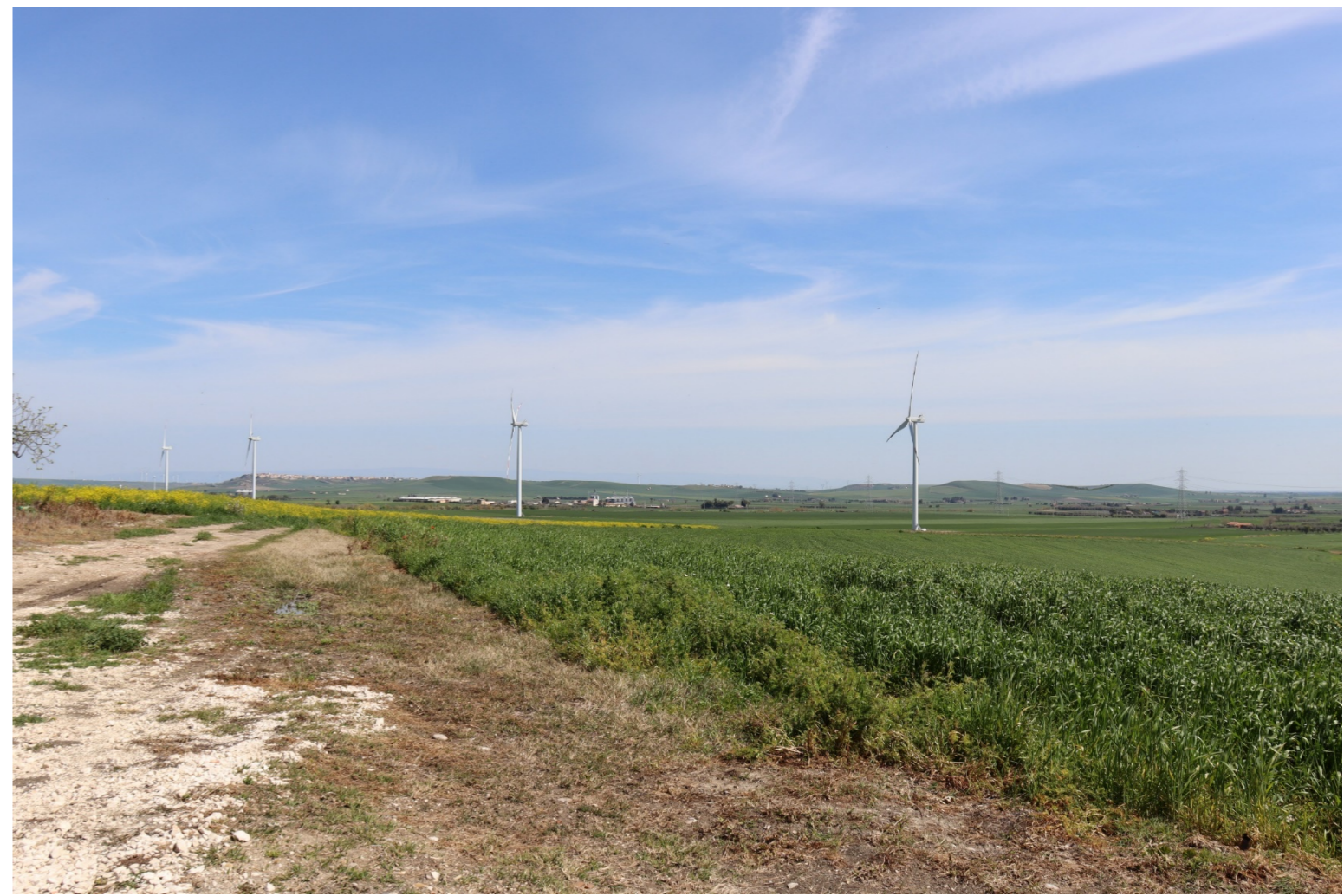
V9 VISTA DAL BENE 38-VERIFICA CON FOTOINSERIMENTO