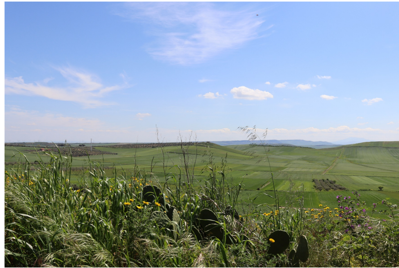
V14-VISTA DAL TRATTURO-SP110-VERIFICA CON FOTOINSERIMENTO