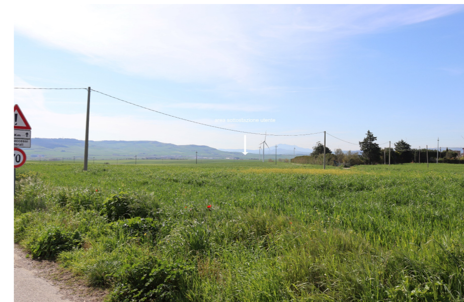
V3-VISTA DAI BENI 31-32-19-28