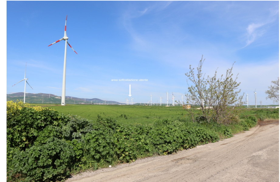
V1-VISTA DAI BENI 22-23