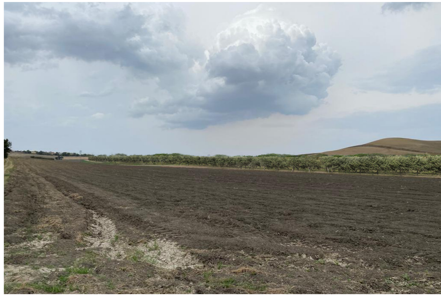
V3-VISTA RAVVICINATA CAMPO 3