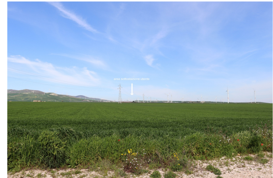
V2-VISTA DAI BENI 25-30