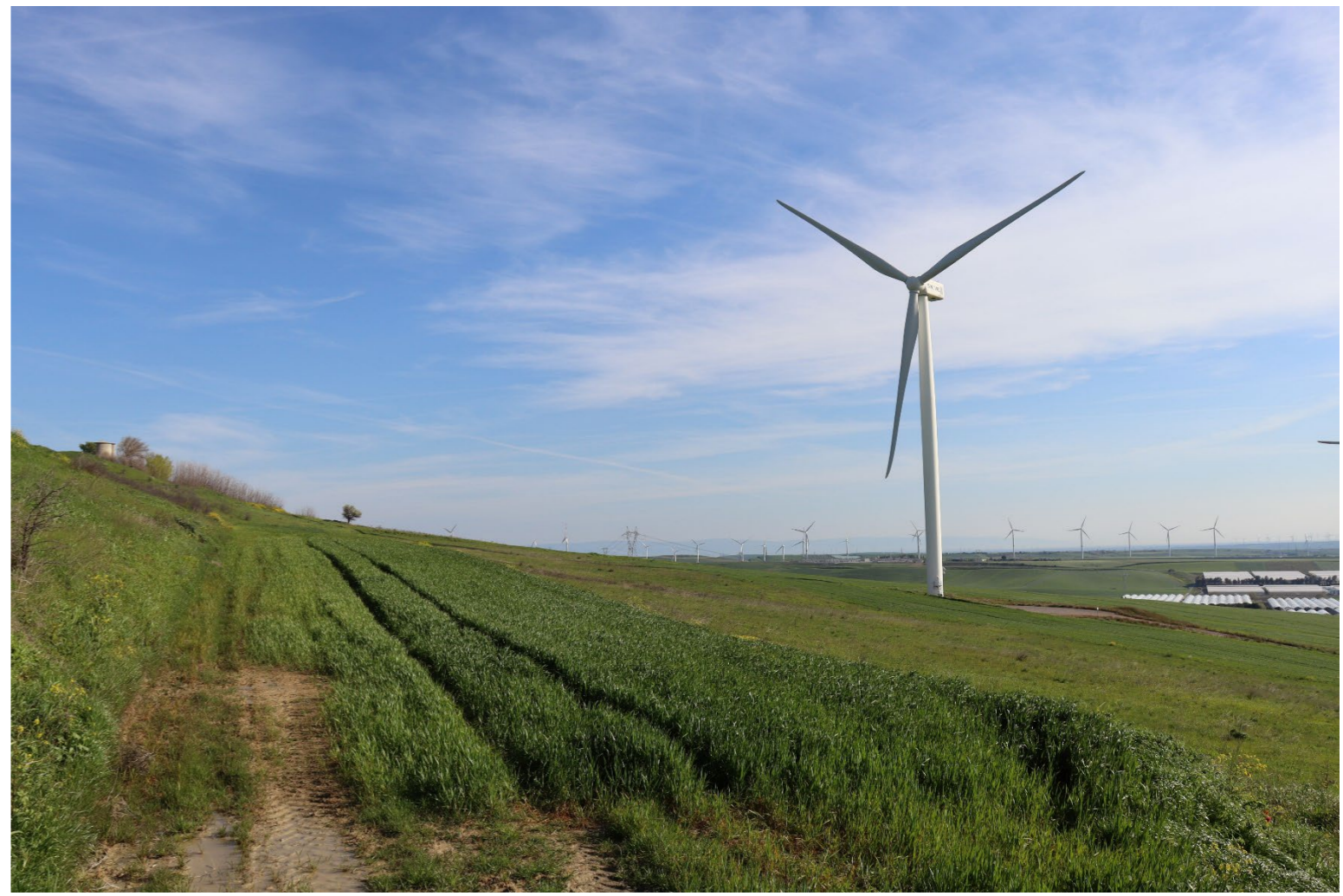
V5- VISTA DAL BENE 26 - VERIFICA CON FOTOINSERIMENTO