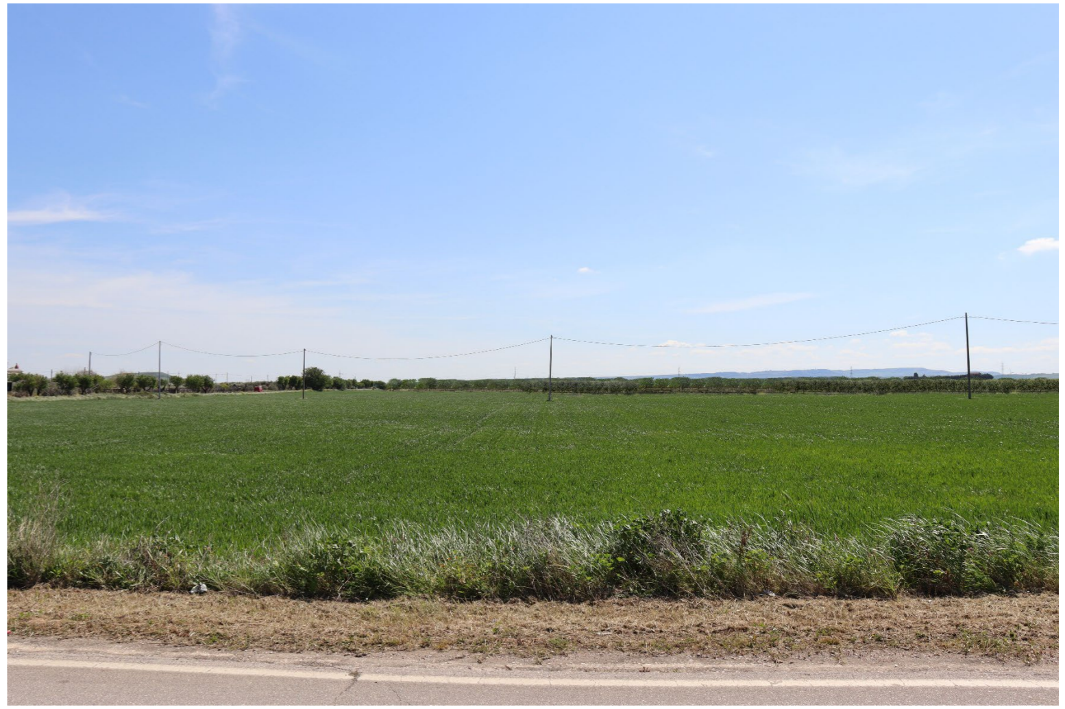
V4-VISTA DAL BENE 1 - VERIFICA CON FOTOINSERIMENTO