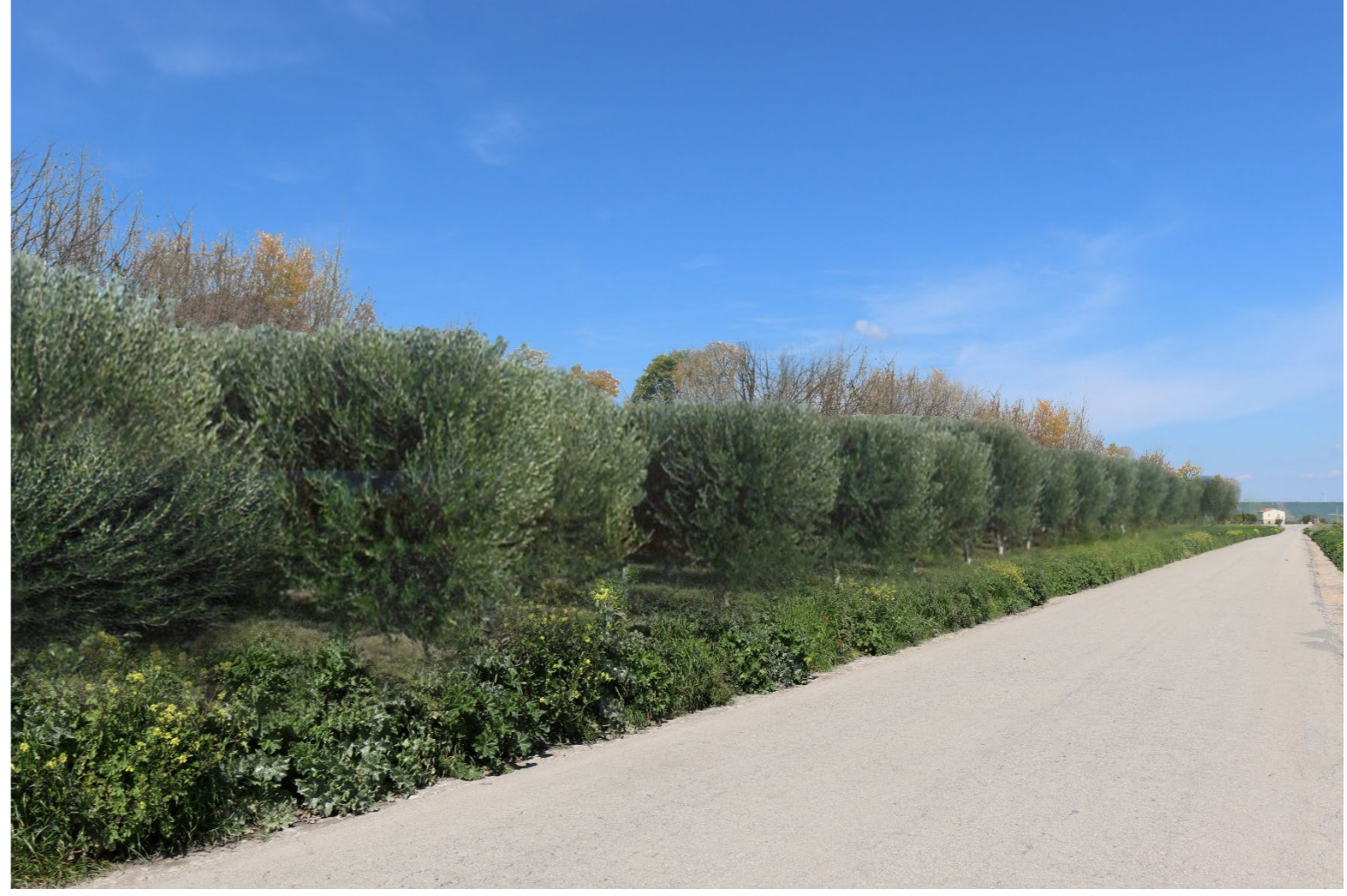
V1-VISTA RAVVICINATA CAMPO 1