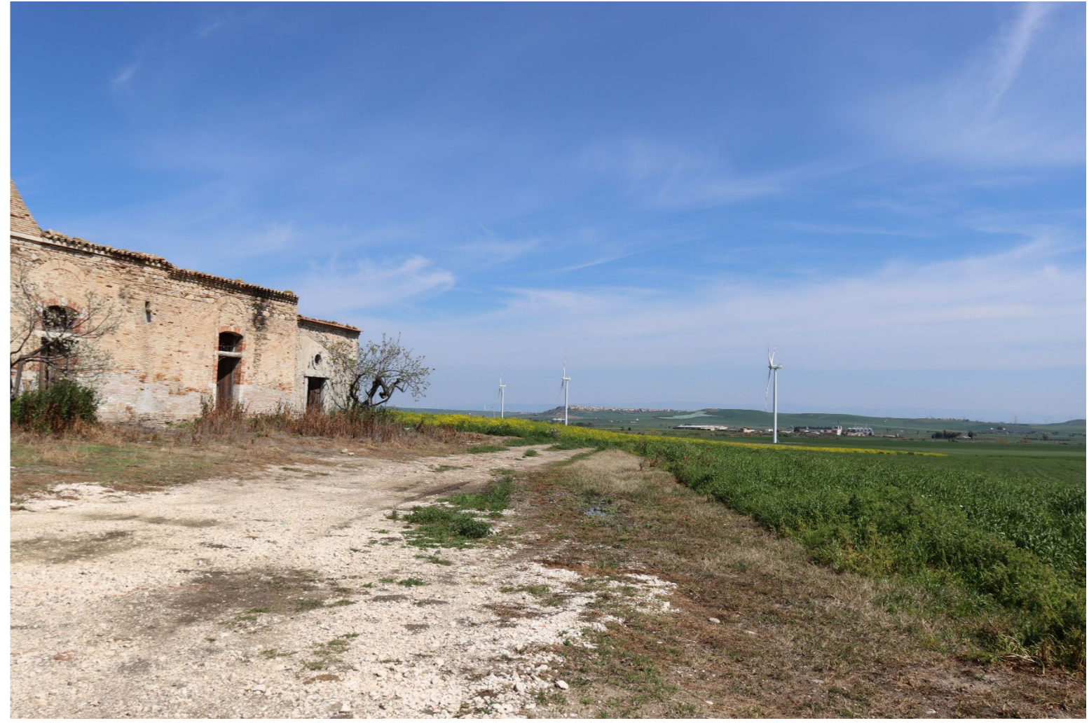
V7 VISTA DAL BENE 38-VERIFICA CON FOTOINSERIMENTO