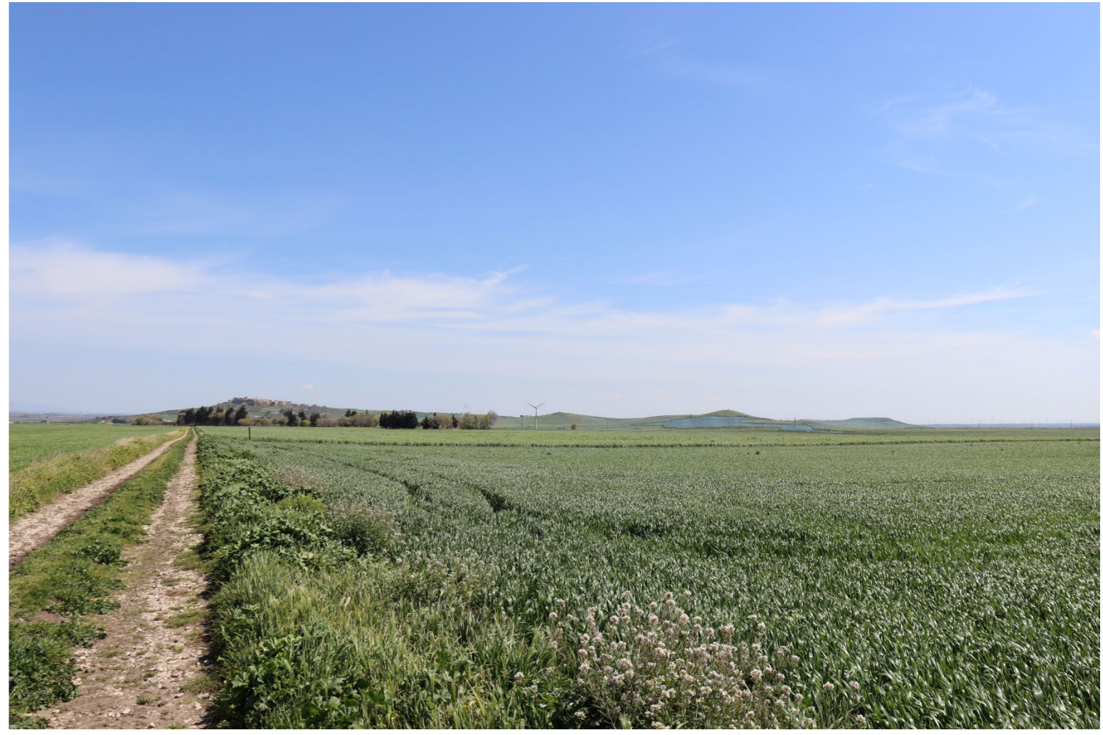
V6-VISTA DAL BENE 35-VERIFICA CON FOTOINSERIMENTO