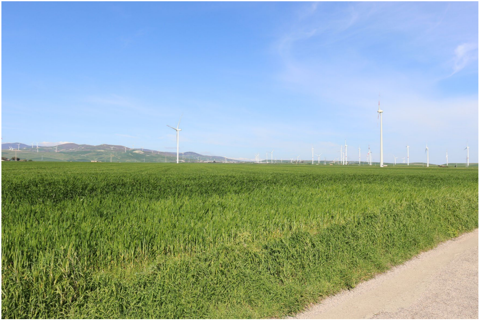
V2-VISTA DAI BENI 22 23- VERIFICA CON FOTOINSERIMENTO