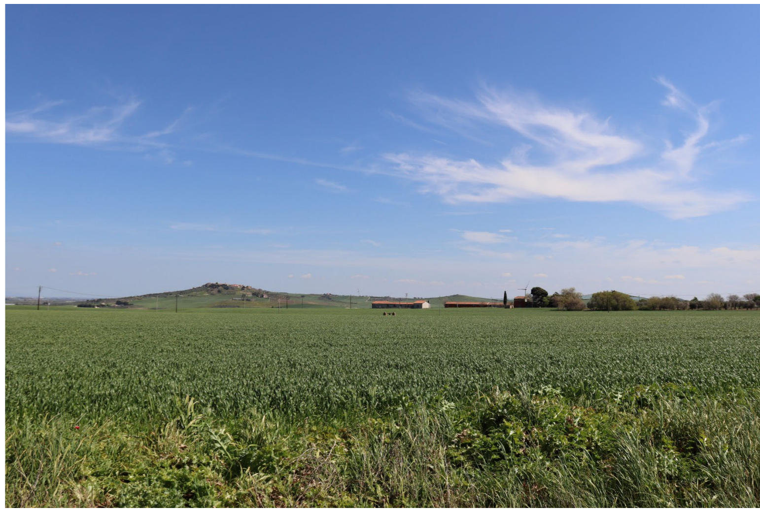
V3-VISTA DAI BENI 33 E 34 - VERIFICA CON FOTOINSERIMENTO