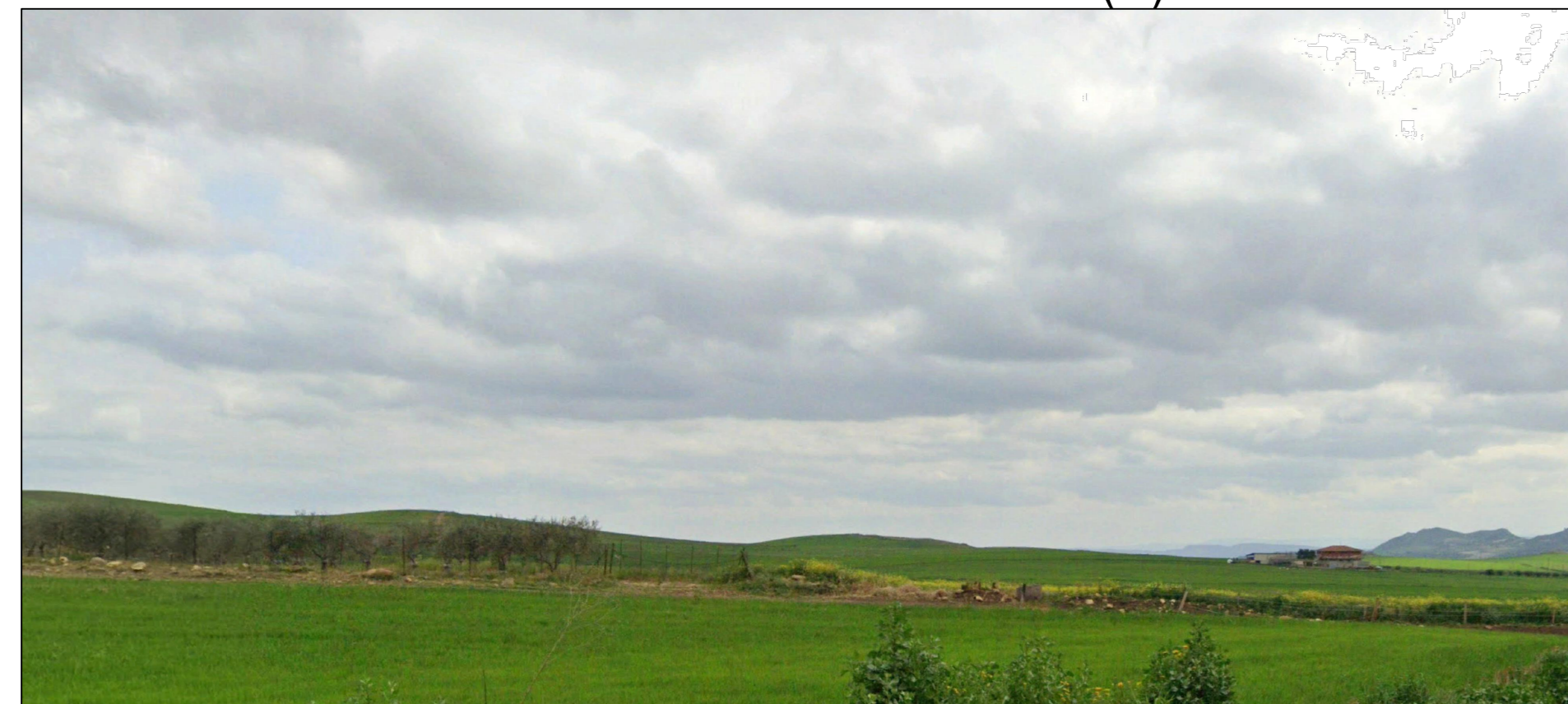
Punto B2 intervisibilità Strada Provinciale N.288 (N) - Stato di fatto