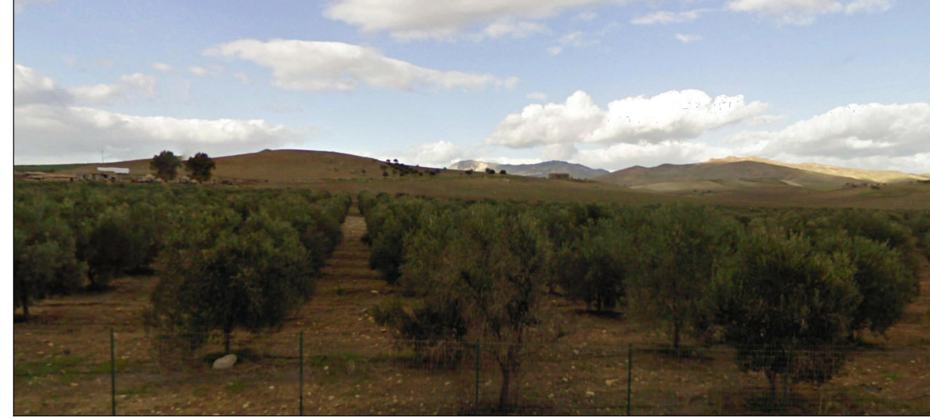
Punto B3 intervisibilità Strada Provinciale N.112 - Stato di Fatto