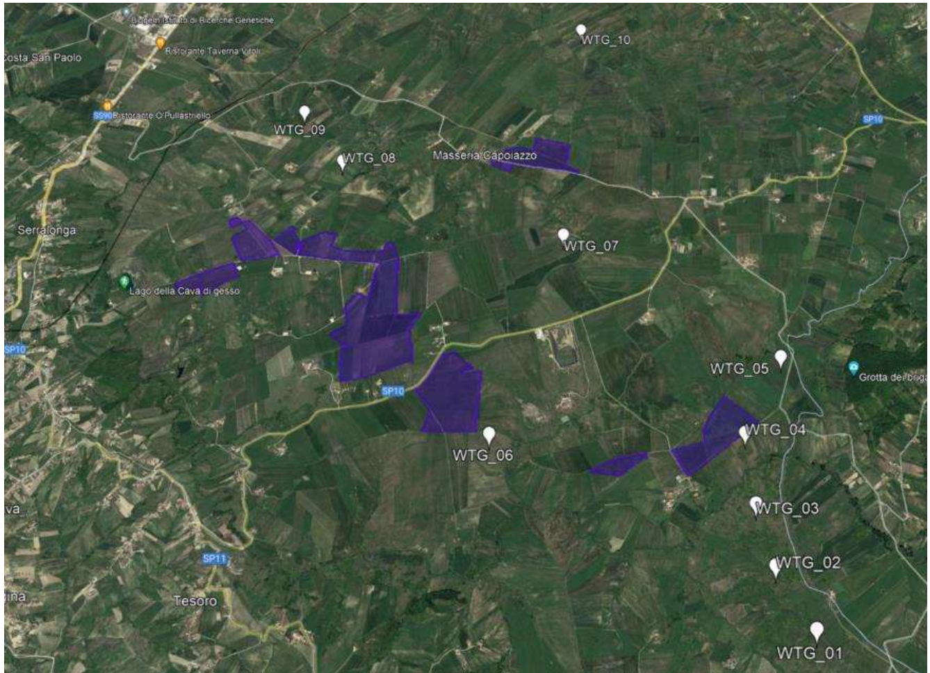
Figura 1: inquadramento impianto agrivoltaico (Proponente) e stralcio di impianto eolico (Scrivente)

Di seguito degli stralci in cui si evidenzia l'area individuata per il progetto dell'impianto agrivoltaico e la posizione degli aerogeneratori presentati in V.I.A. dalla Scrivente.