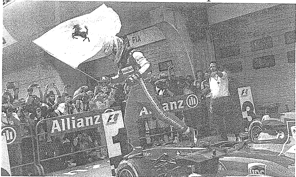
Fernando Alonso esulta al termine del Gp di Cina sventolando una bandiera del Cavallino rampante