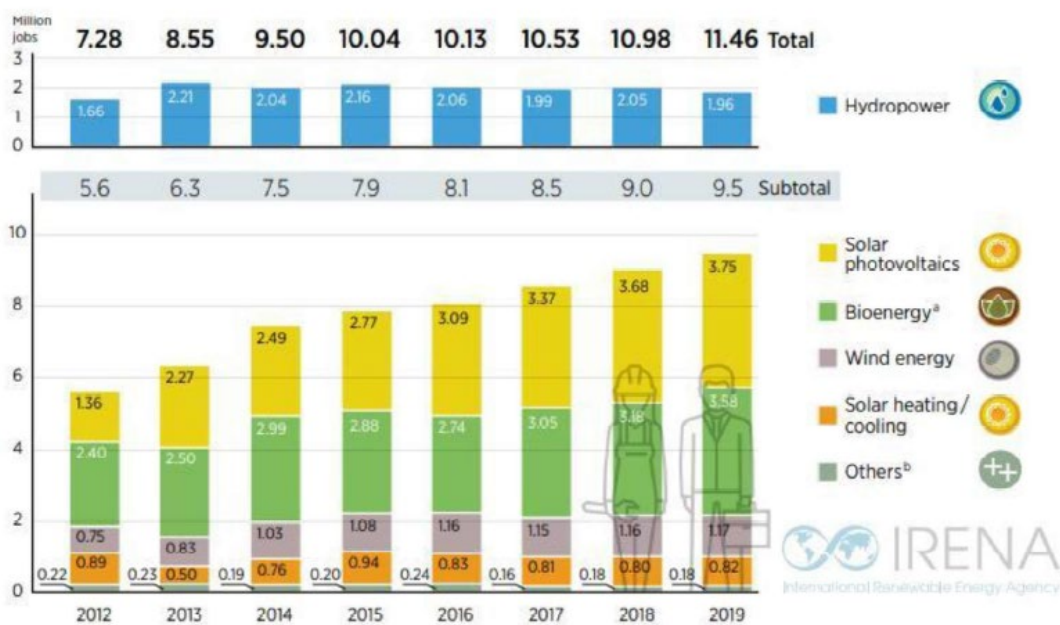
Figura1: Dati occupazionali nel settore rinnovabile negli ultimi anni

L'industria del solare fotovoltaico mantiene il primo posto, con il 33% della forza lavoro totale delle energie rinnovabili. Nel 2019, l'87% dell'occupazione globale nel fotovoltaico si è concentrato nei dieci paesi in testa distribuzione mondiale e nella produzione di attrezzature.