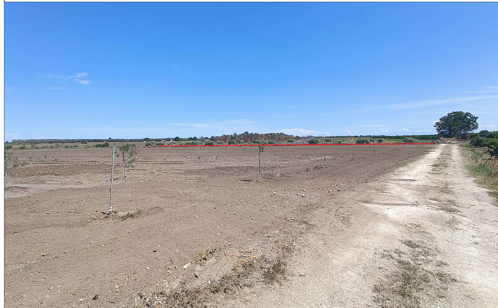
Vista 2 Ante Operam