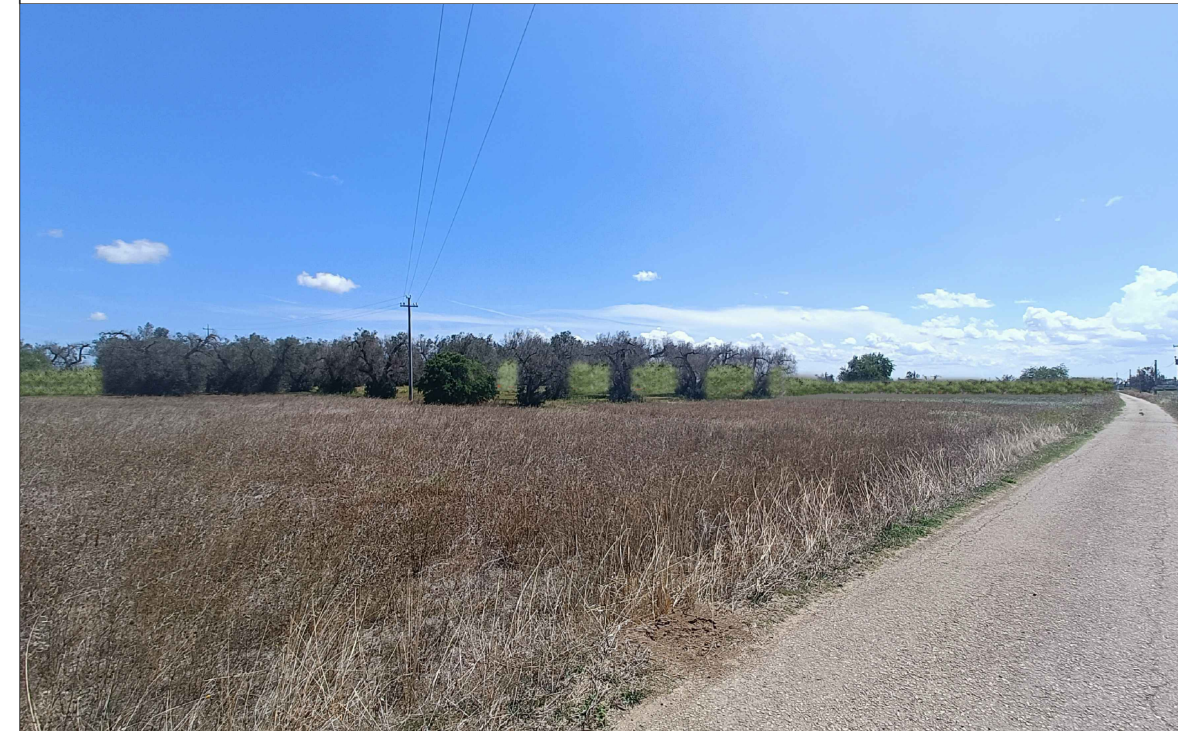
Vista 1 Post Operam - Mitigazione