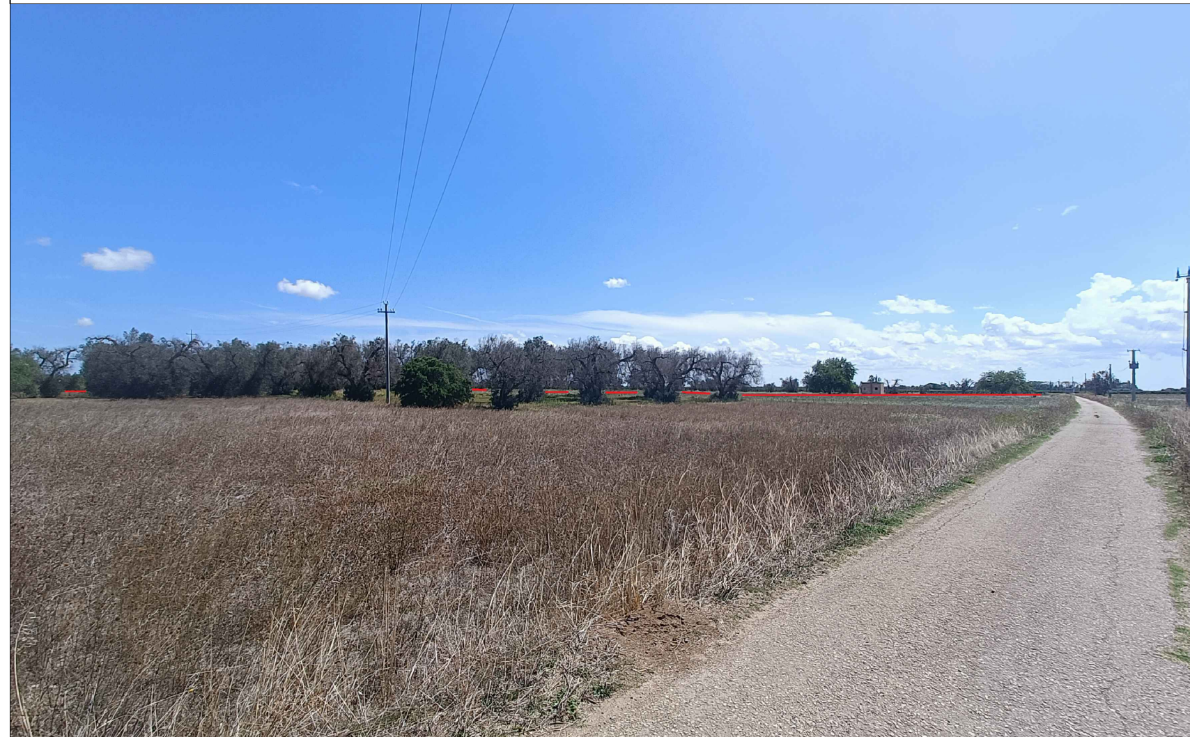
Vista 1 Ante Operam