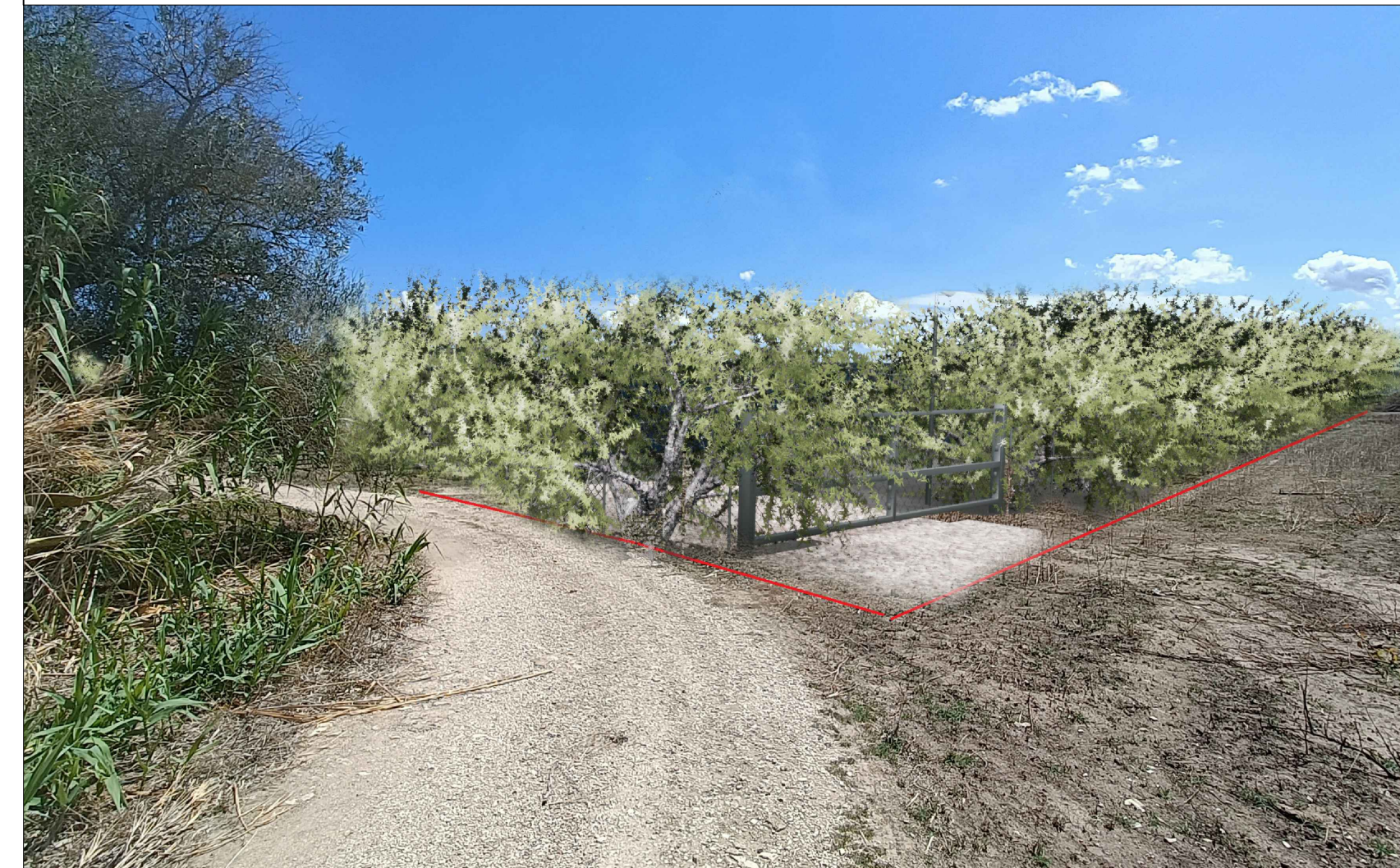
Vista 3 Post Operam