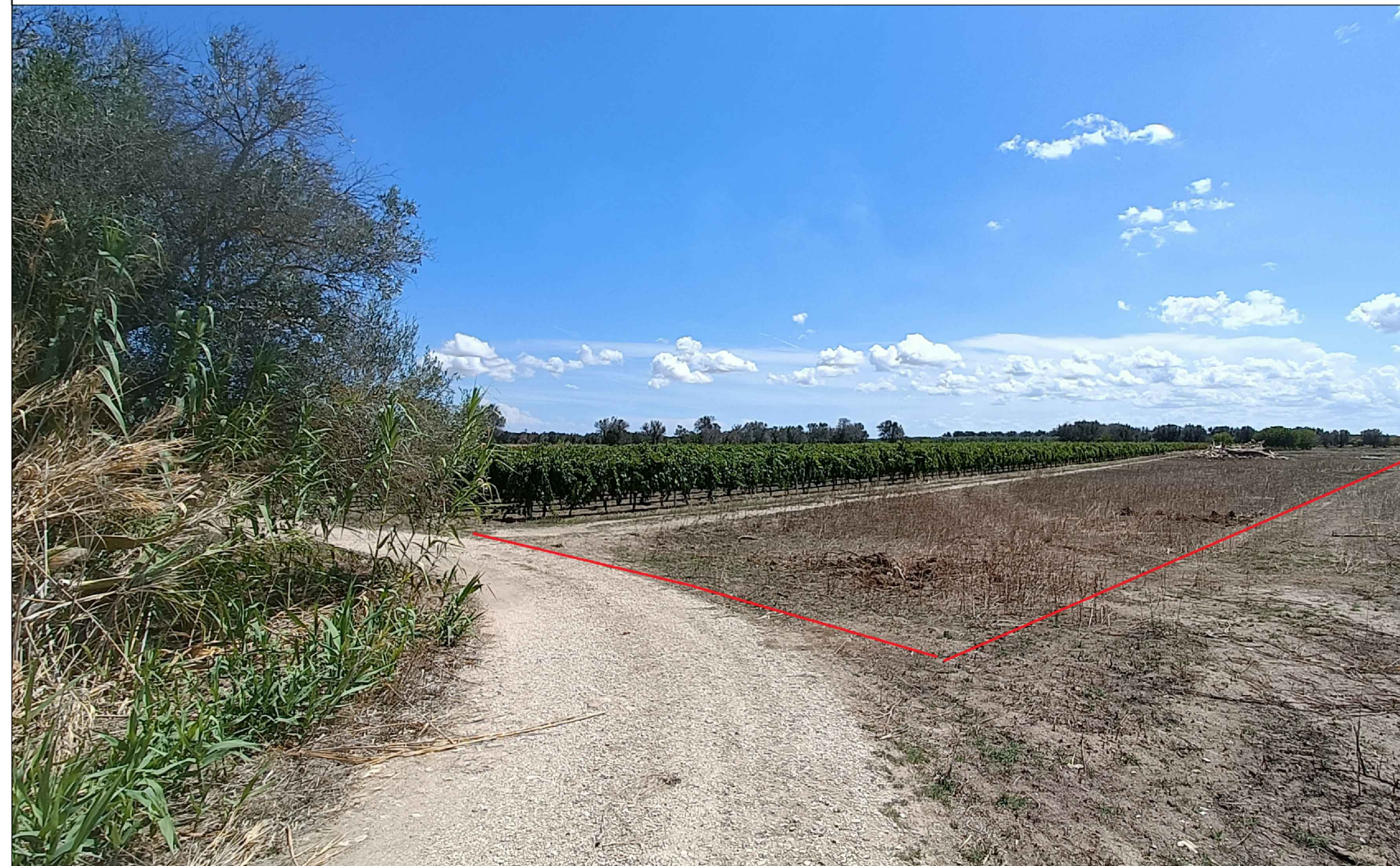
Vista 3 Ante Operam