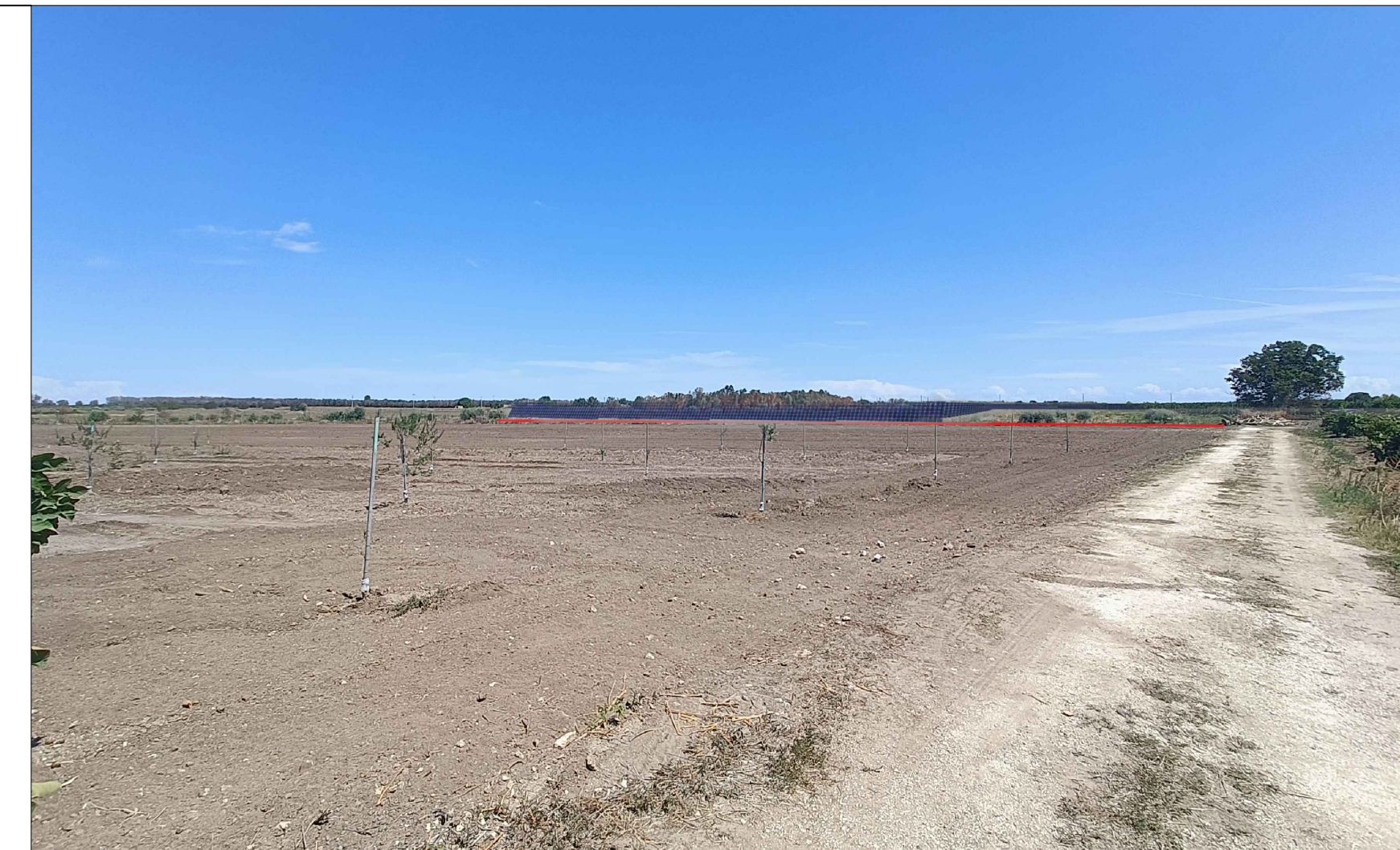
Vista 2 Post Operam - No Mitigazione