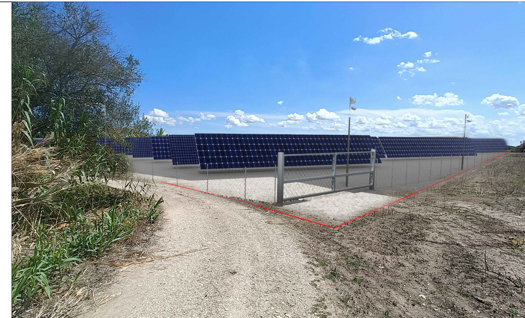
Vista 3 Post Operam - No Mitigazione