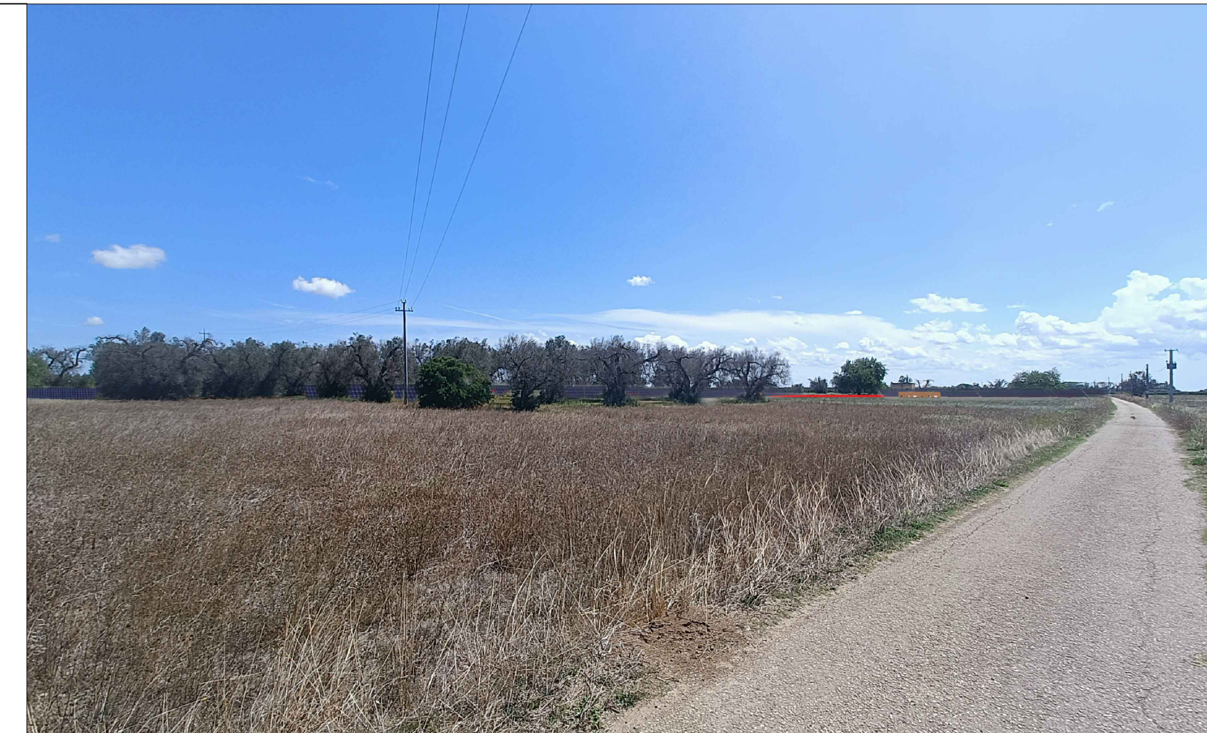
Vista 1 Post Operam - No Mitigazione