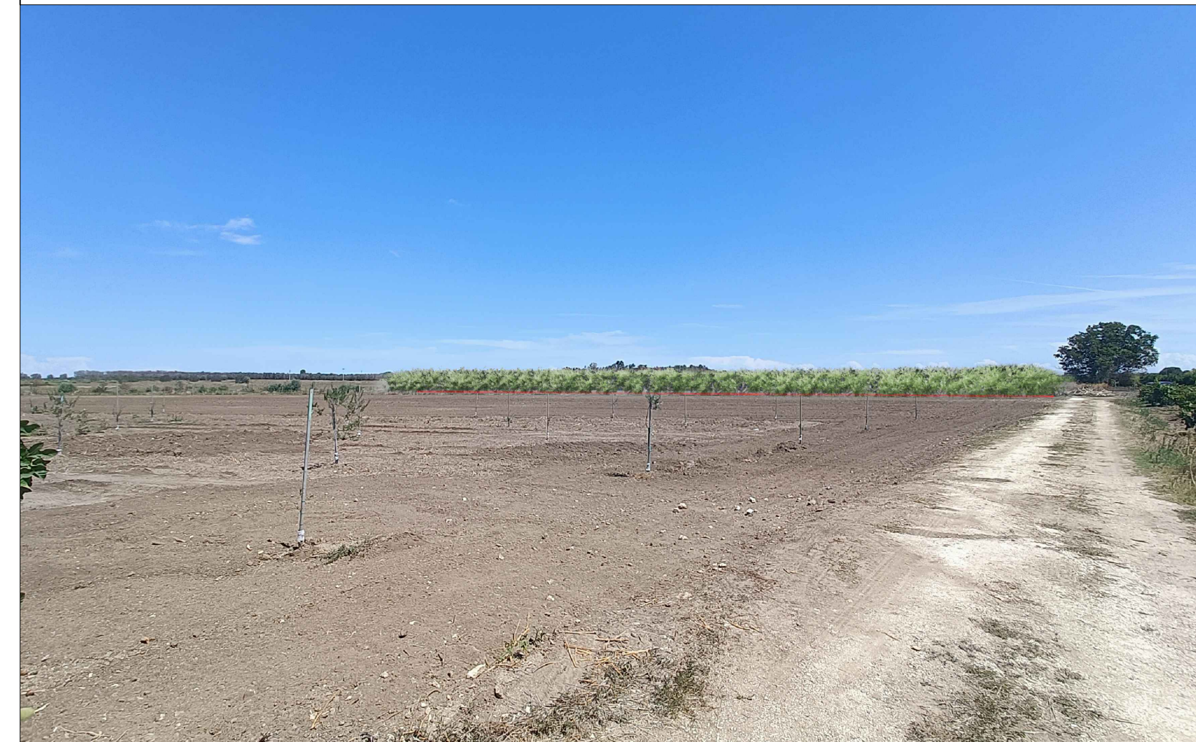
Vista 2 Post Operam - Mitigazione