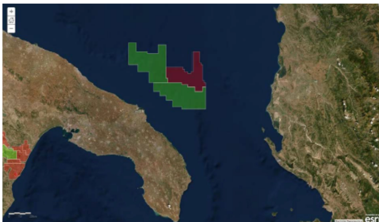
Figura 2 WebGIS UNMIG – Puglia