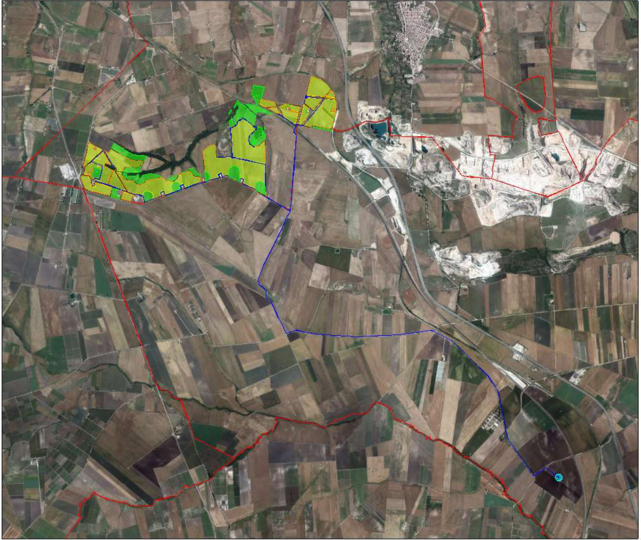
Figura 1: Inquadramento su ortofoto dell'impianto agrivoltaico e delle opere di connessione