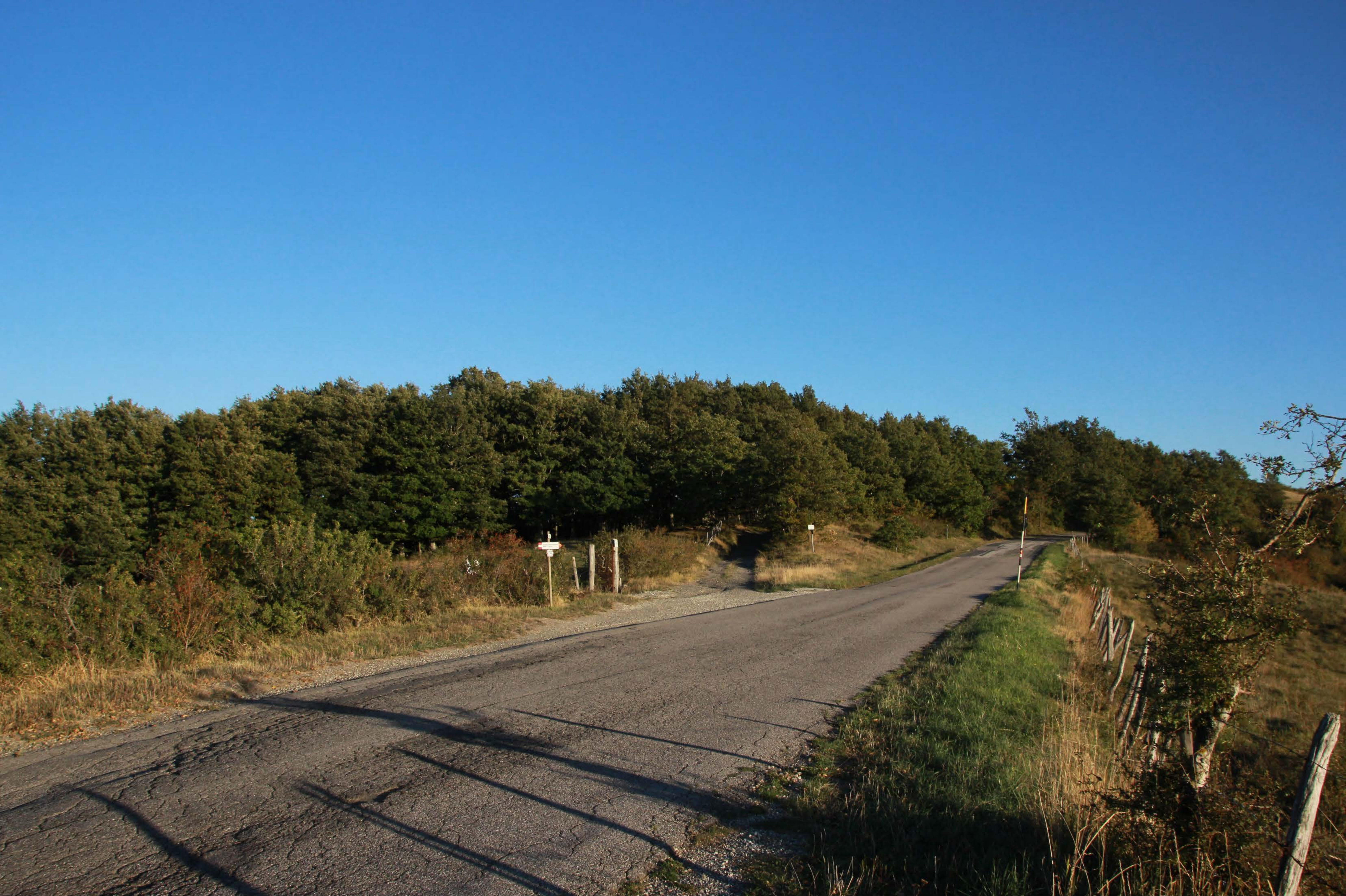
18_ SP 67 Località Torricella | ante intervento