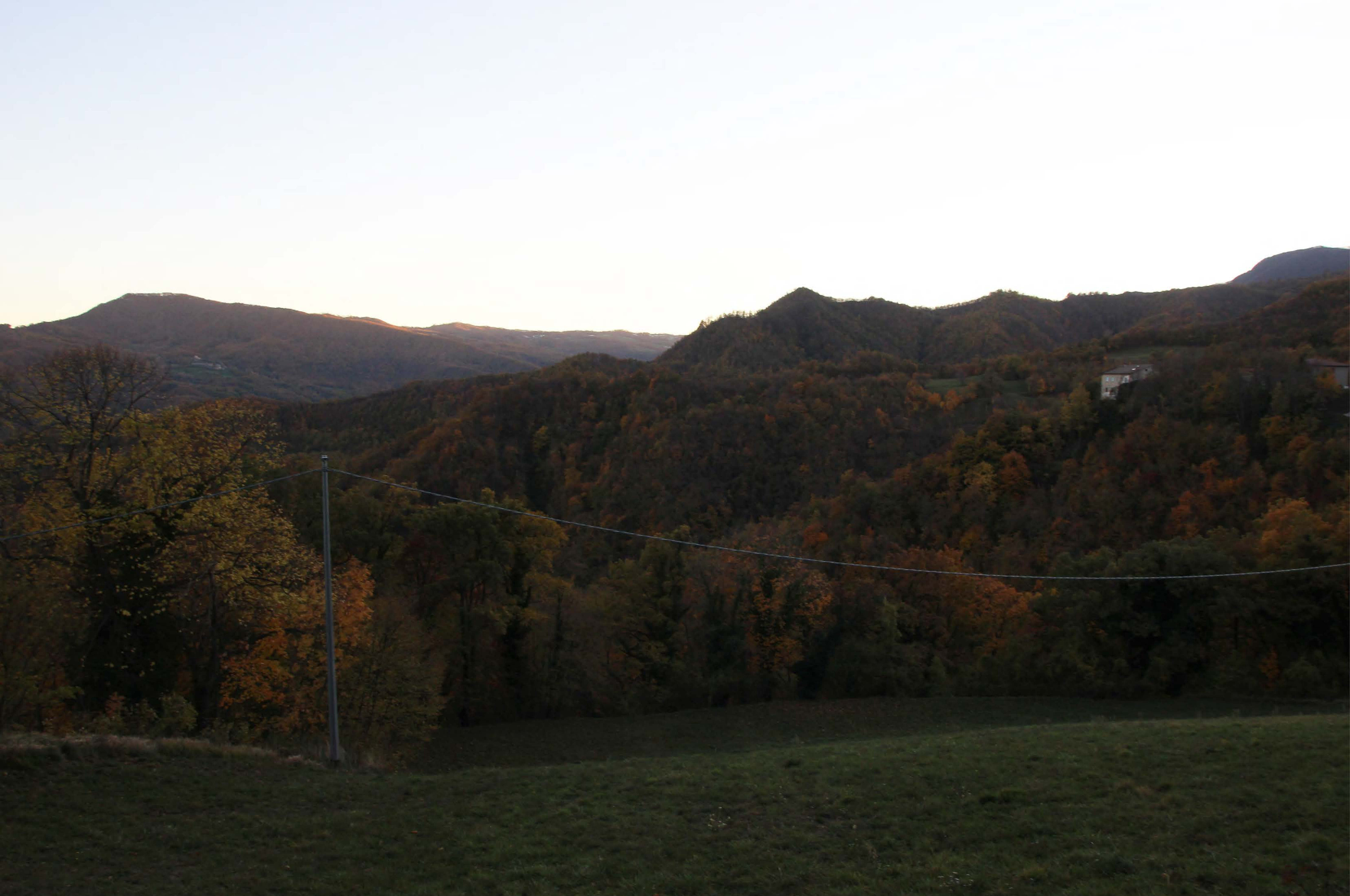
14 _ Località Fraghetoj| ante intervento