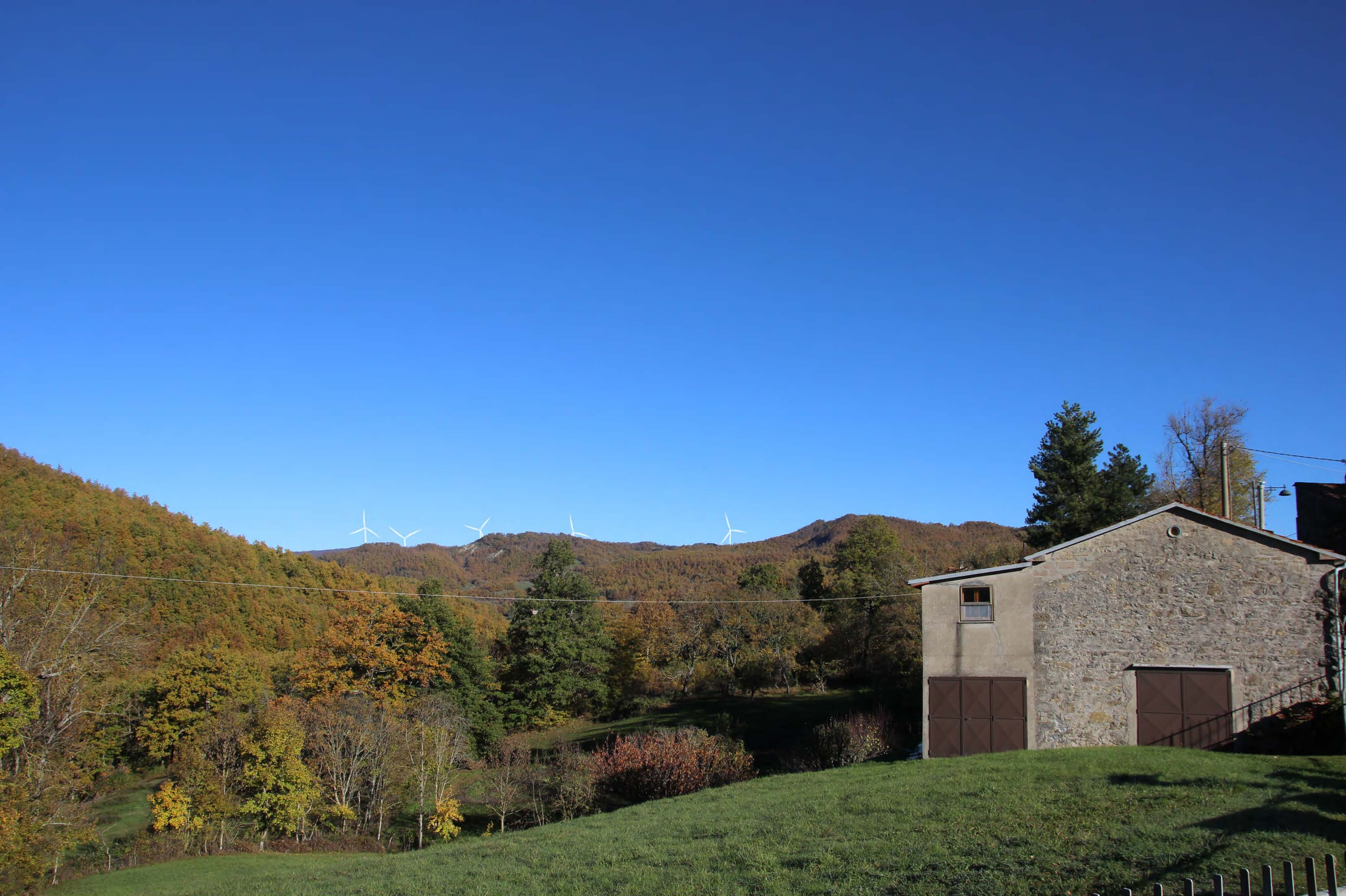
2 _ Arsicci | post intervento