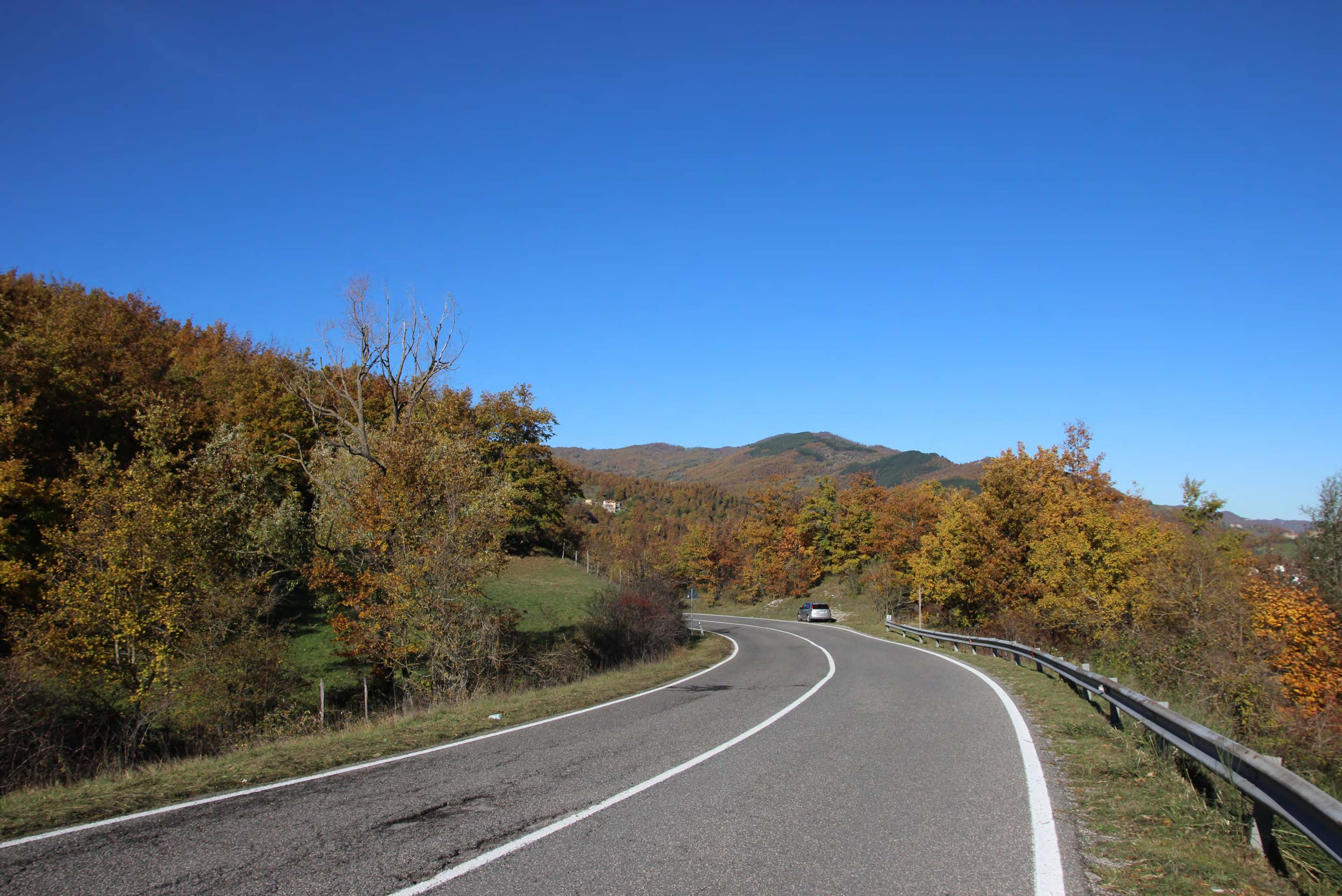
5_ SP Marecchia località Badia Tedalda | ante intervento