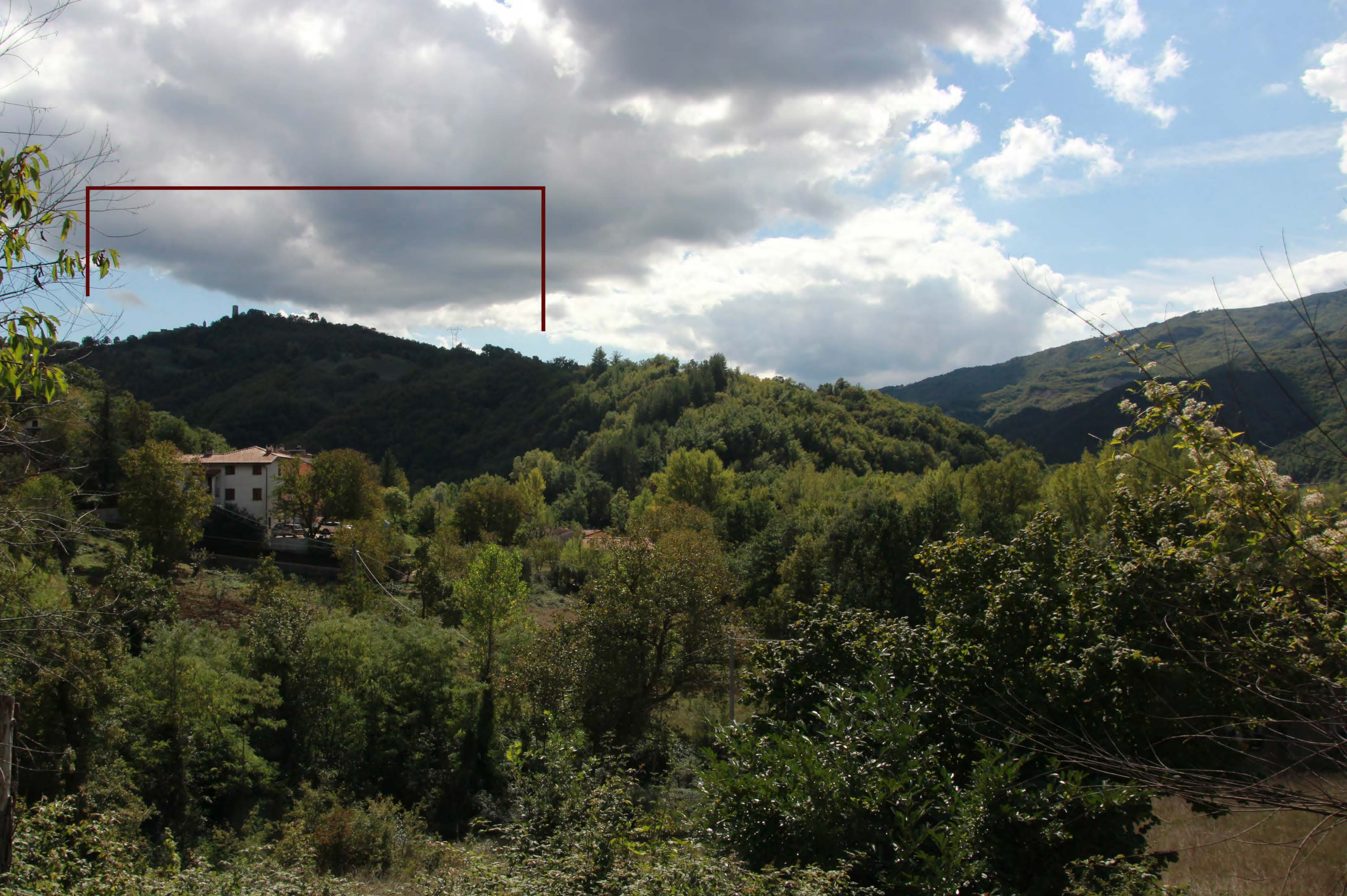
11 _ Cà Raffaello | post intervento | impianto non visibile