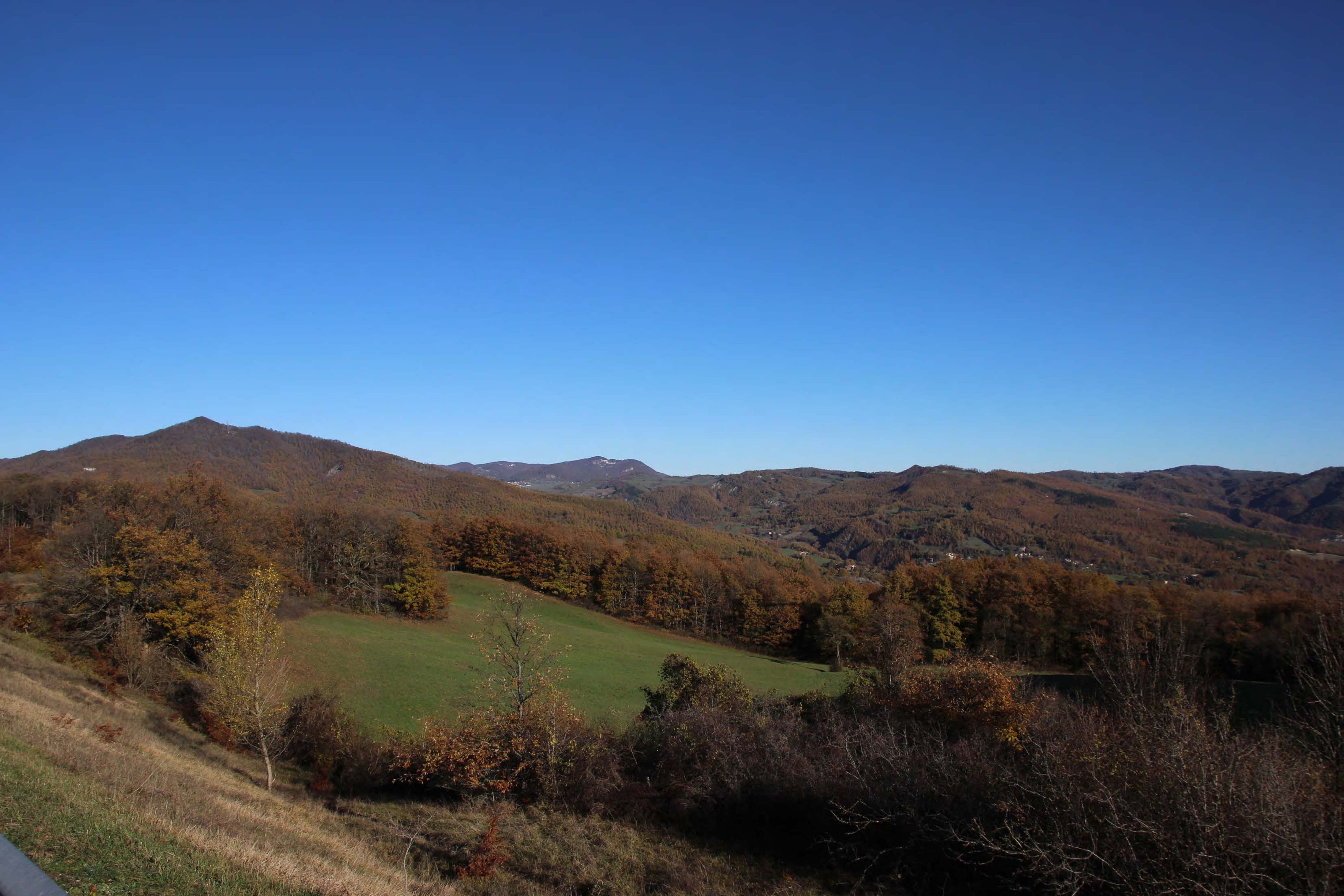
1_ SP Nuova Sestinese, località Passo di Frassineto | ante intervento