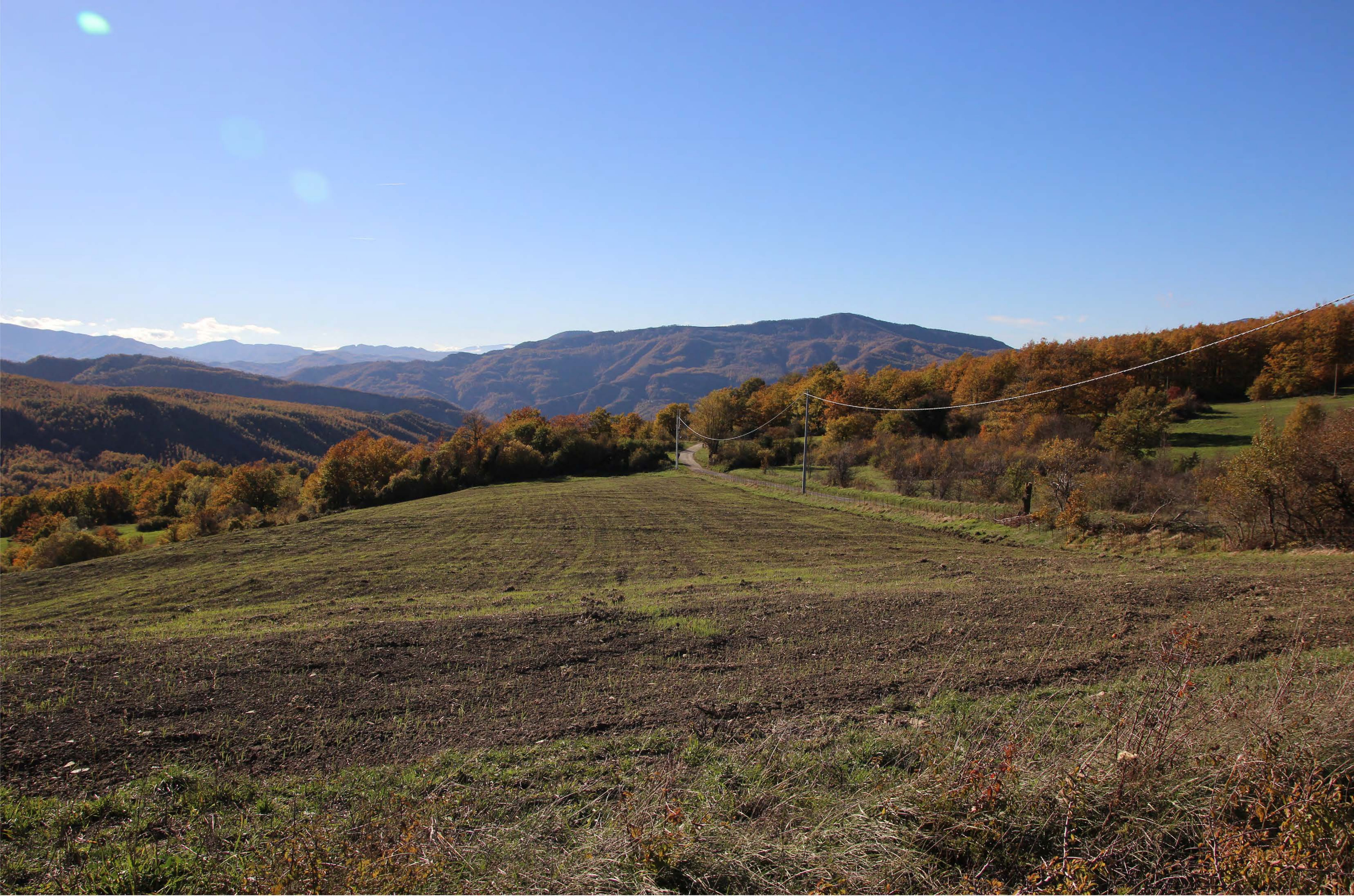
10 _ SP 84 incrocio SP Valpiano e Miratoio | ante intervento