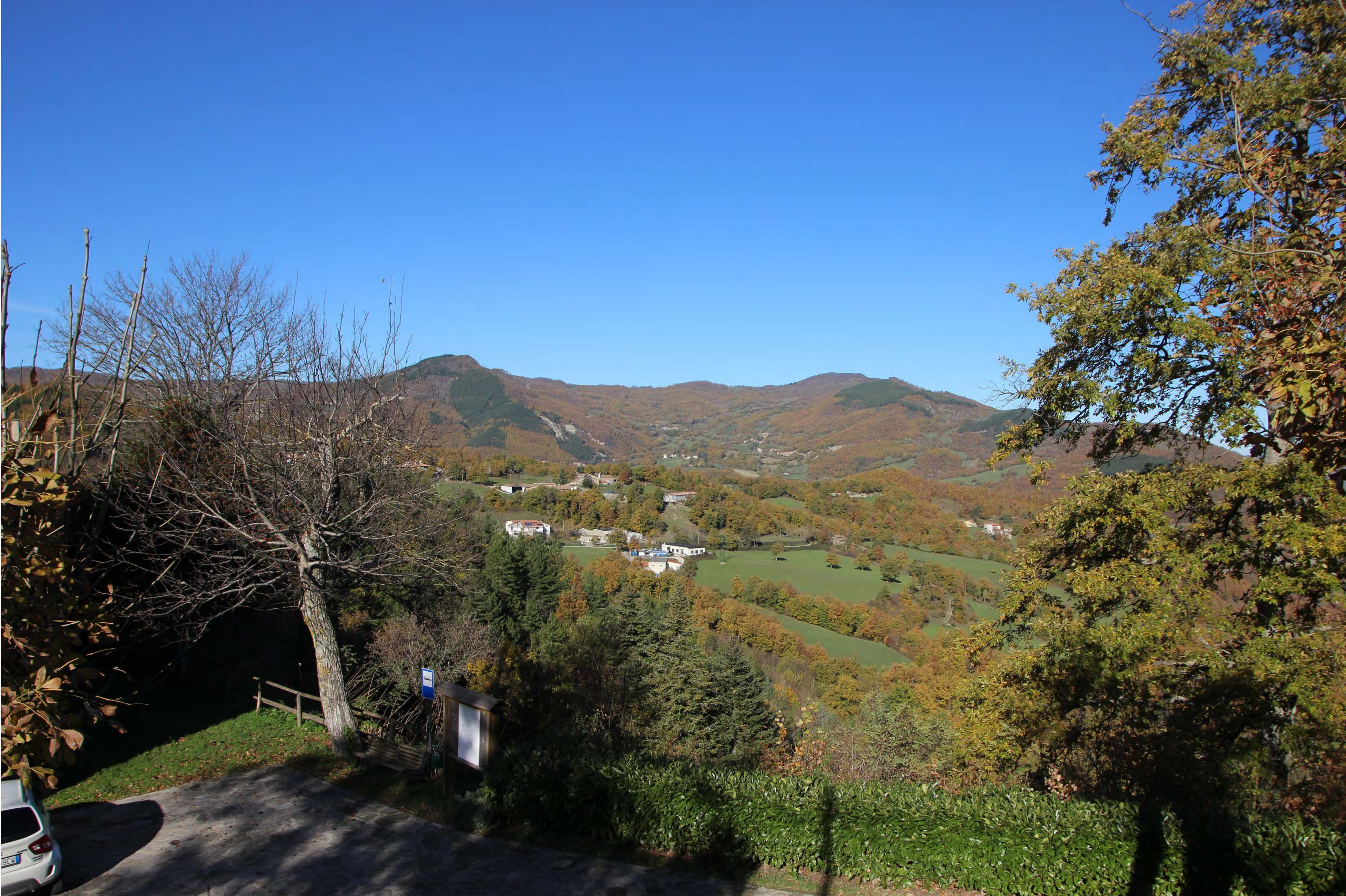
4 _ Badia Tedalda | ante intervento