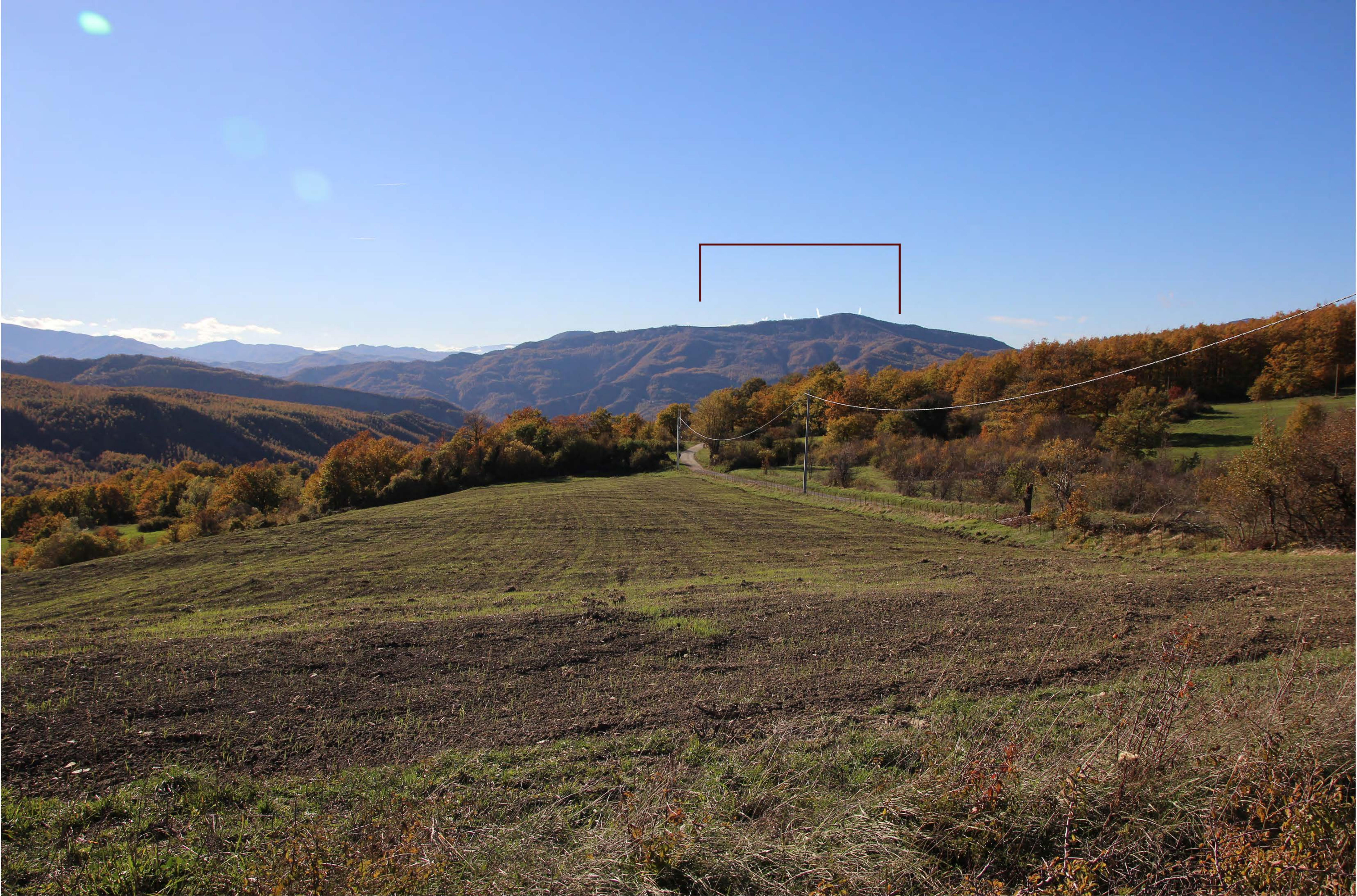
10 _ SP 84 incrocio SP Valpiano e Miratoio | post intervento