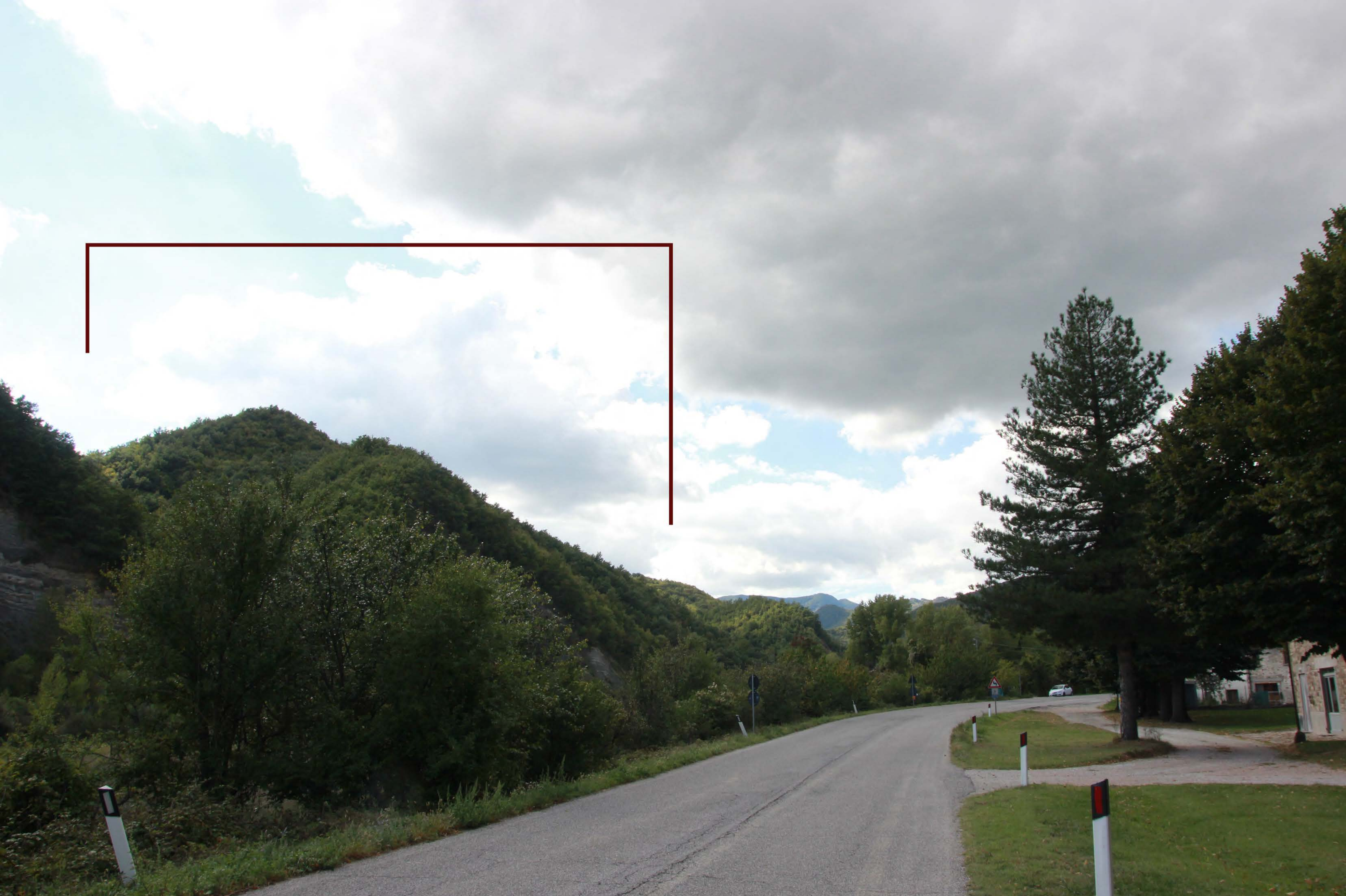
13 _ SP 76 località Molino di Sant'Antimo | post intervento | impianto non visibile