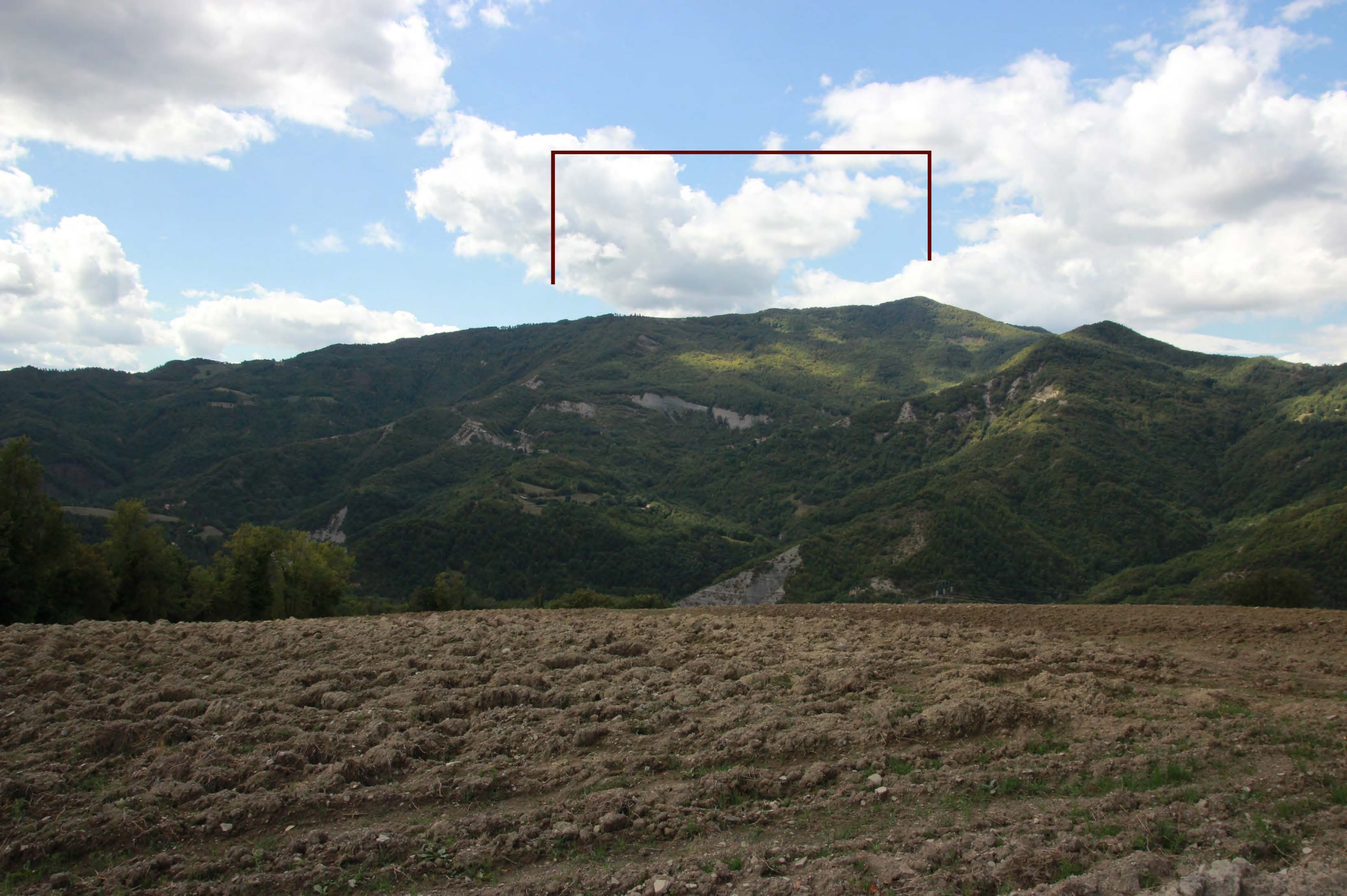
9 _ Torre di Bascio | post intervento | impianto non visibile