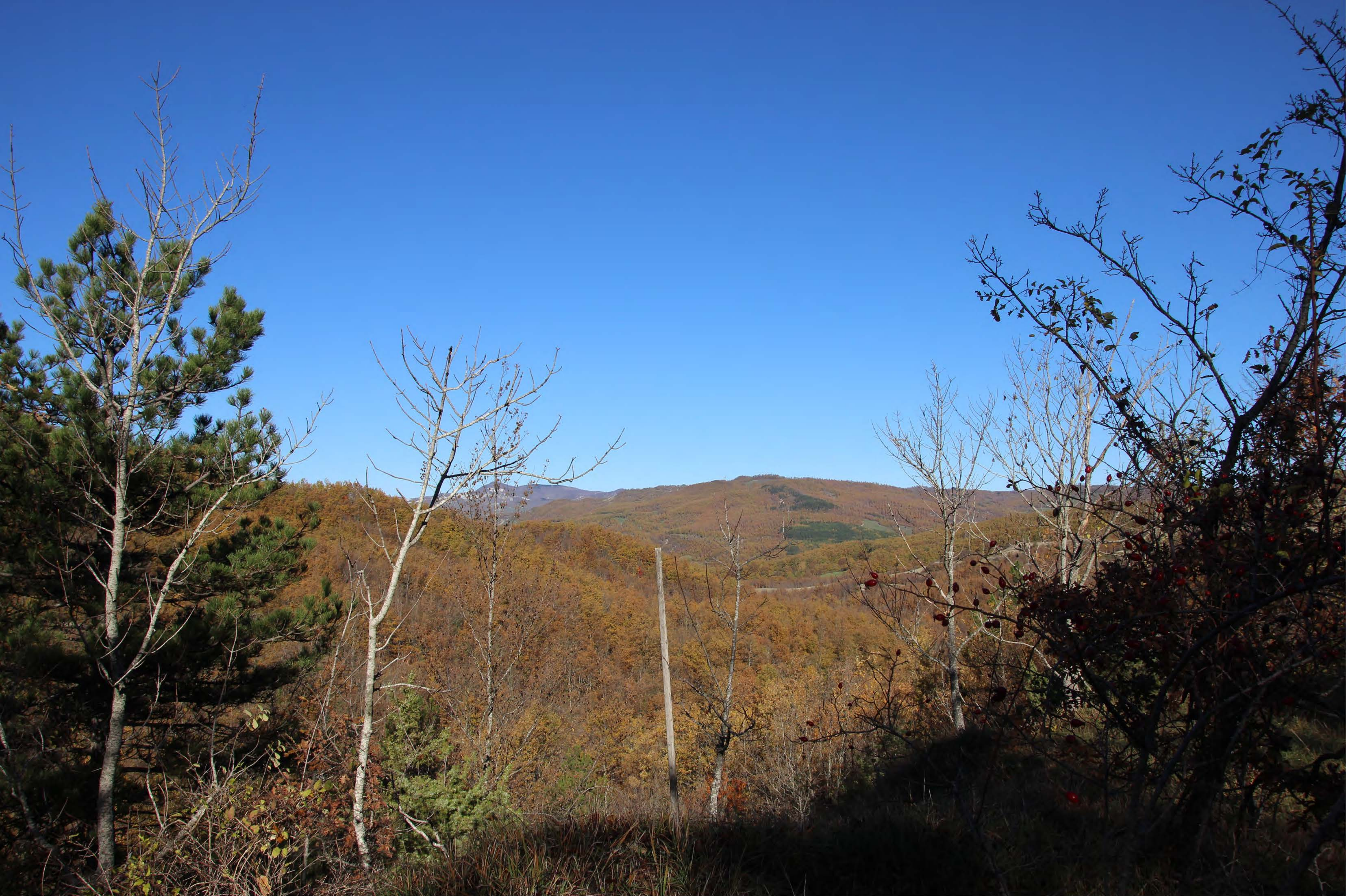
3_ SP Marecchia località Viamaggio | ante intervento