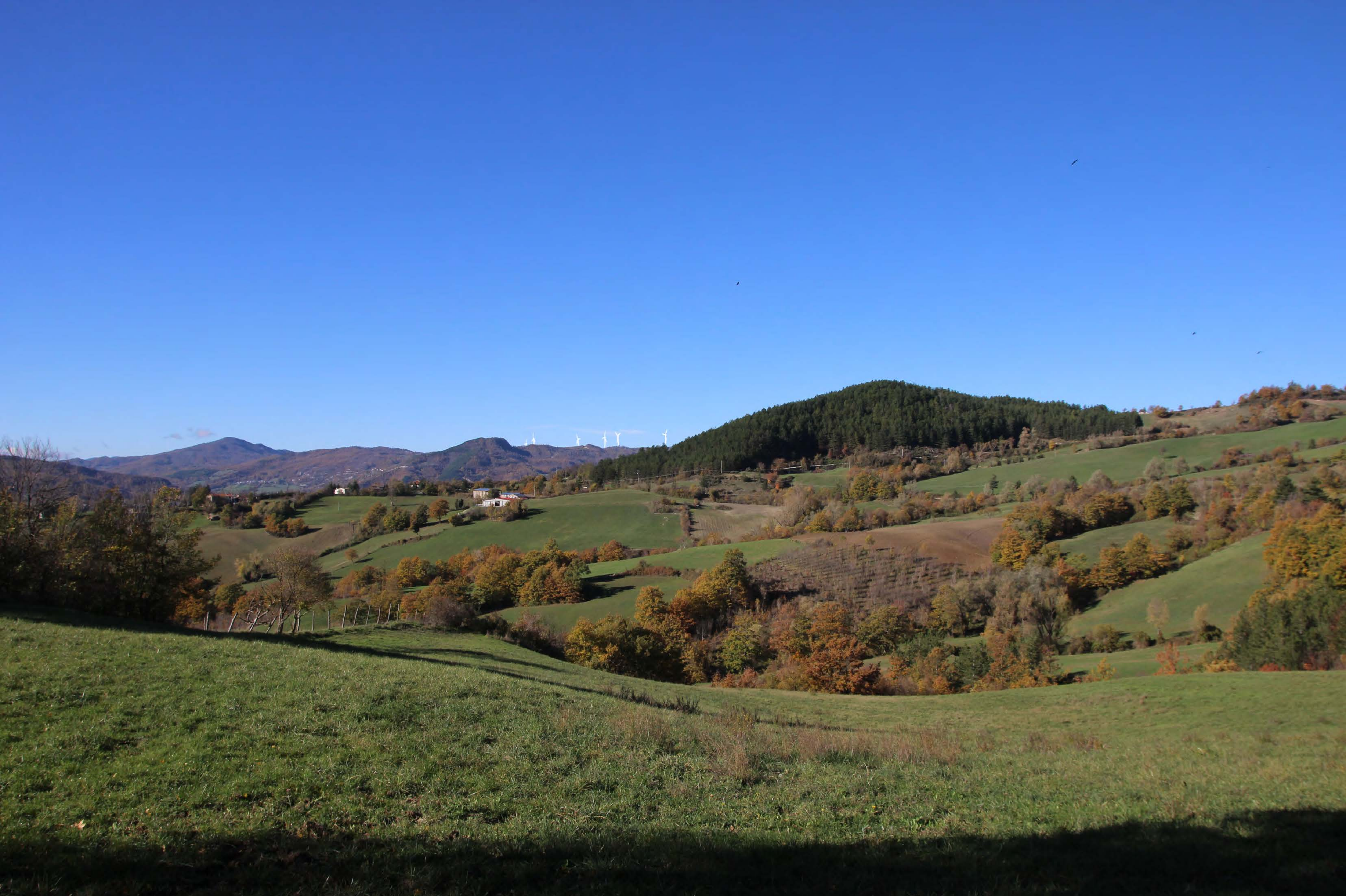
7 _ SP 49 Località Motolano | post intervento