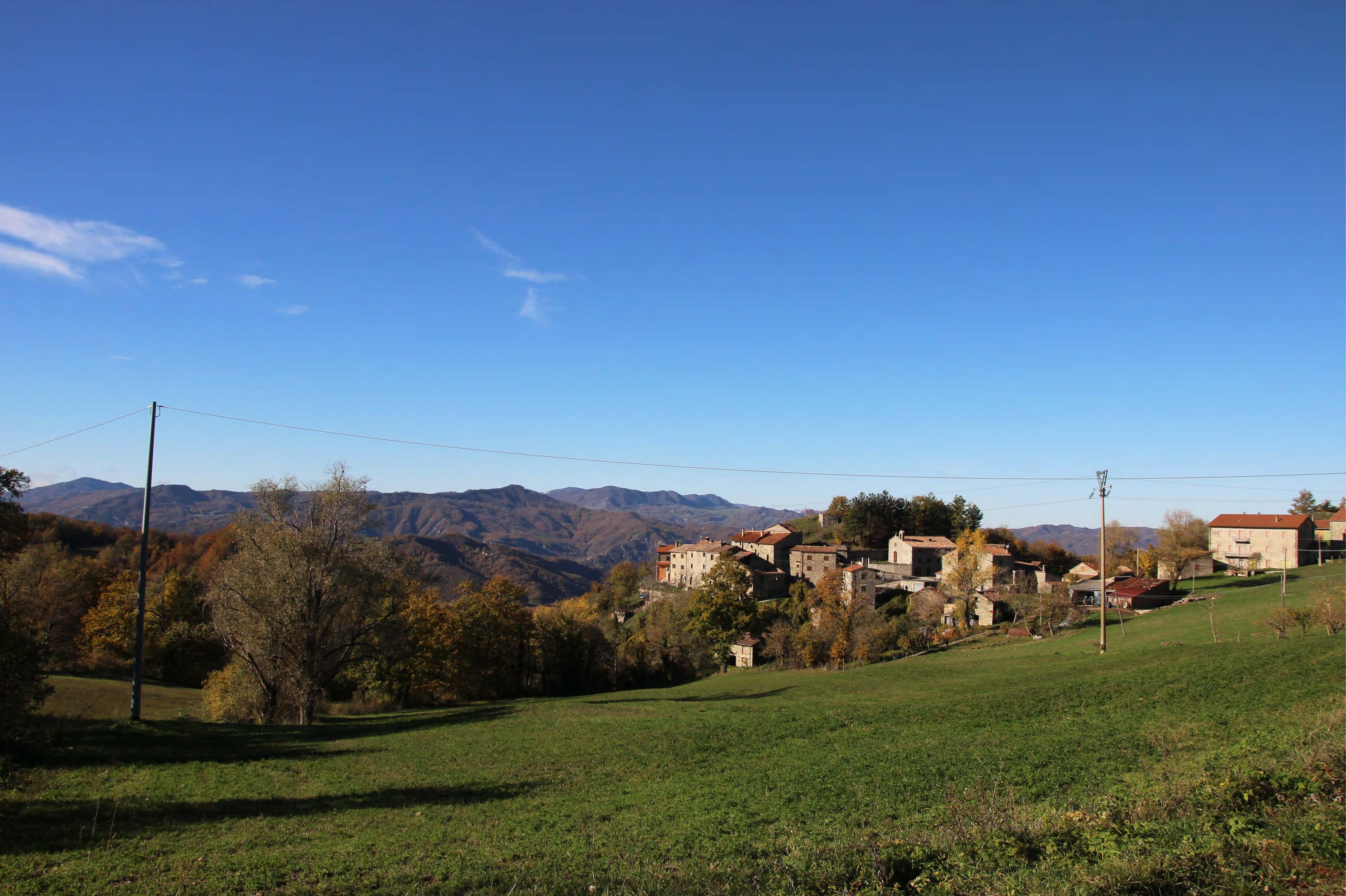
8 _ SP 52 Località Petrella Massana | ante intervento