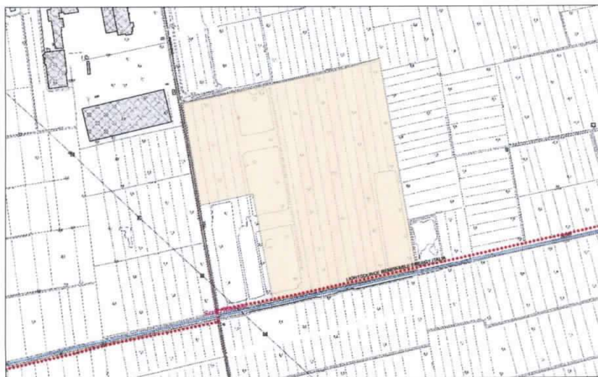
Figura 3 (Impianto "Sant'Anna")